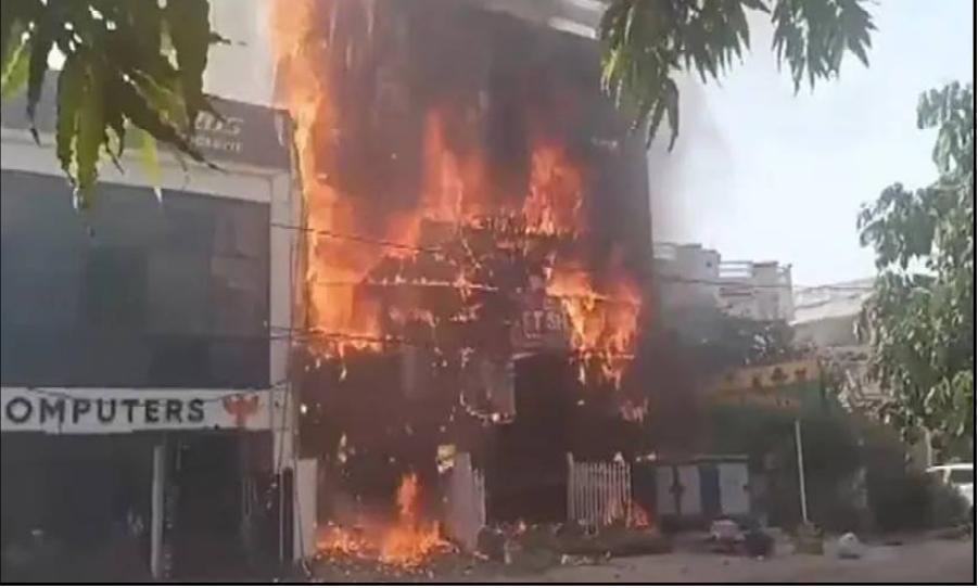
ନିଆଁରେ ଭାଇବାଳ ହେଉଥିବା ଏକ ଭିଡିଓରେ ଦେଖାଯାଇଛି ଯେ, ଜଣେ ବ୍ୟକ୍ତି ଝରକା ବାଟେ ବାହାରକୁ ଆସି ବଞ୍ଚିବାକୁ ଚେଷ୍ଟା କରୁଛନ୍ତି, କିନ୍ତୁ ସେ କୋଠାର ଏକ ଧାରକୁ ଧରି ରଖିବାରେ ଅସମର୍ଥ ହୋଇ ତଳେ ଥିବା ବାଡ଼ ଉପରେ ପଡ଼ିଯାଇଛନ୍ତି । ତାଙ୍କୁ ଗୁରୁତର ଅବସ୍ଥାରେ ଡାକ୍ତରଖାନାରେ ଭର୍ତ୍ତି

ନୂଆଦିଲ୍ଲୀ, ୨୨/୬ : ଉତ୍ତର ପ୍ରଦେଶର ରାଜଧାନୀ ଲକ୍ଷ୍ମୌରେ ଏକ ବୃଦ୍ଧବିଦାରକ ଘଟଣା ଘଟିଛି । ଉତ୍ତର-ପଶ୍ଚିମ ଲକ୍ଷ୍ମୌର ଆଲିଗଞ୍ଜ ଅଞ୍ଚଳରେ ଥିବା ଏକ କୋଠାରେ ଭୟାବହ ଅଗ୍ନିକାଣ୍ଡ ଘଟି ଅତିକମରେ ୧୫ ଜଣଙ୍କର ମୃତ୍ୟୁ ହୋଇଛି । ଏହି କୋଠାରେ ଏକ କୋଟିଂ ସେଣ୍ଟର ଚାଲୁଥିଲା, ଯେଉଁଠାରେ ନିଆଁ ଲାଗିବା ପରେ ଅନେକ ଛାତ୍ରଛାତ୍ରୀ ଫସି ରହିଥିଲେ । ସୂଚନା ଅନୁସାରେ ନିଆଁ ଏତେ ଭୟଙ୍କର ଥିଲା ଯେ ଭିତରେ ଥିବା ଛାତ୍ରଛାତ୍ରୀମାନେ ବାହାରକୁ ଆସିବା ସମ୍ଭବ ହୋଇନଥିଲା । ପ୍ରାଣ ବିକଳରେ ଥିବା ଛାତ୍ରଛାତ୍ରୀ କୋଠାରେ ପ୍ରଥମ ମହଲାକୁ ଚଳୁକ ଚେଇଁ ପଡ଼ିଥିଲେ । ସୋସିଆଲ