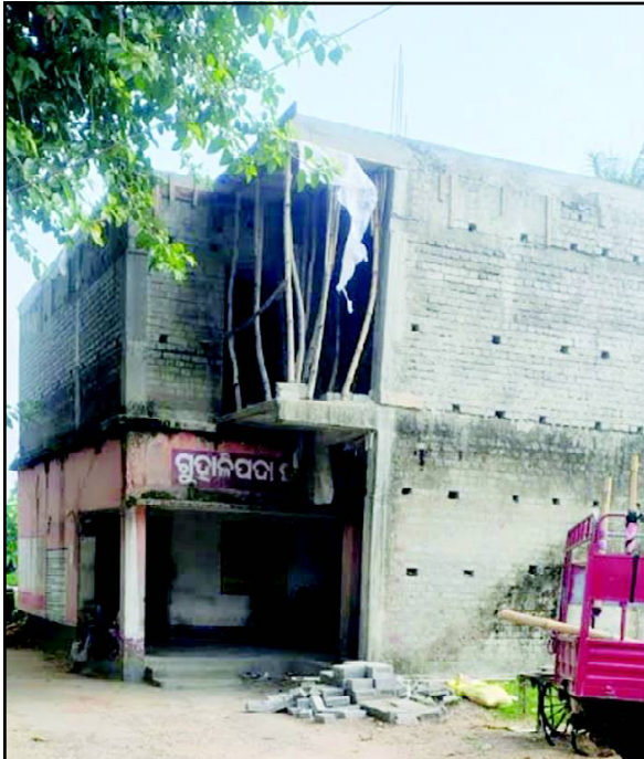
କ୍ଷୁ ଆଶ୍ଚର୍ଯ୍ୟାନ୍ୱିତ କରିଛି । ଏ ସମ୍ପର୍କରେ ବିଚିତ୍ରକ ସହ ଯୋଗାଯୋଗ କରିବାକୁ ଚକଚକ କରିବେ ବୋଲି କହିଛନ୍ତି ।

ବନ୍ୟା, ୧୯/୬ (ନି.ପ୍ର): ପଶ୍ଚିମ ବର୍ଷର ପୁରୁଣା ଛାତ ଉପରେ ସରକାରୀ ଅଙ୍ଗନ ବାଡ଼ି କେନ୍ଦ୍ର ନିର୍ମାଣ ଯେନି ସାଧାରଣରେ ଯେତିକି ବିପ୍ଳବ ପ୍ରକାଶ ପାଇଛି ତତେତାଧିକ ଅସନ୍ତୋଷ ସୃଷ୍ଟି କରିଛି । ସୂଚନାକୁ ପ୍ରକାଶ ଯେ ବନ୍ୟା ବ୍ଲକର ପୁରୁଣା ପଞ୍ଚାୟତ ଅଧୀନ ଗୋହାଳିପଦାରେ ଏକ ବନ୍ୟା ବନ୍ଧୁକ ଅଙ୍ଗନବାଡ଼ି କେନ୍ଦ୍ର ନିର୍ମାଣ ଚାଲିଛି ଯାହାକି ଏକ ପୁରୁଣା ଘର ଛାତ ଉପରେ ହେଉଥିବା ବେଳେ ସାଧାରଣରେ ଆପଣି କରାଯାଇଛି । ଏହି କେନ୍ଦ୍ରକୁ ଉଠି କରିଯିବା ପାଇଁ ଶିଶୁଙ୍କ ପକ୍ଷେ ବିପଦ ଶଙ୍କୁ ଲ ହେବ । ଏହାଛଡ଼ା ପୁରୁଣା ଛାତ ର ସ୍ତୂରୀକୁ ଉପରେ ସମେତ ରହିଛି । ଏଭଳି ପରିସ୍ଥିତିରେ ବିଭାଗୀୟ କର୍ମୀ ଯତ୍ନ ଛାଡ଼ି ଉପରେ ଏହି ଘର ନିର୍ମାଣ ପାଇଁ କିପରି ସମ୍ପତ୍ତି ଦେଲେ ତାହା ସମସ୍ତ