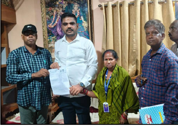
ପର୍ଯ୍ୟନ୍ତ ବନ୍ଧନ, ଯାଜ୍ଞ ଓ ଦାଖଲ ପ୍ରକ୍ରିୟାରେ ବିଏଲଓ ମାନଙ୍କୁ ସହଯୋଗ କରିବାକୁ ଅନୁରୋଧ ପ୍ରସ୍ତୁତି ପାଇଁ ଅତ୍ୟନ୍ତ ଆବଶ୍ୟକ, ପ୍ରାୟଦ୍ଵାରା କୌଣସି ଯୋଗ୍ୟ ଭୋଟର ବାଦ ନ ପଡ଼ନ୍ତି।