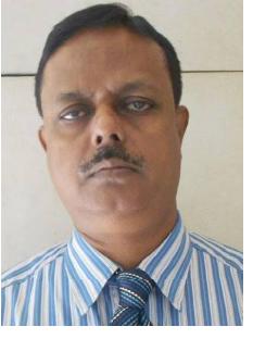
ଇବାଲୋ ଭାରତୀୟ ନେତ୍ର ରାଜ୍ୟ