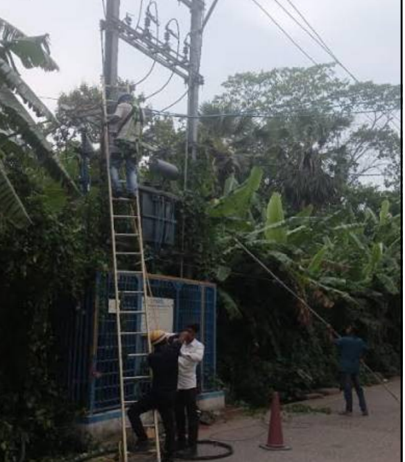
ଦ୍ୱାରା ଏପରି ଘଟିଲା । ଯଦି ଏହା ରାତ୍ରିରେ ହୋଇଥାଆନ୍ତ, ବିରାଟ ଆକାର ଧାରଣ କରିଥାନ୍ତା ବୋଲି ଲୋକଙ୍କ ଠାରୁ ଶୁଣିବାକୁ ମିଳେ । ସରକାର ଏହା ଉପରେ ଗୁରୁତ୍ୱ ଦେଇ ଭବିଷ୍ୟତ ପାଇଁ ସଚର୍ଚ୍ଚା ରହିବା ଉଚିତ ।

ବାଲେଶ୍ୱର, ୩୧/୫ (ନି.ପ୍ର): ହଠାତ୍ ମଠସାହି ବ୍ୟାଙ୍କ କଲୋନୀ ସମ୍ମୁଖରେ ଥିବା ଇଲେକ୍ଟ୍ରିକ୍ ଟ୍ରାନ୍ସଫର୍ମରରେ ନିଆଁ ଲାଗି ଘ.୨.୧୫ମି. ପର୍ଯ୍ୟନ୍ତ ଜଳିବାକୁ ଲାଗିଲା । ନିଆଁର ଝୁଲ ବାଣପରି ଦୂରିବାକୁ ଲାଗିଲା । ପାଖରେ ଥିବା ଗଛସବୁ ଜଳିଲା । ରାସ୍ତାକଡ଼ରେ ଛାଇରେ ରଖିଥିବା କାର୍ ହତାହତ ହୋଇ ଅନିୟମିତ ଭାବରେ ଚାଲି ଯାଇଥିଲା । ଦୁଇ ପାଖ ରାସ୍ତାରେ ଲୋକ ଦେଖଶାହାରୀ ରହିଥିଲେ । ପ୍ରାୟ ୧ ଘଣ୍ଟା ମଧ୍ୟରେ ଇଲେକ୍ଟ୍ରିକ୍ ବିଭାଗ ଲୋକେ ଓ ଦମକଳ ବିଭାଗ ଆସି ଲାଇନ୍ କାଟି ନିଆଁକୁ ଆୟତ୍ତ କରାଗଲା । ଏଥିରେ କୌଣସି ଧନ କାବନ କ୍ଷୟ କ୍ଷତି ହୋଇନାହିଁ । ଲୋକଙ୍କ ମତରେ ଇଲେକ୍ଟ୍ରିକ୍ ବିଭାଗର ଅବହେଳା, କେବଳ ତାରବାଳାଙ୍କ ଗୋଛା ଗୋଛା ତାର, ମ୍ୟୁନିସିପାଲିଟି ଦ୍ୱାରା ଲଗାପତ୍ର ସମା ନ ରହିବା