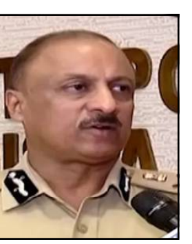
ହୋଇଛି । ୨୦ କିଲୋରେ ସାନ୍ଦର ଅପରାଧୀଙ୍କ ଉପରେ ରହିଛି ନକର । ସରେଶ୍ୱର ନକଲେ କଡ଼ା କାର୍ଯ୍ୟାନୁଷ୍ଠାନ ହେବ ବୋଲି ଡିଜିପି ତେତାବନୀ ଦେଇଛନ୍ତି ।

ଭୁବନେଶ୍ୱର, ୨୯/୫ (ନି.ପ୍ର.): ଓଡ଼ିଶାରେ ନାହିଁ ଅପରାଧୀଙ୍କ ସ୍ଥାନ । ତାଲିକା ଅପରାଧୀଙ୍କ ତାଲିକା ପ୍ରସ୍ତୁତି । ଅପରାଧୀଙ୍କ ବିରୋଧରେ ନିଆଁ ଧରିବା କଡ଼ା ଆକ୍ସନ । ଆଇନ ଭଙ୍ଗୁଥିବା ହେଲେ, ଅନ୍ ଦ ସ୍ୱର୍ ହେବ ଆକ୍ସନ । ଏଭଳି କଡ଼ା ତେତାବନୀ ଦେଇଛନ୍ତି ପୁଲିସ୍ ଡିଜି । ୫ ହଜାର ୭ ଶହରୁ ଅଧିକ ଅପରାଧୀଙ୍କ ବିରୋଧରେ କାମିନ ବିହୀନ ଗିରଫ ପରଘାନା କାରି କରାଯାଇଛି । ମାଳ ମାଳ ଅପରାଧରେ ସମ୍ପୃକ୍ତ ଅଭିଯୁକ୍ତଙ୍କୁ ଚଢ଼ିପାର ପାଇଁ ପ୍ରକ୍ରିୟା ଆରମ୍ଭ ହୋଇଛି । ୨୦ କିଲୋରେ ସାନ୍ଦର ଅପରାଧୀଙ୍କ ଉପରେ ରହିଛି ନକର । ସରେଶ୍ୱର ନକଲେ କଡ଼ା କାର୍ଯ୍ୟାନୁଷ୍ଠାନ ହେବ ବୋଲି ଡିଜିପି ତେତାବନୀ ଦେଇଛନ୍ତି ।