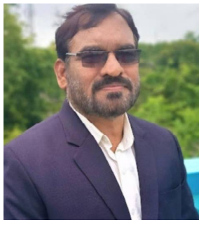
ଗଣତନ୍ତ୍ର ସାଧାରଣ ଜନତାଙ୍କ