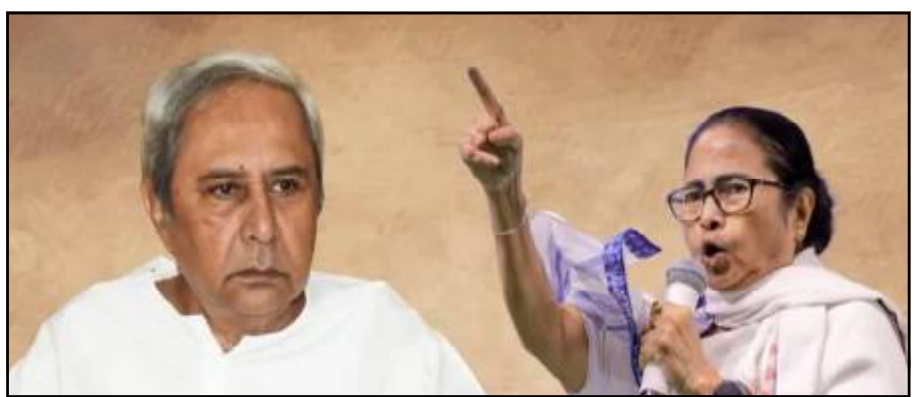
ନିଜ ଦଳକୁ ସମାଲିକା ଏମାନଙ୍କ ପାଇଁ ବେଶ ଚ୍ୟାଲେଂଜ ହୋଇପଡ଼ିଛି । ଏବେ ଉଭୟ ଆଞ୍ଚଳିକ ଦଳର ସମଦଶା । ତୁଳନାତ୍ମକ ପୂର୍ବରୁ ବିଜେଡିରେ ନେତା ହାଉଜା ହେଉଥିଲେ । ଦଳର ବିକେଟ ପାଇଁ ଲମ୍ବା ଲାଇନ ଲାଗୁଥିଲା । ଏବେ ସେ ସ୍ଥିତି ନାହିଁ । ବିଜେଡିରେ ନେତା ସଂକଟ ଜଳଜଳ । କ୍ଷମତାରୁ ଯିବା ପରେ ଦଳ ଛାଡ଼ୁଛନ୍ତି ସାଂସଦ, ବିଧାୟକ, ନେତା, କର୍ମୀ । ବିଜେଡିର ଅଭେଦ୍ୟ ଦୁର୍ଗ ଧାରେ ଧାରେ ଧରାଶାୟୀ ହେଉଛି । ନିଜ ଧାଡ଼ି କରି ନେତା ବିକେଟପରେ ସାମିଲ ହେଉଛନ୍ତି ।

ନୂଆଦିଲ୍ଲୀ/ଭୁବନେଶ୍ୱର, ୨୮/୫ : ପୂର୍ବ ଭାରତ ରାଜନୀତିରେ ପାଚେନା ଭଳି ଛିଡ଼ା ହୋଇଥିଲେ ଭାଇ-ଭଉଣୀ । ବର୍ଷ ବର୍ଷ ଧରି ଜାତୀୟ ଦଳକୁ ଧୁଳି ଚଟାଇଥିଲେ । ହେଲେ କ୍ଷମତା ଯିବା ପରେ ନିଜର ଅର୍ଦ୍ଧକୁ ବଂଚାଇବାକୁ ଅଗ୍ରାଧରଣା ଦେଉଛନ୍ତି । ହିଁ ଆମେ ନବୀନ ପଟ୍ଟନାୟକ ଓ ମମତା ବାନାର୍ଜୀଙ୍କ କଥା ହିଁ କହୁଛୁ । ଏକଦା ଦେଶର ରାଜନୈତିକ ଦୃଶ୍ୟପଟ୍ଟରେ ଥିଲେ ପୁର ଧୂରଧର ପାଇଁ ବେଶ ଚ୍ୟାଲେଂଜ ହୋଇପଡ଼ିଛି । ଏବେ ଉଭୟ ଆଞ୍ଚଳିକ ଦଳର ସମଦଶା । ତୁଳନାତ୍ମକ ପୂର୍ବରୁ ବିଜେଡିରେ ନେତା ହାଉଜା ହେଉଥିଲେ । ଦଳର ବିକେଟ ପାଇଁ ଲମ୍ବା ଲାଇନ ଲାଗୁଥିଲା । ଏବେ ସେ ସ୍ଥିତି ନାହିଁ