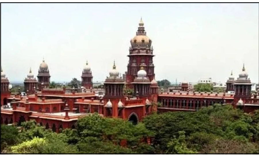
ମାତ୍ରାସ୍ ହାଇକୋର୍ଟରେ ଆର. ଆଦେଶନ ଦାୟର କରିଥିଲେ । ଆଦେଶନକାରୀ ଅଭିଯୋଗ କରିଥିଲେ ଯେ, ଆଇନକ ବାଲାକୀକ ନିର୍ଦ୍ଦେଶିତ ଓ ସୁପରୀୟର ସୂର୍ଯ୍ୟା ଓ ତ୍ରିଷା ଅଭିନୀତ ଫିଲ୍ମ 'କରୁସୁ' ରେ କୋର୍ଟ ଓ ଆଇନ ବ୍ୟବସ୍ଥା ଅତ୍ୟନ୍ତ ଆପତ୍ତିକରଣ ଭାବେ ଚିତ୍ରଣ

ନୂଆଦିଲ୍ଲୀ, ୨୮/୫ : ନ୍ୟାୟପାଳିକା ଓ ବିଚାରପତି ଦୁର୍ନୀତିଗ୍ରସ୍ତ ହେବା ସମ୍ପର୍କରେ ମାତ୍ରାସ୍ ହାଇକୋର୍ଟ ଏକ ଗୁରୁତ୍ୱପୂର୍ଣ୍ଣ ଟିପ୍ପଣୀ କରିଛନ୍ତି । ନ୍ୟାୟପାଳିକାରେ ଦୁର୍ନୀତି ଥିବା କଥାକୁ କେହି ଖଣ୍ଡନ କରିପାରିବେ ନାହିଁ, ଦୁର୍ନୀତିଗ୍ରସ୍ତ ବିଚାରପତି ଆଗରୁ ମଧ୍ୟ ଥିଲେ ଓ ଏବେବି ଅଛନ୍ତି ବୋଲି ମାତ୍ରାସ୍ ହାଇକୋର୍ଟ କହିଛନ୍ତି । ଏକ ଆଦେଶରେ ଶୁଣାଣି କରି ହାଇକୋର୍ଟ ଏପରି ଚକିତ କରିଦେବା ପରି କଥା କହିଛନ୍ତି । ଏହାପୂର୍ବରୁ ପ୍ରାୟ ୧୦ କୋର୍ଟରେ ଥିବା ଦୁର୍ନୀତି ଉପରେ ଆଧାରିତ ଚାର୍ଜିଡ୍ କଲେଜିଟ୍ 'କରୁସୁ' ଉପରେ ପ୍ରତିବନ୍ଧ ଲଗାଇବାକୁ ସ୍ୱେଚ୍ଛା ଭାବେ ମନା କରିଦେଇଛନ୍ତି । ସୁତରାଂସାଧାରୀ,