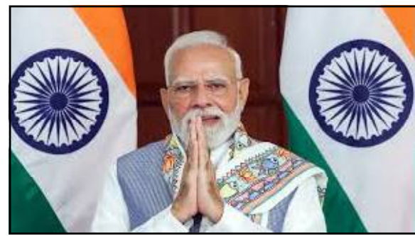
ମିଳିଛି ବୋଲି କହିଛନ୍ତି ମୁଖ୍ୟମନ୍ତ୍ରୀ ମୋହନ ମାଝୀ । ସରକାରଙ୍କ ୨ ବର୍ଷ ପୂର୍ତ୍ତି ପାଳନ । ନିରାତମ୍ଭର ଭାବେ ପାଳନ କରିବାକୁ ମୁଖ୍ୟମନ୍ତ୍ରୀଙ୍କ ପରାମର୍ଶ । ୧୨୭ ୨୧ ଜୁନ ପର୍ଯ୍ୟନ୍ତ ପାଳନ କରାଯିବ । ଉତ୍ସବ ପରିବର୍ତ୍ତେ ତଥ୍ୟ ପ୍ରସାର ଉପରେ ଅଧିକ ଧ୍ୟାନ ଦେବାକୁ ପରାମର୍ଶ ଦେଇଛନ୍ତି ମୋଦୀଙ୍କ ପାଖରେ ପହଞ୍ଚାଇବା ଉପରେ ମୁଖ୍ୟମନ୍ତ୍ରୀଙ୍କ ଗୁରୁତ୍ୱାହାର ।

ଭୁବନେଶ୍ୱର, ୨୭/୫ (ନି.ପ୍ର): ଓଡ଼ିଶା ଆସିବେ ପ୍ରଧାନମନ୍ତ୍ରୀ ନରେନ୍ଦ୍ର ମୋଦୀ । ଭୁବନେଶ୍ୱରରେ ଅନୁଷ୍ଠିତ ଏକ ଉପାଦାନ କାର୍ଯ୍ୟକାରୀରେ ସ୍ୱେଚ୍ଛା କଲେ ମୁଖ୍ୟମନ୍ତ୍ରୀ ମୋହନ ମାଝୀ । ରାଜ୍ୟ ସରକାରଙ୍କ ୨ ବର୍ଷ ପୂର୍ତ୍ତି ଉତ୍ସବରେ ଯୋଗଦେବେ ପ୍ରଧାନମନ୍ତ୍ରୀ । ଅଭିଭାଷଣରେ ଏ ସଂପର୍କରେ ଉଲ୍ଲେଖ କରି ମୁଖ୍ୟମନ୍ତ୍ରୀ କହିଛନ୍ତି ଯେ, ମୁଁ ଦିଲ୍ଲୀ ଯାଇ ପ୍ରଧାନମନ୍ତ୍ରୀଙ୍କୁ ନିମନ୍ତ୍ରଣ ପତ୍ର ଦେଇଥିଲି । ଗତ କାଲି ଏନେଇ ସବୁକି ସଂକେତ