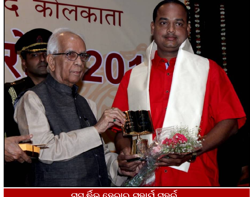
ସମ୍ବର୍ଦ୍ଧିତ ହେବାର ମହାର୍ଯ୍ୟ ମୁହୂର୍ତ୍ତ...