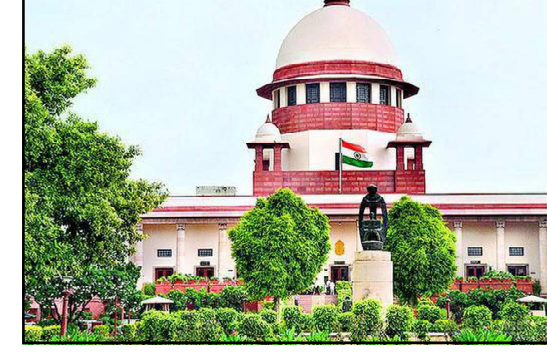
ବିମାନବନ୍ଦର ଭଳି ସାର୍ବଜନୀନ ସ୍ଥାନରୁ ତୁରନ୍ତ ବୁଲା କୁକୁରମାନଙ୍କୁ ହଟାଇବା ନିର୍ଦ୍ଦେଶ ଆଶ୍ଚର୍ଯ୍ୟକାରୀ ଭାବେ ରଖାଯିବ । ଚୀନାକରଣ କିମ୍ବା ବନ୍ଧ୍ୟାକରଣ ପରେ ମଧ୍ୟ ସେମାନଙ୍କୁ ସାର୍ବଜନୀନ ସ୍ଥାନରୁ ଫେରାଇ ଆଣାଯାଇପାରିବ ନାହିଁ । ନିର୍ଦ୍ଦେଶକୁ ଅବମାନନା କଲେ କଠୋର କାର୍ଯ୍ୟାନୁଷ୍ଠାନ ଗ୍ରହଣ କରାଯିବ । ସେହିଭଳି ରେଭିଜ୍ ଓ ବିପଦଜନକ କୁକୁରଙ୍କ ବିରୋଧରେ ଅତିକଠୋର ହୋଇ ସୁପ୍ରିମକୋର୍ଟ କହିଛନ୍ତି, ହିଂସ୍ର କୁକୁରଙ୍କୁ ଦୟାପୂର୍ଣ୍ଣ ମୃତ୍ୟୁ ଦିଆଯାଇପାରିବ । ଅତ୍ୟଧିକ ଆକ୍ରମଣାତ୍ମକ ହେଲେ ଭେଟେନିନାରି ବିଶେଷଜ୍ଞଙ୍କ ମତାମତ