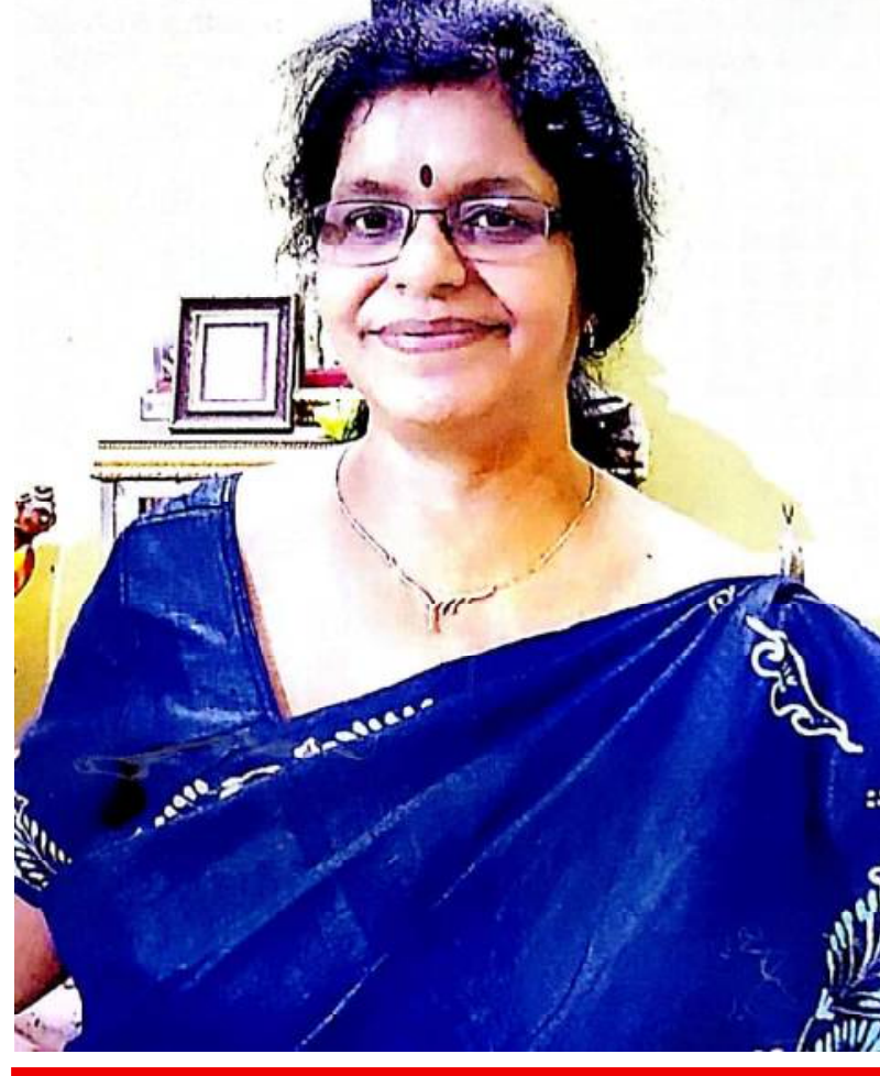
ପଢ଼ିଲା ବେଳେ ବିଶିଷ୍ଟ ସାହିତ୍ୟିକା ପ୍ରତିଭା ରାୟଙ୍କର 'ବର୍ଷା ବସନ୍ତ ବୈଶାଖ' ଉପନ୍ୟାସଟିକୁ ଏକାଧିକ ବାର ପଢ଼ି ନାହିଁ। ଉପନ୍ୟାସଟିକୁ ଏକାଧିକ ବାର ପଢ଼ି ନାହିଁ। ଉପନ୍ୟାସଟିକୁ ଏକାଧିକ ବାର ପଢ଼ି ନାହିଁ।