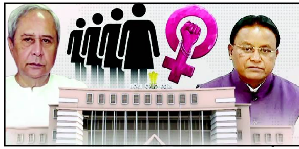
କହିଛନ୍ତି, ମହିଳା ସଂରକ୍ଷଣ କଥା ଆସିଲେ ବିରୋଧୀ ପକ୍ଷରୁ ଦେବା ସହ ରାଜନୈତିକ ଅଧିକାରକୁ ବଞ୍ଚିତ କରୁଛନ୍ତି । ସେପଟେ ଭିନ୍ନ ଅଭାବରେ ଶାସକ ଦଳକୁ ସମାଲୋଚନା କରିଥିଲେ ବିରୋଧୀ ଦଳ ନେତା ନବାନ ପଟ୍ଟନାୟକ । ମୁଖ୍ୟମନ୍ତ୍ରୀଙ୍କ ଜିଲ୍ଲାକୁ

ଭୁବନେଶ୍ୱର, ୩୦/୪ (ନି.ପ୍ର): ବିନିକିଆ ସ୍ୱତନ୍ତ୍ର ଅଧିବେଶନ ଆରମ୍ଭରେ ପ୍ରଥମେ ମୁଖ୍ୟମନ୍ତ୍ରୀ ଗଣତନ୍ତ୍ରରେ ମହିଳାଙ୍କ ଭୂମିକା ପ୍ରସଙ୍ଗରେ ଆଲୋଚନା ନେଇ ପ୍ରସ୍ତାବ ରଖିଥିଲେ । ଏହାପରେ ବିରୋଧୀଙ୍କୁ ଟାର୍ଗେଟ୍ କରି ଶାଶିତ ଆକ୍ରମଣ କରିଥିଲେ । ମୁଖ୍ୟମନ୍ତ୍ରୀ