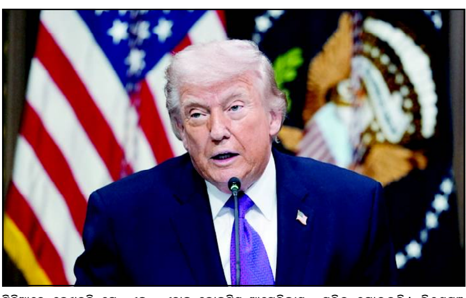
ମିଡ଼ିଆରେ ଲେଖୁଛନ୍ତି ଯେ, ଏକ ଝଡ଼ ଆସୁଛି, ଏବଂ ଏହାକୁ କେହି ରୋକି ପାରିବେ ନାହିଁ । ବିଶେଷତା ଯୋଗୁ ଯୋଗାଯୋଗ ଟ୍ରମ୍ପ ସୋସିଆଲ୍

ନୂଆଦିଲ୍ଲୀ, ୩୦/୪ : ଆମେରିକା ରାଷ୍ଟ୍ରପତି ଡୋନାଲ୍ଡ୍ ଟ୍ରମ୍ପ ପୁଣି ଥରେ ଏକ ଟାକ୍ସଲ୍ୟାକ୍ସ ପୋଷ୍ଟ କରିଛନ୍ତି, ଯେଉଁଥିରେ ବାବି କରାଯାଇଛି ଯେ ଏକ ଝଡ଼ ଆସୁଛି । ଆମେରିକା ଏବଂ ଇରାନ ମଧ୍ୟରେ ଉଭୟେ ଦୁର୍ଭି ପାଇଥିବା ସମୟରେ ଟ୍ରମ୍ପଙ୍କ ଟୁଥ୍ ସୋସିଆଲ୍ ପୋଷ୍ଟ ଆସିଛି । ଅସ୍ତବିତ୍ତି ସତ୍ତ୍ୱେ, ଉଭୟ ପକ୍ଷ ଏକ ରୁକ୍ଷରେ ପହଞ୍ଚିପାରି ନାହାନ୍ତି । ପୁନର୍ବାର ମୁକ୍ତ ହେବାର ଆଶଙ୍କା ରହିଛି । ଟ୍ରମ୍ପଙ୍କ ଏହି ମନ୍ତବ୍ୟକୁ ଇରାନ ଉପରେ ଏକ ବଡ଼ ଆକ୍ରମଣ ପାଇଁ ପ୍ରସ୍ତୁତି ସହିତ ରୋକି ପାରିବେ ନାହିଁ । ବିଶେଷତା ଯୋଗୁ ଯୋଗାଯୋଗ ଟ୍ରମ୍ପ ସୋସିଆଲ୍