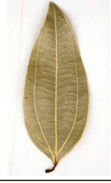
ସହାୟକ ହୋଇଥାଏ । ଅନେକ ଲୋକ ଶୋଇବା ପୂର୍ବରୁ ଏକ ତେଜପତ୍ର ଉପରେ ନିଜର ବ୍ୟକ୍ତିଗତ ଉପାଦାନ ରଖିବାକୁ ପସନ୍ଦ କରନ୍ତି ।