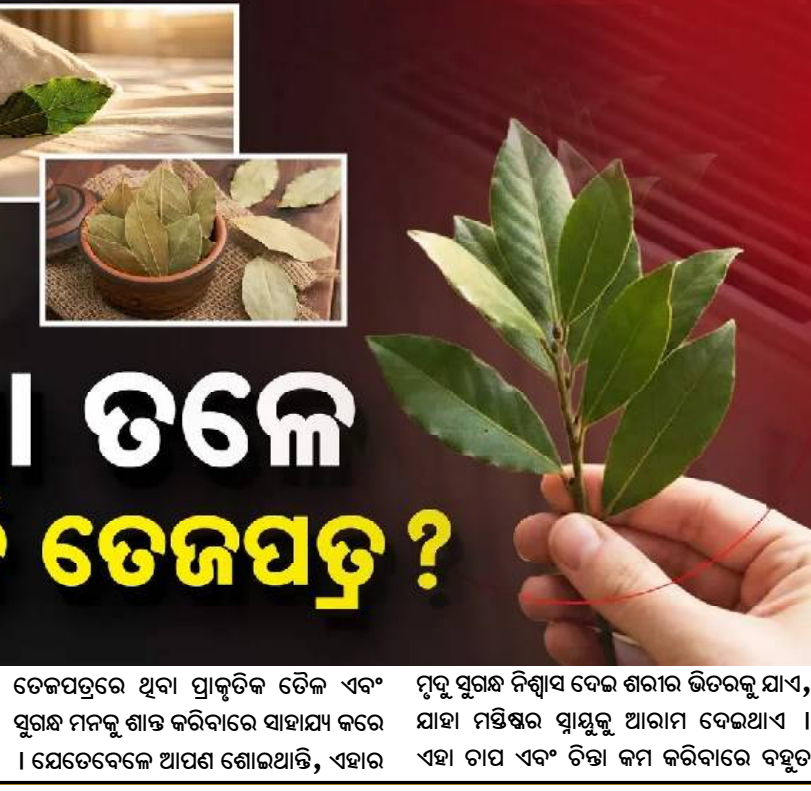
ଲୋକମାନେ ତକିଆ ତଳେ ତେଜପତ୍ର ରଖିବାର ସବୁଠାରୁ ବଡ଼ କାରଣ ହେଉଛି ଗରମ ଏବଂ ଶାନ୍ତିପୂର୍ଣ୍ଣ ନିଦ୍ରା । ବିଶେଷତା ମତରେ, ତେଜପତ୍ରରେ ଥିବା ପ୍ରାକୃତିକ ତୈଳ ଏବଂ ସୁଗନ୍ଧ ମନକୁ ଶାନ୍ତ କରିବାରେ ସାହାଯ୍ୟ କରେ ।

ଆଜିକାଲିର ବ୍ୟସ୍ତଜୀବନ ଜୀବନଶୈଳୀରେ ମଣିଷ ନିଜ ସ୍ୱାସ୍ଥ୍ୟ ଏବଂ ମାନସିକ ଶାନ୍ତି ପାଇଁ ବିଭିନ୍ନ ପ୍ରକାରର ପରୀକ୍ଷା ନିରୀକ୍ଷା କରୁଛି । ନିକଟରେ ସୋସିଆଲ ମିଡିଆରେ ଏକ ଅଜବ କିଛି ପ୍ରଭାବଶାଳୀ ଘଟଣା ଘଟିଥିଲା ।