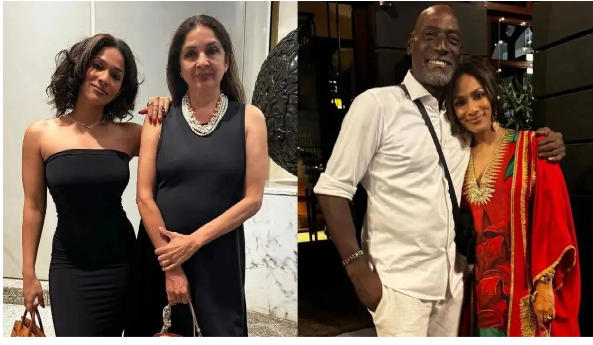
ମାସାବାଙ୍କ ଘନିଷ୍ଠତାକୁ ନେଇ ନୀନା ମୁହଁ ଖୋଲିଛନ୍ତି। ବାପ-ଝିଅଙ୍କ ଘନିଷ୍ଠତାକୁ ନେଇ ସେ ଖୁସି ଅଛନ୍ତି। “ଉଭୟ ଅନେକ ସମୟରେ ଯୋଗାଯୋଗରେ ରୁହନ୍ତି,

ଅଲଗା ରହିଛନ୍ତି। ବିଭେଦ ପୂର୍ବରୁ କିଛି ସେମାନେ କନ୍ୟା ସତୀନ ମାସାବାକୁ ପାଇଥିଲେ। ମାସାବାଙ୍କୁ ନୀନା ନିଜ ହେପାଟାଇଟିସରେ ପାଳି ବଢ଼ କରିଥିଲେ। ମାସାବା ବଡ଼ ହେବା ପରେ କିଛି ପିତା ଭିକିଆର୍ ରିଟାର୍ଟସଙ୍କ ସହ ସମ୍ପର୍କ ରଖି ଆସିଛନ୍ତି। ଅନେକ ସମୟରେ ଏହି ବାପ-ଝିଅଙ୍କ ଘନିଷ୍ଠତାକୁ ନେଇ ଚର୍ଚ୍ଚା ହୋଇଥାଏ। ନିକଟରେ ଏକ ସାକ୍ଷାତକାରରେ ରିଟାର୍ଟସ-