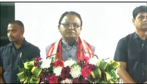
ଓଡ଼ିଶାରେ ଶିଳ୍ପ ବିପ୍ଳବ ଆରମ୍ଭ ହୋଇଛି । ରାଜ୍ୟ ଏବେ ୧୨୦ ବିଲିୟନ ଅର୍ଥନୀତିରେ ଅଛି ।

ଭୁବନେଶ୍ୱର, ୨୫/୧୧ (ନି.ପ୍ର): ୧୦ ବର୍ଷ ଭିତରେ ବଦଳିଯିବ ଓଡ଼ିଶାର ଚିତ୍ର , ସମୃଦ୍ଧ ହେବ ଓଡ଼ିଶା । ଦେଶର ଶ୍ରେଷ୍ଠ ୫ ରାଜ୍ୟମାନଙ୍କ ଭିତରେ ରହିବ ଓଡ଼ିଶା । ଉତ୍କଳ ରାଜ୍ୟ ଅଫ କର୍ମର୍ଥ ଆଣ୍ଡ ଇଣ୍ଡଷ୍ଟ୍ରି ପକ୍ଷରୁ ଆୟୋଜିତ ସମୃଦ୍ଧ ଓଡ଼ିଶା କନ୍‌କ୍ୱେଭୁ ଉଦଘାଟନ କରି ମୋହନ ମାଝୀ ଆଗାମୀ ଓଡ଼ିଶାର ସ୍ୱପ୍ନ ଉପରେ ଏମିତି ଆଲୋଚନା କରିଛନ୍ତି । ମୁଖ୍ୟମନ୍ତ୍ରୀ କହିଛନ୍ତି ,