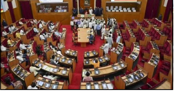
ଅନେକ କାରଣ ମଧ୍ୟରୁ ବୁଧ୍ଧି ଭିନ୍ନ, ଭଲିଏମ୍ ଗ୍ୟାମିଂ ଅନ୍ୟତମ । ଏସବୁକୁ ନେଇ ବିଧାନସଭା

ଭୁବନେଶ୍ୱର, ୨୫/୧୧ (ନି.ପ୍ର): ନୂଆପତ୍ତା ଉପନିର୍ବାଚନରେ ବଡ଼ ବ୍ୟବଧାନରେ କ୍ରିଡ଼ିଲା ବିଜେଡି । ବୃଦ୍ଧ ମନୋବଳ ନେଇ ଆସନ୍ତା ୨୭ ତାରିଖରୁ ଆରମ୍ଭ ହେବାକୁ ଥିବା ବିଧାନସଭାକୁ ଓହ୍ଲାଇବ ଶାସକ ଦଳ । ସେପଟେ ପରାଜୟକୁ ସ୍ୱୀକାର କରୁନାହାନ୍ତି ବିରୋଧୀ । ଭୋଟ ଅନିୟମିତତା ପ୍ରସଙ୍ଗ ଧରି ସରକାରଙ୍କୁ ଘେରୁଛି ବିଜେଡି । ଆଉ କଂଗ୍ରେସ ବି କହୁଛି ଯେ ଉପନିର୍ବାଚନ କ୍ରିଡ଼ିବା ପଛର