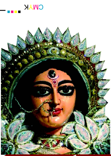
ଯା ଦେବୀ ସର୍ବଭୂତେଷୁ...

website : www.dhwanipratidhwani.net email: pratidhwani.dhwani@gmail.com