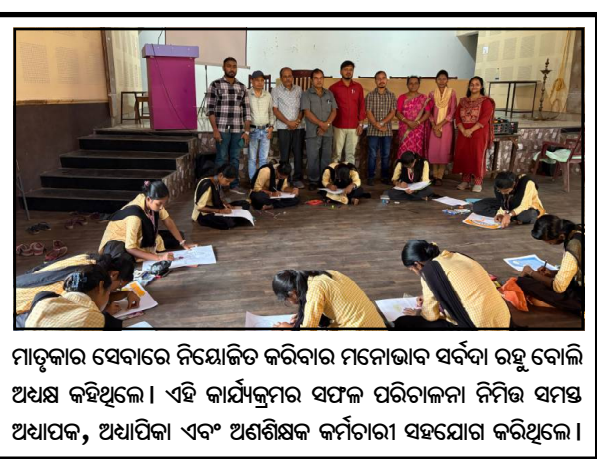
ମାତୃକାର ସେବାରେ ନିଯୋଜିତ କରିବାର ମନୋଭାବ ସର୍ବଦା ରହି ବୋଲି ଅଧିକ କହିଥିଲେ । ଏହି କାର୍ଯ୍ୟକ୍ରମରେ ସଫଳ ପରିଚାଳନା ନିମନ୍ତେ ସମସ୍ତ ଅଧ୍ୟାପକ, ଅଧ୍ୟାପିକା ଏବଂ ଅଣଶିକ୍ଷକ କର୍ମଚାରୀ ସହଯୋଗ କରିଥିଲେ ।

ଜୀବନଶୈଳୀ ନିମନ୍ତେ ବିଭିନ୍ନ ପ୍ରତିଯୋଗିତା ଯଥା - ଦେଶାତ୍ମବୋଧ କବିତା ଲିଖନ, ପ୍ରବନ୍ଧ ଲିଖନ, ସାଧାରଣ ଜ୍ଞାନ ପରୀକ୍ଷା ଏବଂ ଚିତ୍ରାଙ୍କନ ପ୍ରଭୃତି ଅନୁଷ୍ଠିତ ହୋଇଥିଲା । ଛାତ୍ରଛାତ୍ରୀ ଖୁବ୍ ଉତ୍ସୁକତାର ସହ ଏହି ପ୍ରତିଯୋଗିତାରେ ସକ୍ରିୟ ଭାବରେ ଅଂଶଗ୍ରହଣ କରିଥିଲେ । ପରବର୍ତ୍ତୀ ପର୍ଯ୍ୟାୟରେ ଅଧିକ ଶ୍ରୀମୁଖ ମନୋରଞ୍ଜନ ମହାତ୍ମ୍ୟ ଏହି କାର୍ଯ୍ୟକ୍ରମରେ ଯୋଗ ଦେଇ ଛାତ୍ରଛାତ୍ରୀଙ୍କୁ ଉତ୍ସାହିତ କରିଥିଲେ । ଏହି ଦେଶାତ୍ମକ ଭାବକୁ ଅଜ୍ଞାତ କରିବା ସହ ନିଜକୁ ଦେଶ