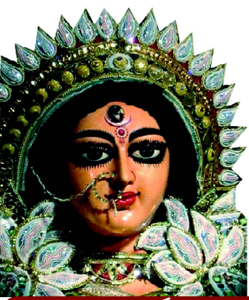
ଯା ଦେବୀ ସର୍ବଭୂତେଷୁ...

website : www.dhwanipratidhwani.net email: pratidhwani.dhwani@gmail.com