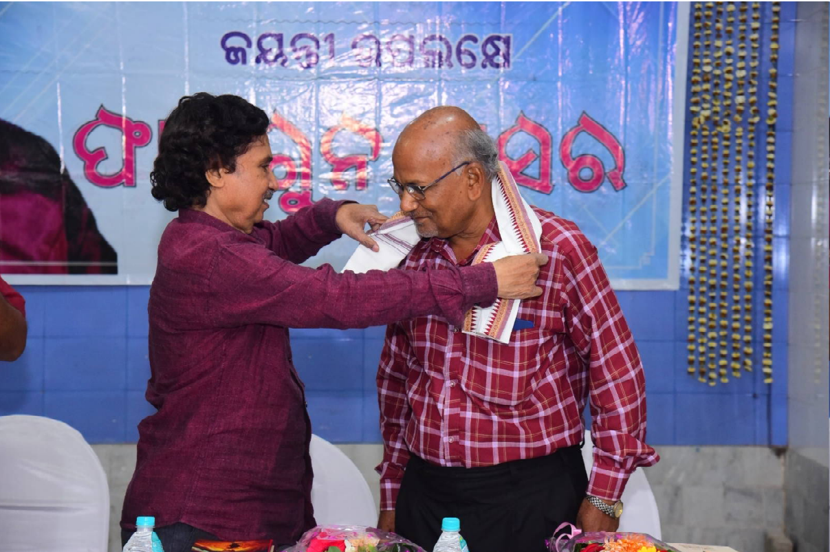
ସମର୍ପିତ ହେବାର ମଧୁର ମୁହୂର୍ତ୍ତ...

■ ଗୋଟିଏ ନିର୍ଦ୍ଦିଷ୍ଟ ଦୃଶ୍ୟ ଘଟଣା ହୃଦୟରେ ଯେଉଁ ଉଦ୍‌ବେଳନ ପୃଷ୍ଠି କରିଥାଏ ତାହାର ପ୍ରତିଫଳନ ହିଁ ସର୍ଜନା । ତାହା କବିତା, ଗଳ୍ପ, ଉପନ୍ୟାସ ଓ ନାଟକ ହୋଇପାରେ । ଯୁଗେ ଯୁଗେ ସର୍ଜକ ମାତ୍ରକେ ସମ୍ବେଦନଶୀଳ । ଏହାବିନା ସର୍ଜନା ପରିପୁଷ୍ଟ ହୋଇ ନପାରେ । ଅନ୍ୟ ବିଭାଗ ଠାରୁ କବିତା ସ୍ଵତନ୍ତ୍ର । ଏହା ମଣିଷର ହୃଦୟକୁ ସିଧାସଳଖ ସ୍ପର୍ଶ କରିଥାଏ । ଶ୍ରେଣୀ ଓ ପାଠକକୁ ଆନମନା କରିବିଏ । ୧୯୭୨-୭୪ ମସିହାରେ କେନ୍ଦ୍ରରେ ବିଜ୍ଞାନ କଲେଜରେ ଅଧ୍ୟୟନ କରୁଥିବା ସମୟରେ ଗୋଟିଏ ନିର୍ଦ୍ଦିଷ୍ଟ ଘଟଣାରୁ ମୋ କବିତାର ଜନ୍ମ । ପ୍ରକୃତରେ କେନ୍ଦ୍ରରେ ପାଣି ପବନ ମୋ ଅବଚେତନରେ ଯେଉଁ ରେଖାପାତ କରିଥିଲା, ପରବର୍ତ୍ତୀ ସମୟରେ ତାହା କବିତାର ରୂପ ନେଲା । କହିବା ବାହୁଲ୍ୟ କ୍ରୋଧ ଏବଂ କାରୁଣ୍ୟରୁ