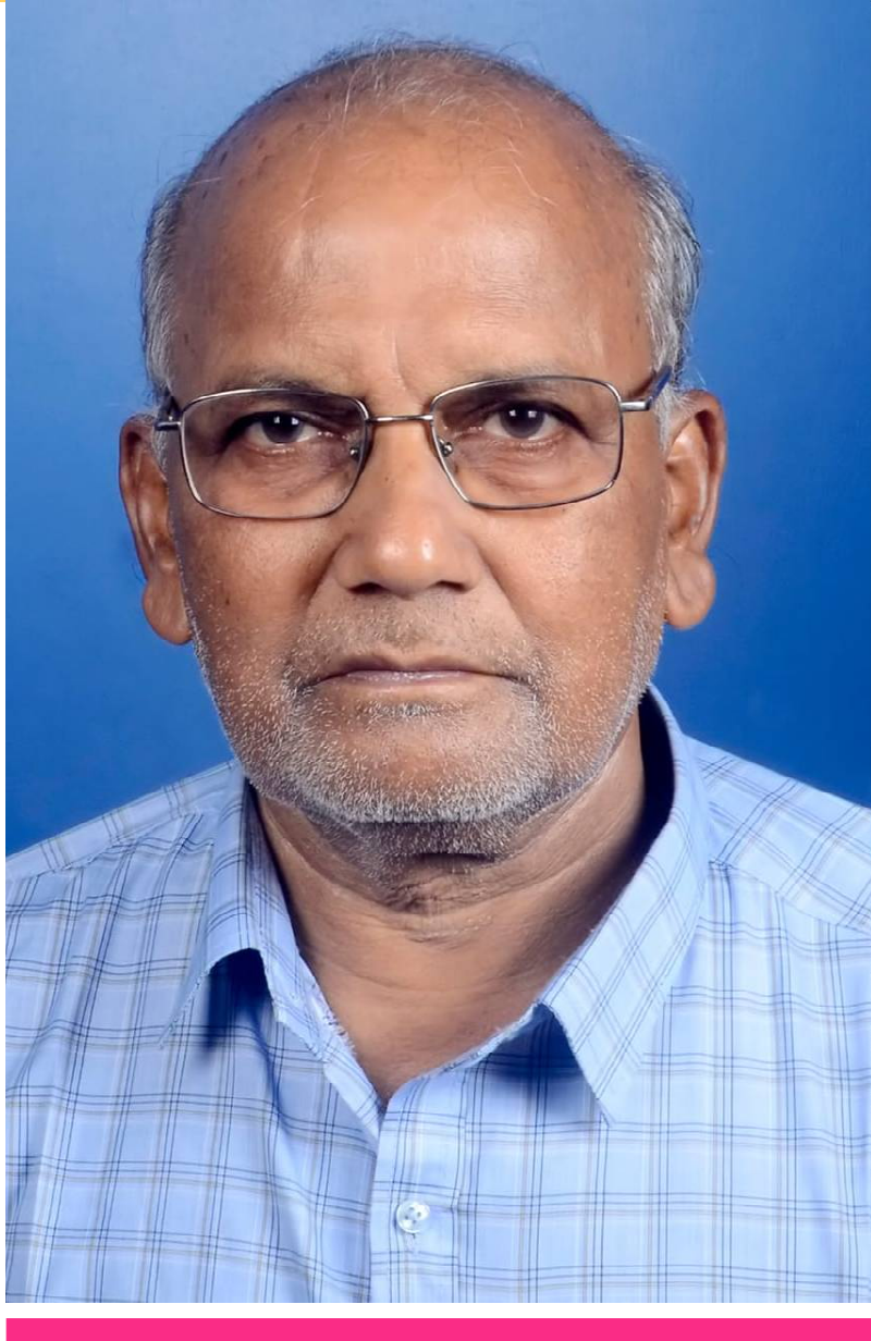
ଭାରତୀୟ କବିତାର ଉତ୍ସାହି ।