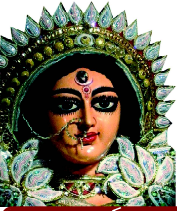
ଯା ଦେବୀ ସର୍ବଭୂତେଷୁ...

website : www.dhwanipratidhwani.net email: pratidhwani.dhwani@gmail.com