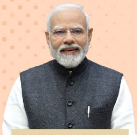
ପ୍ରଧାନମନ୍ତ୍ରୀ ନରେନ୍ଦ୍ର ମୋଦୀ ସେବା ହିଁ ସଂକଳ୍ପ ରାଷ୍ଟ୍ର ହିଁ ପ୍ରଥମ ପ୍ରେରଣା..... ୭୫ ବର୍ଷ

ବାଲେଶ୍ୱର ୩ ଶନିବାର ୨୭ ସେପ୍ଟେମ୍ବର ୨୦୨୫ ■ ପୂଜ୍ୟ ଟ. ୨.୦୦ ପଇସା ■ ପୃଷ୍ଠା ସଂଖ୍ୟା-୩୦ ■ Baleshwar ■ SATURDAY 27 September 2025 Vol.No. 36 ■ No.256 ■ Price :Rs.2.00 ( 8 pages) ■ R.N.I. Registered No. 52528/91 ■ Postal Registered No. Balasore (Odisha)/005/2019