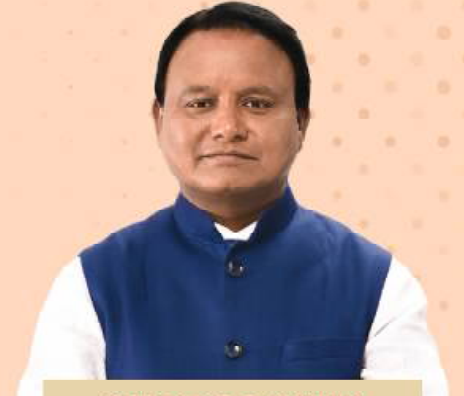
ମୋହନ ଚରଣ ମାଝୀ ମୁଖ୍ୟମନ୍ତ୍ରୀ, ଓଡ଼ିଶା