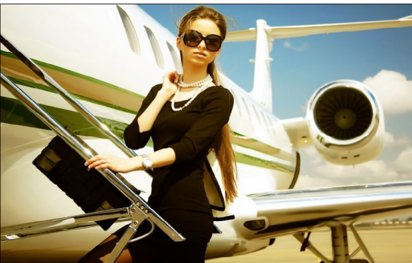
ହୋଟେଲି, ଫୁଲକୋବି, ବନ୍ଧାକୋବି ଆଦି ପରିବା ସ୍ୱାସ୍ଥ୍ୟ ପାଇଁ ଖୁବ୍ ଭଲ, କିନ୍ତୁ ବିମାନ ଯାତ୍ରା ପୂର୍ବରୁ ଏସବୁ ଖାଆନ୍ତୁ ନାହିଁ । କାରଣ ଏହି ପରିବା ସହଜରେ ହଜମ ହୋଇନଥାଏ ।

ଗତ କିଛି ବର୍ଷ ମଧ୍ୟରେ ବିମାନ ଯାତ୍ରୀଙ୍କ ସଂଖ୍ୟା ବଢ଼ିବାରେ ଲାଗିଛି । ବିମାନ ଚିକେଟ୍ ଭଡ଼ା ଯଥେଷ୍ଟ ହ୍ରାସ ପାଇବାକୁ ବିଭିନ୍ନ ବର୍ଗର ଲୋକେ ନିଜ ସମ୍ପତ୍ତୀ ଅନୁସାରେ ଯାତ୍ରା କରିପାରୁଛନ୍ତି । ତେବେ ବିମାନ ଯାତ୍ରା ସମୟରେ କୋରୋନା ବିଗ ପ୍ରତି ଧ୍ୟାନ ଦେବା ଆବଶ୍ୟକ । ସମସ୍ତ ପ୍ରକାର ଖାଦ୍ୟପାନୀୟ ଆକାଶମାର୍ଗରେ ଯାତ୍ରା ସମୟରେ ଖାଇବା ସ୍ୱାସ୍ଥ୍ୟ ନିମନ୍ତେ ହିତକର ନୁହେଁ । ଛଣାଛଣି ଖାଦ୍ୟ ବିମାନ ଯାତ୍ରା ସମୟରେ କିମ୍ବା ୩୦-୪୦ ମିନିଟ୍ ପୂର୍ବରୁ ସେବନ କରନ୍ତୁ ନାହିଁ । ଏହା କାରଣରୁ ଅମ୍ଳ ରୋଗ ହେବାର ଆଶଙ୍କା ସର୍ବାଧିକ । ବିଶେଷଜ୍ଞଙ୍କ ମତରେ ଛଣାଛଣି ଖାଦ୍ୟରେ ସୋଡିୟମ ପରିମାଣ ଅଧିକ ଥିବାରୁ ତାହା ଶରୀର ପାଇଁ କ୍ଷତିକାରକ । ମୁକୁପାନୀୟ ମଧ୍ୟ ବିମାନ ଯାତ୍ରା ପୂର୍ବରୁ ନ ପିଇବା ଉଚିତ୍ । ଏହି କାରଣରୁ ବଦଳିଯାଇଛି ।