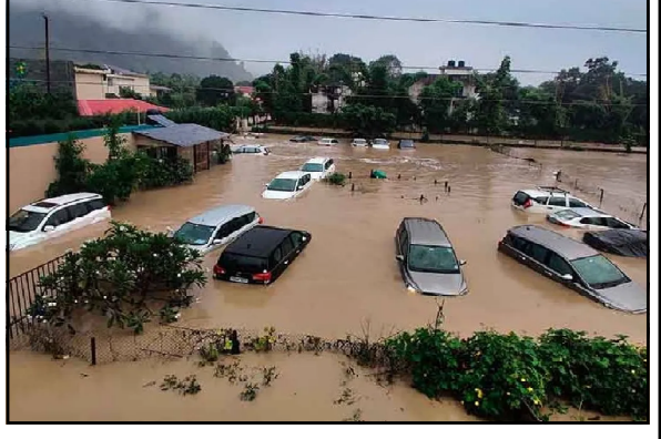
ବର୍ଷା ହୋଇଛି, ଯାହା ସ୍ୱାଭାବିକ ବର୍ଦ୍ଧମାନ ଗୋଟିଏ ବି କିଲ୍ଲୁ ଅପେକ୍ଷା ୧୩୭% ଅଧିକ । ଶୁଖିଲା ନାହିଁ । ଯେତେବେଳେ ନିରନ୍ତର ମୌସୁମୀ ସକ୍ରିୟ ଥିବାରୁ, ଗତ ଜୁଲାଇ ୧୫ ପୃଷ୍ଠା ୭

ନୂଆଦିଲ୍ଲୀ, ୦୫/୭ : ହିମାଚଳ ପ୍ରଦେଶ ଓ ଉତ୍ତରାଖଣ୍ଡ ପରେ ବର୍ଷା ମଧ୍ୟପ୍ରଦେଶ ଓ ରାଜସ୍ଥାନରେ ଦୁଃଖ ବଜାଉଛି । ମଧ୍ୟପ୍ରଦେଶର ୨୦ଟି ସହରରେ ପ୍ରବଳ ବର୍ଷା ହୋଇଛି । ମଣ୍ଡଳା, ସେଓନି ଏବଂ ବାଲାରାଜ ଲିଲ୍ଲୁଗୁଡ଼ିକୁ ରେଡ୍ ଆଲର୍ଟ ଜାରି କରାଯାଇଛି । ଜବଲପୁରରେ ଗ୍ୟାସ୍ ସିଲିଣ୍ଡର ବୋହେଇ ଏକ ଟ୍ରକ୍ ପାଣିରେ ବୁଡ଼ି ଯାଇଛି । ମଣ୍ଡଳାରେ ବନ୍ୟା ପରିସ୍ଥିତି ଦୃଷ୍ଟି ହୋଇଛି । ଭୁବ୍ ୧ ତାରିଖରୁ ରାଜସ୍ଥାନରେ ୧୭୭.୧ ମିମି