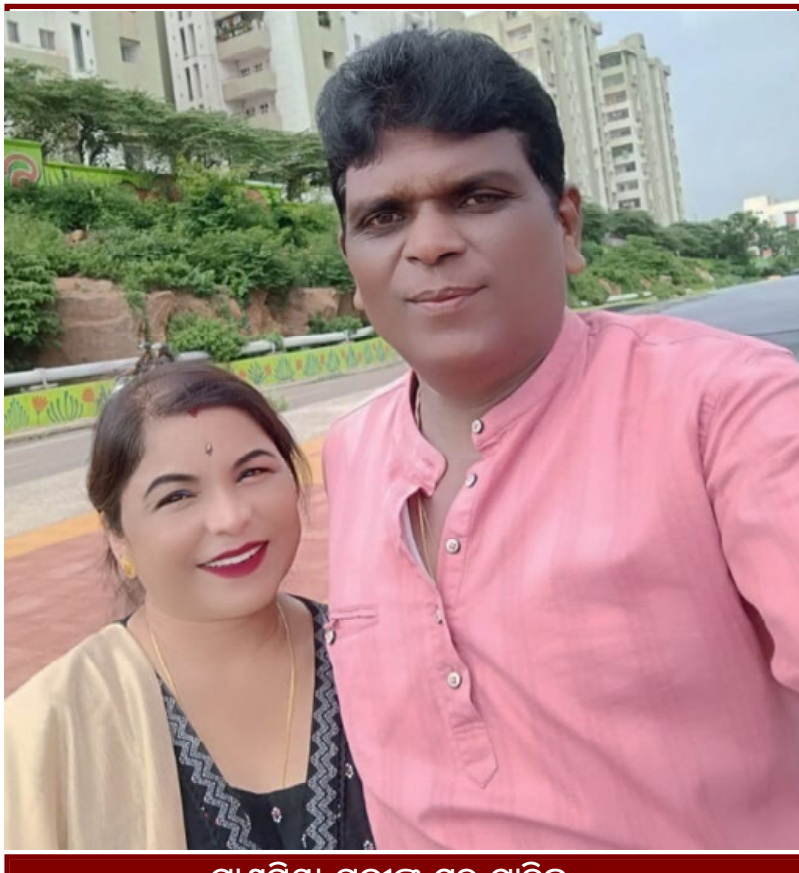
ପ୍ରାଣପ୍ରିୟା ପଢ଼ାକ ସହ ଗାଳ୍ପିକ...

ପ୍ରତିଷ୍ଠିତ ଲେଖକ ହୋଇଯାଇଛନ୍ତି । ସେମାନେ ଯାହା ଲେଖିଲେ ବି କିଛି ତଥାକଥିବ ପ୍ରତିଷ୍ଠିତ ପ୍ରକାଶକ ସେମାନଙ୍କଠାରୁ ଚଳା ନେଇ ସୁଦୃଶ୍ୟ ଆକାରରେ ସେମାନଙ୍କ ବହି ଅତି କମ୍ ସଂଖ୍ୟାରେ ଛାପି ଦେଇ, ସବୁ ଉତ୍ପାଦନ କରାଇ, ଖବରକାଗଜରେ ଛପାଇ ଦେଇ ସେମାନଙ୍କୁ ରାତାରାତି ପ୍ରତିଷ୍ଠିତ କରାଇ ଦେଉଛନ୍ତି । ସେମାନେ ଆଉ ବରିଷ୍ଠମାନଙ୍କର କାଳକ୍ରମୀ ସାହିତ୍ୟ ପଢ଼ିବାକୁ ଆଗ୍ରହୀ ନୁହଁନ୍ତି । ଲେଖକ ପ୍ରଥମେ ପାଠକଟିଏ ହେଉ । ନିଜ ଲେଖାରେ ଅଯଥା ନିଜର ପାଣ୍ଡିତ୍ୟ ପ୍ରଦର୍ଶନ ନକରି, ଆଧୁନିକତା ନାମରେ ବୌଦ୍ଧିକ ବାହାଷୋକ ନମାରି, ସାଧାରଣ ପାଠକର ବୋଧଗମ୍ୟ ହେବାପରି, ମଣିଷର ସୁଖଦୁଃଖ, କାବନ-ଯତ୍ନଶୀଳ କଥା ଲେଖିଲେ ବର୍ତ୍ତମାନର ମଣିଷ ଇଣ୍ଡରନେଟ ମାୟାରୁ ମୁକୁଳି ପୁଣି ବହି ଜଗତକୁ ଫେରିବ ବୋଲି ମୋର ପୂର୍ଣ୍ଣ ବିଶ୍ଵାସ । ■ କୁହାଯାଉଛି ମାତୃଭାଷା ଏବେ ସଂକଟରେ । ଏଥିରୁ ମୂଳି ପାଇବାର ମାର୍ଗ ସାହିତ୍ୟକୁ ଆଧାର କରି କରାଯାଇ ପାରିବ କି ? ■ ଅନେକ ବର୍ଷ ଧରି ଏପରି ଅଭିଯୋଗ ହୋଇ ଆସୁଛି ଏବଂ ଏ ଅଭିଯୋଗର ସତ୍ୟତା ଅଛି । ଏଥିପାଇଁ ଆମେ ଏବଂ ଆମ ସରକାର ବାଧ୍ୟ । କାହାର ବି ତିଳେମାତ୍ର ଆଚ୍ଛନ୍ଦିତ ନାହିଁ ମାତୃଭାଷାକୁ ଶ୍ରଦ୍ଧା କରିବା ପାଇଁ । ମାତୃଭାଷାକୁ ସଂକଟରୁ ଉଦ୍ଧାର କରିବାର ଦାୟିତ୍ଵ ଉଭୟ ସରକାର ଏବଂ ଜନସାଧାରଣଙ୍କର । ଏ ସଂକଟର ନିରାକରଣ ସେତିକିବେଳେ ସମ୍ଭବ ହେବ, ଯେବେ ଆମେ ମୋବାଇଲ ଉଠାଇବା ମାତ୍ରେ ‘ହ୍ୟାଲୋ’ ନକହି ‘ଜୟ ଜଗନ୍ନାଥ’ କିମ୍ବା ‘ନମସ୍କାର’ ବୋଲି କହିବା । ଯେବେ ଆମେ ‘ଗୁଡ଼ ମର୍ଷ’ ନକହି ‘ପୁପ୍ରଭାତ’ ବୋଲି କହିବା କିମ୍ବା ଲେଖିବା । ଯେବେ ଆମେ ‘ସରି’