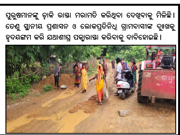
ପୁରୁଷମାନଙ୍କୁ ହାକି ରାଷ୍ଟ୍ରା ମରାମତି କରିଥିବା ଦେଖିବାକୁ ମିଳିଛି। ତେଣୁ ସ୍ଥାନୀୟ ପ୍ରଶାସନ ଓ ଲୋକପ୍ରତିନିଧି ଗ୍ରାମବାସୀଙ୍କ ଦୁଃଖକୁ ହ୍ରାସକରିବା ପାଇଁ ଯଥାସମ୍ଭବ ପଦକ୍ଷେପ ଗ୍ରହଣ କରିବାକୁ ଦାବି ହୋଇଛି।

ପିଲାମାନେ ଜୋତାପିନ୍ଧି ଖୁଲ ଯାଇପାରନ୍ତି ନାହିଁ। ରାଷ୍ଟ୍ରାକାହୁଁ ହୋଇଗଲେ ସାଇକେଲ ଚଳେ ଯିବା ଆସିବା କରିବା ପାଇଁ। ଏପରିକି କାହୁଁ ଅରାଷ୍ଟ୍ରାରେ ପାଣିଗରା ନେଇ ଯାତାୟତ କରୁଥିବାବେଳେ ଗୋଡ଼ ଖସି ଥରେକଦା ମହିଳାମାନେ