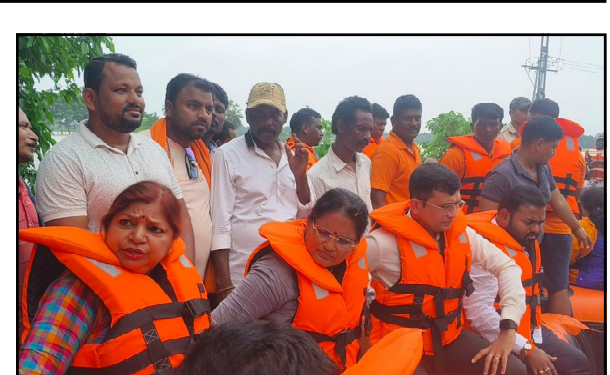
ବନ୍ୟା ପିଡ଼ାତ ଲୋକମାନଙ୍କୁ ଭେଟିଥିଲେ । ଲୋକ ମାନଙ୍କ ଅଭିଯୋଗ ଶୁଣିବା ପରେ ପନି ପରିବା ଚାଷ ସହିତ ସମସ୍ତ ଚାଷର କ୍ଷତି ପୂରଣ ଏବଂ ପାଣି ନିଷ୍ପାସନର ସ୍ତ୍ରୀମାନଙ୍କୁ ଗୁରୁତ୍ୱ ଦେବ ବୋଲି କହିଥିଲେ । ବାକି ଯାହା ଯାହା ଆବଶ୍ୟକ ସେ ଦିଗରେ ସମାକ୍ଷା ବୈଠକରେ ସିଧାସଳ କରାଯାଇ ପଦକ୍ଷେପ ନେବୁ ବୋଲି ଉପମୁଖ୍ୟମନ୍ତ୍ରୀ ପ୍ରଭାତୀ ପରିଡ଼ା ପ୍ରକାଶ କରିଛନ୍ତି । ଉପମୁଖ୍ୟମନ୍ତ୍ରୀ ଶ୍ରୀମତୀ ପରିଡ଼ା ଆଜି

ବାଲିଆପାଳ, ୦୩/୭ (ନି.ପ୍ର): ସୁଦର୍ଶନେଶା ନଦୀରେ ୧୦ ଦିନ ଭିତରେ ଦୁଇ ଥର ବନ୍ୟା ଆସିଛି । ପ୍ରଥମ ବନ୍ୟା ପାଶା ନ ଛାଡ଼ୁଣୁ ଦ୍ୱିତୀୟ ବନ୍ୟା ଆସିଲା । ବନ୍ୟାରେ ବାଲିଆପାଳ ବ୍ଲକ୍‌ର ୫୦ରୁ ଉର୍ଦ୍ଧ୍ୱ ଗ୍ରାମରେ ବନ୍ୟା ପାଣି ପଶି ନାହିଁ ନଥିବା କ୍ଷତି ସହଜରେ ବନ୍ୟା ପ୍ରଭାବିତ ଲୋକ ମାନଙ୍କୁ ଆବଶ୍ୟକ ସୁଲଭ ରକ୍ଷା ଖାଦ୍ୟ ଦିଆଯାଇଛି । ବିଶେଷ କରି ପନିପରିବା ଚାଷ ବେଶୀ କ୍ଷତି ହୋଇଛି । ଆଜି ମଧ୍ୟାହ୍ନରେ ଉପ ମୁଖ୍ୟମନ୍ତ୍ରୀ ପ୍ରଭାତୀ ପରିଡ଼ା ବାଲିଆପାଳ ବ୍ଲକ୍‌ର ବନ୍ୟା ଅଞ୍ଚଳ ପାଖରେ ବୋଟରେ ଯାଇ ମଧୁପୁରା ପଞ୍ଚାୟତର ଚୌଧୁରିକୁ ପ୍ରାମ୍ଭର