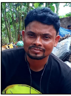
ଦୁଃଖର ବିଷୟ ସରକାର ହାଣ୍ଡିଆକୁ ନିଶାନ୍ତ୍ରବ୍ୟ ତାଲିକାରୁ ବାଦ ଦେଇଛନ୍ତି । କେତେକ ଆଦିବାସୀ ନେତା ମଧ୍ୟ ହାଣ୍ଡିଆ ଆଦିବାସୀ ମାନଙ୍କର ଖାଦ୍ୟ, ନିଶାନ୍ତ୍ରବ୍ୟ ନୁହେଁ ବୋଲି ଭାଷଣବାଦି ମାନେ ଆମ ଭାଇ ଭଉଣୀ ମାନଙ୍କୁ ହାଣ୍ଡିଆ ସେବନ ପାଇଁ ଉତ୍ସାହିତ କରୁଛନ୍ତି