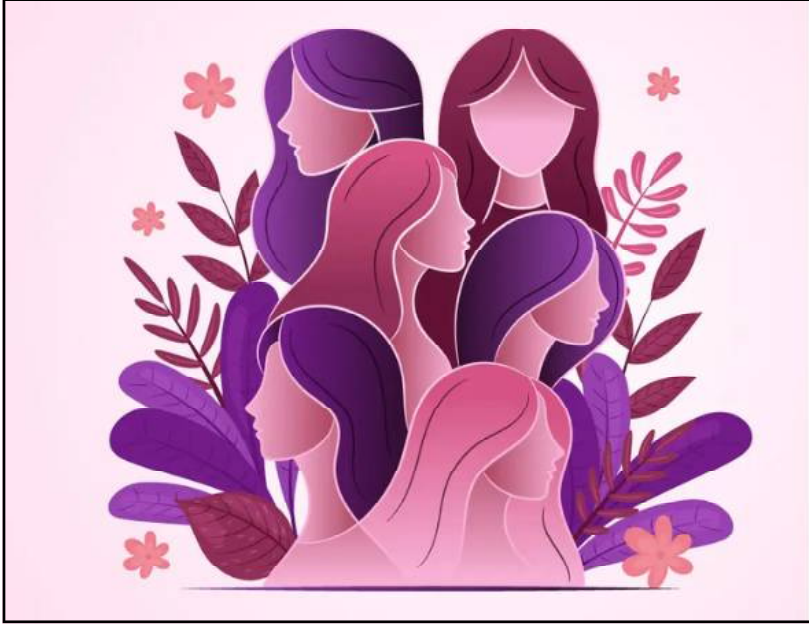
ନାରୀ ଦ୍ଵାରା ହିଁ ସମାଜର ଉନ୍ନତି : ‘ମା’ ମମତାମୟୀ, ଜଗତ ଜନନୀ ମା’ ସବୁ ତୁମ୍ଭ କରୁଣା। ତବ ଉଚ୍ଛା ବଳେ, ଏ ଭବ ସଂସାର

ହୋଇପାରେ ମା’ ଭରଣା ॥ ତୋ ଦିବ୍ୟ ନେତ୍ରକୁ, ଅରେ ଖୋଲି ଦେଲେ ହସି ଉଠିବ ଜଗତ। ତୋ ବାହୁ ବଳରେ, ସତ୍ୟତା ମଧ୍ୟରେ ଭବ ହେବ ପୁଲ୍କିତ ॥ “ନାରୀ ସୃଷ୍ଟି କରିପାରେ, ଧ୍ୟାନ ବି କରିପାରେ। ଗତିପାତ୍ର, ଭାଙ୍ଗି ଦି ପାରେ।” ଉଚ୍ଚକୁ ଚେକିପାରେ ତଳକୁ ମଧ୍ୟ ଠେଲିଦେଇ ପାରେ। ଆନନ୍ଦର ଦୃଢ଼ ଖେଳାଇପାରେ, ବିଷାଦର ଛାୟା ମଧ୍ୟ ବିଷାଦ କରିପାରେ।” ନାରୀ ହେଉଛି ଉଦାରମୟୀ, ଭାବମୟୀ, ଉଚ୍ଛାମୟୀ, ପ୍ରେମମୟୀ କଲ୍ୟାଣକାରୀ। ନାରୀର ଉଚ୍ଛାରେ ସୃଷ୍ଟି ହେଲା ଏ ସଂସାର ଏବଂ ତାର ଉଚ୍ଛାରେ ମଧ୍ୟ ସମଗ୍ର ଧରା ପୁଲ୍କିତ ହୋଇଉଠିଲା। ସେ ଯଦି ଉଚ୍ଛାକୁ ମୁହୂର୍ତ୍ତକ ମଧ୍ୟରେ ଏ ସମାଜକୁ ଧ୍ୟାନ କରିଦେଇ ପାରିବ। ତାର ସତୀତ୍ଵ ବଳରେ ସମାଜକୁ ଧ୍ୟାନ କରି ନିଜେ ମଧ୍ୟ ଆତ୍ମୋପାସନ କରିପାରେ। ତାହାଦ୍ଵାରା ଅସମ୍ଭବ ସମ୍ଭବ ହୋଇପାରେ। ନାରୀ ଦ୍ଵାରା ସମାଜରେ ସତ୍ୟ, ଶକ୍ତି, ପ୍ରେମ, ଉଦାରତା ଜାଗ୍ରତ ହୋଇପାରିବ। ପ୍ରତ୍ୟେକ ନାରୀକୁଳ ଏ ମାନବ ସଭ୍ୟତାରେ ରହି ଯଦି