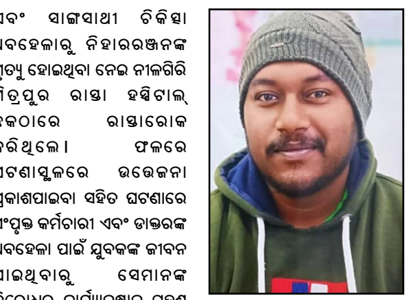
ଏବେ ନାଳଗିରି ଥାନାରେ ୨/୨୦୨୪ରେ ଏକ ଅପମୃତ୍ୟୁ ମାମଲା ରୁକୁ ହୋଇ ଶବ୍ଦବ୍ୟବହାର କରାଯାଇ ପରିବାର ବର୍ତ୍ତମାନ ହସ୍ତିଚାଳରେ ରହିଛନ୍ତି ।