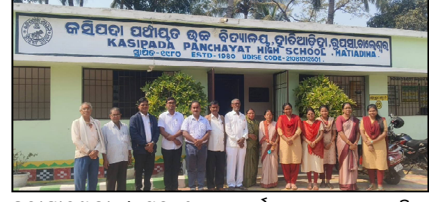
କରାଯାଇଥିଲା । ଗତ ୧୦ ତାରିଖରେ ଏକକାଳୀନ ୫ଜଣ ଶିକ୍ଷୟିତ୍ରୀ ଶିକ୍ଷକ ଓ ଗୁରୁବାର ଜଣେ କୁଡ଼ା ଶିକ୍ଷୟିତ୍ରୀ ନବନିଯୁକ୍ତ ହେବା ପରେ ଛାତ୍ରଛାତ୍ରୀ, ଅଭିଭାବକ ଓ ଅଞ୍ଚଳବାସୀଙ୍କ ମଞ୍ଚଳରେ ଖୁସିର ବାତାବରଣ ଖେଳି ଯାଇଛି । ନବନିଯୁକ୍ତ ଶିକ୍ଷକଶିକ୍ଷୟିତ୍ରୀଙ୍କୁ କୃତଜ୍ଞତା ଜ୍ଞାପନ କରାଯାଇଛି ।