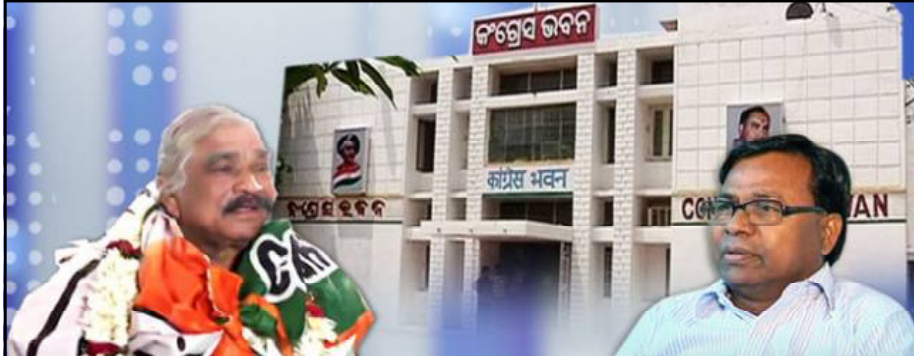
ପରୋକ୍ଷରେ ଘରବା ଦିବେଲେଣି । ତେବେ ପୁରୁଖାଙ୍କୁ ଫେରାଇ ଆଣି ଓ ଯଜ୍ଞ ତ୍ରିଗେଡ଼କୁ ସାଥରେ ନେଇ