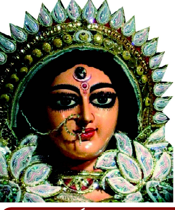
ଯା ଦେବୀ ସର୍ବଭୃତ୍ୟେ.....

ବାଲେଶ୍ୱର ■ ମଙ୍ଗଳବାର ୦୪ ଫେବୃଆରୀ ୨୦୨୫ ■ ମୂଲ୍ୟ ଟ. ୨.୦୦ ପଇସା ■ ପୃଷ୍ଠା ସଂଖ୍ୟା-୩୦ ■ Baleshwar ■ TUESDAY 04 FEBRUARY 2025 Vol.No. 36 ■ No.33 ■ Price :Rs.2.00 ( 8 pages) ■ R.N.I. Registered No. 52528/91 ■ Postal Registered No. Balasore (Odisha)/005/2019