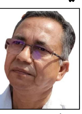
ନେତାଙ୍କ ଅପରିଶୋଧ ଦର୍ଶିତା ଓ ମନମାନି ଫଳରେ କୋଟିକୋଟି

ନାଳଗିରି, ୨/୨ (ନି.ପ୍ର): ଆଦିବାସୀ ଅଧିକାର ନାଳଗିରି ବ୍ଲକର ଉନ୍ନୟନ ପାଇଁ ସ୍ଵତନ୍ତ୍ର ଭାବେ ସମ୍ବନ୍ଧିତ ଆଦିବାସୀ ଉନ୍ନୟନ ସଂସ୍ଥା ୧୯୮୪ ମସିହାରେ ଗଠନହୋଇ ସରକାରଙ୍କ ବିଭିନ୍ନ ଉନ୍ନୟନ କାର୍ଯ୍ୟ ହେଉଛି । ମାତ୍ର ବର୍ତ୍ତମାନ ଉଚ୍ଚ ବିଭାଗରେ କୌଣସି ଉନ୍ନୟନ କାର୍ଯ୍ୟ ସମ୍ପୂର୍ଣ୍ଣ ୦୯ ହୋଇଯାଇଛି । ବର୍ତ୍ତମାନର ରାଜ୍ୟ ସରକାର ଏବଂ ସ୍ଥାନୀୟ