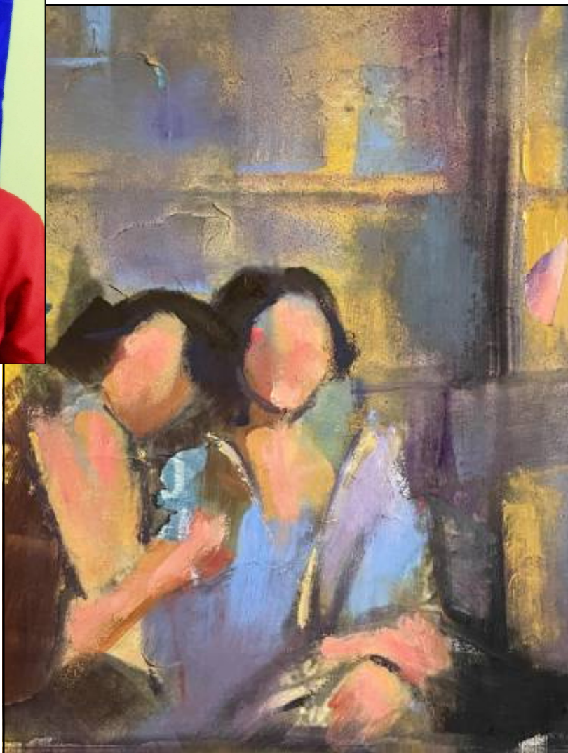
ପାଇଁ କହିଲୁ ବୋଉ ? ତୋତେ ଠିକ୍ରେ ଦିଶୁନି । ପାଞ୍ଚ ଦିନରୁ ପରସା ଦେଲିଣି ତଷମା କିଣିବା ପାଇଁ । ତୁ କିଣି ନାହିଁ କାହିଁକି କହ ? ତେଣୁ ତ ଝୁଙ୍କି ପଡୁଛୁ ?