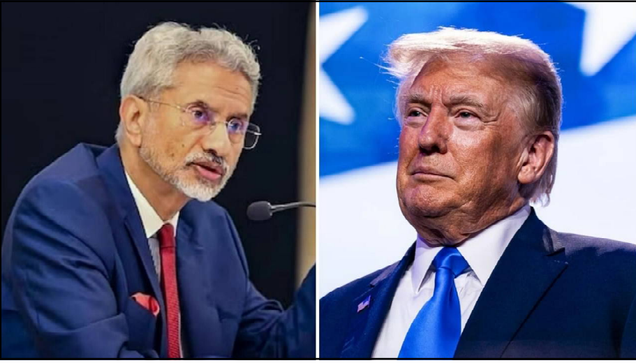
ଯୋଗ ଦେଉଥିବା ନୂତନ ଆମେରିକା ପ୍ରଶାସନର ପ୍ରତିନିଧୀ ତଥା ଅନ୍ୟ ଆଡ଼ର୍ଜାତୀୟ ମାନ୍ୟଗଣ୍ୟ ବ୍ୟକ୍ତିଙ୍କ ସହ ମଧ୍ୟ ଆଲୋଚନା କରିବେ । ଏହି ଶପଥ ସମାରୋହରେ ଜୟଶଙ୍କର ସାମିଲ ହେବା ଓ ତାଙ୍କର ଏହି ଗସ୍ତ ଭାରତ ଏବଂ ଆମେରିକା ମଧ୍ୟରେ କୂଟନୈତିକ ସମ୍ପର୍କକୁ ଆହୁରି ଦୃଢ଼ କରିବ ବୋଲି ଆଶା କରାଯାଉଛି । ଶପଥ ଗ୍ରହଣ ଉତ୍ସବ ଜାନୁଆରୀ ୨୦ରେ ମାର୍ଟିନ୍ ଲୁଥର କିଙ୍ଗ

ନୂଆଦିଲ୍ଲୀ, ୧୨/୧ : ଆସନ୍ତା ଜାନୁଆରୀ ୨୦ ତାରିଖରେ ଆମେରିକାର ୪୭ତମ ରାଷ୍ଟ୍ରପତି ଭାବେ ଶପଥ ନେବେ ତୋନାଲ୍ଡ ଟ୍ରମ୍ପ । ସେ ଦ୍ୱିତୀୟ ଥର ପାଇଁ ଆମେରିକାର ରାଷ୍ଟ୍ରପତି ପଦ ଗ୍ରହଣ କରିବେ । ତେବେ ଟ୍ରମ୍ପଙ୍କ ଏହି ଶପଥ ସମାରୋହରେ ଭାରତ ପକ୍ଷରୁ ବୈଦେଶିକ ବ୍ୟାପାର ମନ୍ତ୍ରୀ ଏସ୍. ଜୟଶଙ୍କର ଅଂଶଗ୍ରହଣ କରିବେ । ଏନେଇ ବୈଦେଶିକ ମନ୍ତ୍ରଣାଳୟ ପକ୍ଷରୁ ସୂଚନା ମିଳିଛି । ଟ୍ରମ୍ପ-ଭାରତ୍ତ୍ୱ ଉଦ୍‌ଘାଟନା କମିଟିର ନିମନ୍ତ୍ରଣ ଅନୁସାରେ ଏସ୍.ଜୟଶଙ୍କର ଭାରତର ପ୍ରତିନିଧିତ୍ୱ କରିବେ । ତାଙ୍କ ଗସ୍ତ ସମୟରେ ବୈଦେଶିକ ବ୍ୟାପାର ମନ୍ତ୍ରୀ ଶପଥ ଗ୍ରହଣ ସମାରୋହରେ