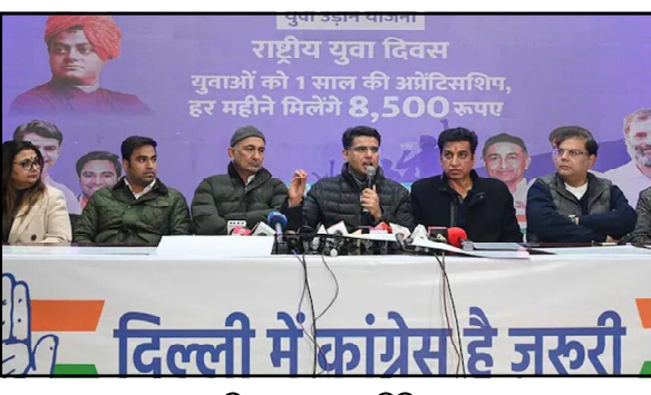
୫ ଫେବୃଆରୀରେ ଗୋଟିଏ ନୂଆ ସରକାର ଗଠନ କରିବେ । ଆମେ ଦିଲ୍ଲୀର ଲୋକମାନଙ୍କ ପାଇଁ କିଛି ପ୍ରତିଶ୍ରୁତି ଉପସ୍ଥାପନ କରିବାକୁ ଚାହୁଁଛୁ । ଆଜି ଆମ ଦଳ ନିଷ୍ପତ୍ତି ନେଇଛି ଯେ ଶିକ୍ଷିତ ଆଇ ମଧ୍ୟ

ନୂଆଦିଲ୍ଲୀ, ୧୨/୧ : ଦିଲ୍ଲୀ ବିଧାନସଭା ନିର୍ବାଚନ ପୂର୍ବରୁ କଂଗ୍ରେସ ଲୋକମାନଙ୍କ ପାଇଁ ବୃତ୍ତୀୟ ପ୍ରତିଶ୍ରୁତି ଘୋଷଣା କରିଛି । ଯଦି କଂଗ୍ରେସ ୧୫ ବର୍ଷର ବନବାସ ପରେ ଦିଲ୍ଲୀରେ ଶ୍ରମଚଳୁ ହେବେ, ତା'ହେଲେ ସମସ୍ତ ଶିକ୍ଷିତ ବେକାରଙ୍କୁ ମିଳିବ ୮,୫୦୦ ଟଙ୍କା । ବର୍ଷକ ଯାଏ ଯୁବ ଉନ୍ନତ ଯୋଜନା କରିଆରେ ସେମାନଙ୍କୁ ଏପରି ଆର୍ଥିକ ସହାୟତା ଯୋଗାଇ ଦିଆଯିବ । ଆଜି ଆୟୋଜିତ ସାମ୍ବାଦିକ ସମ୍ମିଳନୀରେ କଂଗ୍ରେସର ବରିଷ୍ଠ ନେତା ସଚିନ ପାଲକଟ୍ କହିଛନ୍ତି ଯେ ଦିଲ୍ଲୀର ଲୋକମାନେ