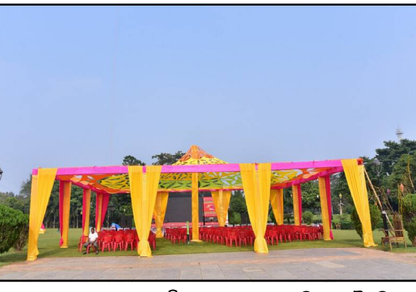
ସମାବେଶରୁ ଆରମ୍ଭ ହେବ ଏହି ମା ଦିନିଆ ସମ୍ମିଳନୀ । ଯାହାକୁ ସମୋଧିତ କରିବେ ଦୈନିକ ଓ

ଭୁବନେଶ୍ୱର, ୭/୧(ନି.ପ୍ର) : ରାତି ପାହିଲେ ପ୍ରବାସୀ ଭାରତୀୟ ଦିବସ । ପ୍ରଥମ ଥର ପାଇଁ ଓଡ଼ିଶା କରୁଛି ଆୟୋଜନ । ସେଥିପାଇଁ ଉତ୍ସବମୁଖର ରାଜଧାନୀ ଭୁବନେଶ୍ୱର । ପ୍ରବାସୀଙ୍କୁ ସ୍ୱାଗତ ପାଇଁ ପ୍ରସ୍ତୁତ କନଟା ମେଳା । ୭୦ରୁ ଅଧିକ ଦେଶରୁ ଆସିବେଳେ ମୂଳ ଭାରତୀୟ ନାଗରିକ । ରାଜ୍ୟର ୭ଟି ସ୍ଥାନ ବୁଲିବେ ପ୍ରବାସୀ । ସାକ୍ଷରତା, କଳା, ଭୁବନେଶ୍ୱର ଏବଂ ପୁରୀର ୨୧ଟି ପର୍ଯ୍ୟଟନ ସ୍ଥଳୀ ବୁଲିବେ । ଆସନ୍ତାକାଲି ସୁଦ୍ଧା