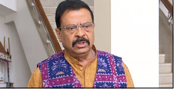
ଏହି ସହାୟତା ରାଶି ବଂଚନ କାର୍ଯ୍ୟ ଶେଷ ହେବ । ଅଭିନିଆ ବର୍ଷାରେ ଫସଲ ୧୪ଟି ଜିଲ୍ଲାରେ ଦ୍ୟାପକ ହେବ । ୨୯ଟି ଜିଲ୍ଲାରେ ଆଂଶିକ କ୍ଷତି ହୋଇଛି । ଜିଲ୍ଲାପାଳମାନେ