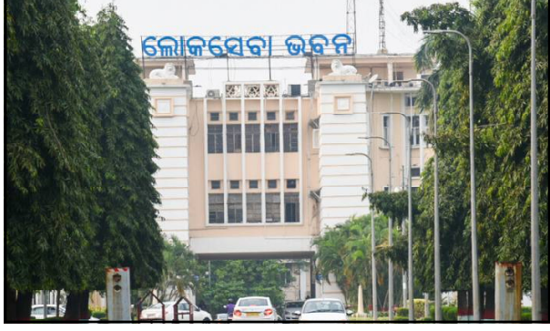
କାର୍ଯ୍ୟ ବିଜ୍ଞପ୍ତି ଅନୁସାରେ, ପୂରା ଅତିରିକ୍ତ ଜିଲ୍ଲାପାଳ ବରିଷ୍ଠ ଓଏଏସ୍ ବିଭାଗର କଳ୍ୟାଣ ବିଭାଗର ଅତିରିକ୍ତ ସଚିବ ଭାବେ ବଦଳି ହୋଇଛି ।

ଭୁବନେଶ୍ୱର, ୭/୧(ନି.ପ୍ର) : ରାଜ୍ୟ ସରକାର ଆଜି ଏକକାଳୀନ ୧୪୮ ଜଣ ବରିଷ୍ଠ ଓଏଏସ୍ ଅଫିସରଙ୍କୁ ବଦଳି କରିଛନ୍ତି । ଏଥିରେ ୬୯ଟି ବ୍ଲକ୍ରେ ନୂଆ ବିଡିଓଙ୍କୁ ଅବସ୍ଥାପିତ କରିଥିବାବେଳେ ବହୁ ଜିଲ୍ଲାର ଅତିରିକ୍ତ ଜିଲ୍ଲାପାଳଙ୍କର ମଧ୍ୟ ବଦଳି ହୋଇଛି । ଆଜି ମଙ୍ଗଳବାର ଏନେଇ ସାଧାରଣ ପ୍ରଶାସନ ବିଭାଗ, ପଂଚାୟତରାଜ ବିଭାଗ ଓ ରାଜସ୍ୱ ବିଭାଗ ପକ୍ଷରୁ ଭିନ୍ନ ଭିନ୍ନ ବିଜ୍ଞପ୍ତି ଜାରି ହୋଇଛି । ସାଧାରଣ ପ୍ରଶାସନ ବିଭାଗ ପକ୍ଷରୁ