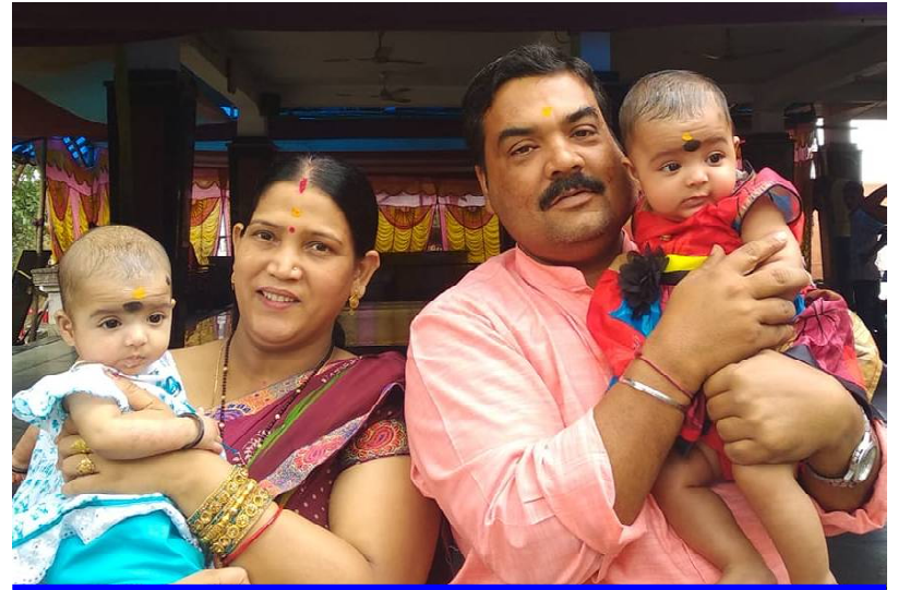
ଦୁଇ ଯମଜ ସନ୍ତାନଙ୍କ ସହ କବିଙ୍କ ପୁତ୍ର ଓ ପୁତ୍ରବଧୂ...