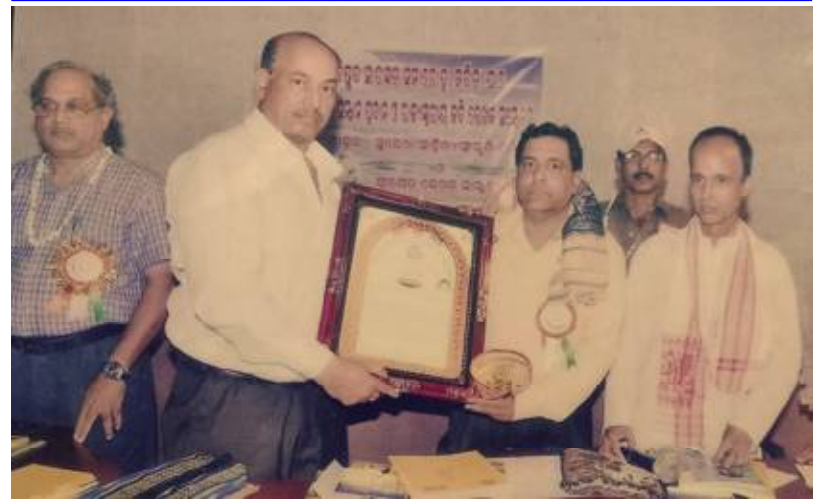
ସମ୍ପର୍କିତ ହେବାର ମହାର୍ଦ୍ଦି ମୁହୂର୍ତ୍ତ...