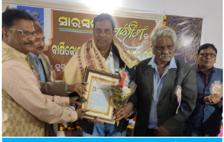
ସମ୍ପର୍କିତ ହେବାର ସ୍ମରଣୀୟ ମୁହୂର୍ତ୍ତ....

ବରଂ ଗଭୀର ଭାବେ ଆଶା କରିବି ଯେ, ଓଡ଼ିଆ ସାହିତ୍ୟ ସର୍ବଭାରତୀୟ ସ୍ତରରେ ନିଜର ସ୍ଵାତନ୍ତ୍ର୍ୟ ବଜାୟ ରଖିବା ସଙ୍ଗେସଙ୍ଗେ ସବୁଠୁ ଆଗରେ ରହିଥିବ । ସାହିତ୍ୟ ସଦାକାଳ ସାଧାରଣ ଲୋକର କଥା ହିଁ କହିଥାଏ । ପ୍ରେମଚାନ୍ଦଙ୍କ 'ଗୋଦାନ' କହୁ ଅବା ଗୋପୀନାଥଙ୍କ 'ମାଟି ମଟାଳ', ସଚ୍ଚି ରାଉତରାୟଙ୍କ 'ଛୋଟ ମୋର ଗାଆଁଟି', ରମାକାନ୍ତ ମାର୍ଗ ସାହିତ୍ୟକୁ ଆଧାର କରି କରାଯାଇ ପାରିବ କି ? ■ ମାତୃଭାଷା ଯଦି ବଞ୍ଚିରହିଛି, ତାହା ସାଧାରଣ ଲୋକଙ୍କ ଭାଷାରେ ତଥା ସାରସ୍ଵତ ସ୍ଵଷ୍ଟା ମଣିଷଙ୍କ ସାହିତ୍ୟ-ସୃଷ୍ଟିରେ କେବଳ । ଯଦି ଏହା ସଙ୍କଟରେ ରହିଛି ଅବା ଆଗକୁ ସଙ୍କଟରେ ରହିବାର ସମ୍ଭାବନା ଅଛି,