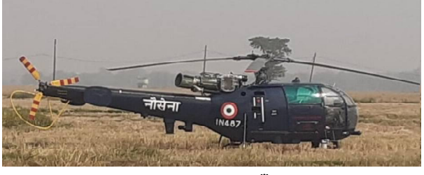
କରିବା ପରେ ଆଖପାଖ ଲୋକେ ଦେଖିବା ପାଇଁ ଭିଡ଼ ଜମାଇଥିଲେ। ତେବେ ବିମାନଟି କାର୍ଯ୍ୟକାରୀ ଅବତରଣ କଲା ତାର କାରଣ ଜଣାପଡ଼ିନାହିଁ। ହେଲିକପ୍ଟରରେ ଗଣେ ନୌସେନା ଅଧିକାରୀ ଥିବା ଜଣାଯାଇଛି। ନୌସେନା ହେଲିକପ୍ଟର ଜରୁରୀକାଳୀନ ଅବତରଣ ନେଇ ମୟୂରଭଞ୍ଜ ଏସପି କହିଛନ୍ତି, ଯାହାକି ତୁଟି ଯୋଗୁ ନୌସେନା ହେଲିକପ୍ଟରଟି ଜରୁରୀକାଳୀନ ଅବତରଣ କରିଥିଲା। ପରେ ହେଲିକପ୍ଟରଟି ପୁଣି ଉଡ଼ାଣ ଭରିଥିଲା।

ମୟୂରଭଞ୍ଜ, ୦୪/୧୨ (ନି.ପ୍ର): ହଠାତ୍ ବିଲ ମଝିରେ ଜରୁରୀ ଅବତରଣ କଲା ନୌସେନା ହେଲିକପ୍ଟର। ଯାହାକୁ ଦେଖିବାକୁ ଲୁହ ହୋଇଯାଇଥିଲେ ଗ୍ରାମବାସୀ। ଏପରି ଘଟଣା ଘଟିଛି ମୟୂରଭଞ୍ଜ ଜିଲ୍ଲା ବାରିପଦାରେ। ଆଜି ରାସଗୋବିନ୍ଦପୁର ବ୍ଲକର ଗାଁଆମେଳା ବିଲରେ ହଠାତ୍ ନୌସେନା ହେଲିକପ୍ଟରଟି ଅବତରଣ କରିଥିଲା। ପାଖାପାଖି ୧୫ରୁ ୨୦ ମିନିଟ୍ ରହିବା ପରେ ହେଲିକପ୍ଟରଟି ପୁଣି ଉଡ଼ାଣ ଭରିଥିଲା। ହେଲିକପ୍ଟରଟି ଅବତରଣ