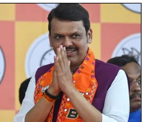
ସର୍ବକମିଟି ମେମ୍ବର ଏବଂ ୨୦୧୪ରେ ମହାରାଷ୍ଟ୍ରର ପ୍ରଥମ ବିକେପି ମୁଖ୍ୟମନ୍ତ୍ରୀ। କୁହାଯାଏ, ୨୦୨୨ ସଭାପଲକ୍ଷ ପଲକ୍ଷରେ ବି ଥିଲା ଦେବେନ୍ଦ୍ର ଫଡ଼ନାଭିସ୍ଙ୍କ ପ୍ରମୁଖ

ନୂଆଦିଲ୍ଲୀ, ୦୪/୧୨ : ସବୁ କଞ୍ଚନାକଞ୍ଚନାର ଅତ୍ତ। ସିଏମ ସସପେନ୍ସରେ ପଡ଼ିଲା ପୂର୍ଣ୍ଣଚ୍ଛେଦ। ମହାରାଷ୍ଟ୍ରର ନୂଆ ମୁଖ୍ୟମନ୍ତ୍ରୀ ହେବେ ଦେବେନ୍ଦ୍ର ଫଡ଼ନାଭିସ୍। କୋର୍ଟ କମିଟି ବୈଠକରେ ଫଡ଼ନାଭିସ୍ କ ନାଁରେ ମୋହର ବାଜିଥିବା ଜଣାପଡ଼ିଛି। ଏଣେ ନୂଆ ସରକାର ଶପଥ ନେବାକୁ ସକଳ ହୋଇଛି। ତେବେ ଆବଶ୍ୟକୀୟ ମୁଖ୍ୟମନ୍ତ୍ରୀ ଭାବେ ଶପଥ ନେବେ ଫଡ଼ନାଭିସ୍। ଶପଥ ଗ୍ରହଣ ସମାରୋହ ପାଇଁ କୋରଦ୍ୱାର ପ୍ରସ୍ତୁତି ହେଉଛି। ମହାତ୍ମାଜିର ମହା ବିକଳ ପରେ ଏବେ 'ମହା' ମୁଖ୍ୟମନ୍ତ୍ରୀ ହେବେ ବର୍ତ୍ତମାନର ଉପମୁଖ୍ୟମନ୍ତ୍ରୀ ତଥା ମହାରାଷ୍ଟ୍ରରେ ବିକେପିର ସେନାପତି ଦେବେନ୍ଦ୍ର ଫଡ଼ନାଭିସ୍। କର୍ପୋରେଟରରୁ ନାଗପୁରର