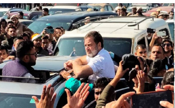
ଫଳରେ ଏଠାରେ ଏକ ହାଇଡ୍ରାମା ଘଟିଛି। ଗାନ୍ଧୀଙ୍କୁ ଧରି ସମ୍ବଲ ଯାତ୍ରାରେ ବାହାରିଥିଲେ ମଧ୍ୟ ସଫି ଯାତ୍ରା ସଫଳ ହୋଇପାରିନାହିଁ। ରାହୁଲ ଓ ପ୍ରିୟଙ୍କାଙ୍କୁ ଦିଲ୍ଲୀ ଏବଂ ନୋଏଡା ମଧ୍ୟରେ ଥିବା ଗାଜପୁର ସୀମାରେ ଅଟକାଇ ଦିଆଯାଇଛି।

ନୂଆଦିଲ୍ଲୀ, ୦୪/୧୨ : ଉତ୍ତରପ୍ରଦେଶର ସମ୍ବଲରେ ଘଟିଥିବା ହିଂସାକୁ ନେଇ ରାଜନୀତି ଅମିତାଭ ନାଁ ଧରୁଛି। ଆଜି (ବୁଧବାର) କଂଗ୍ରେସ ସାଂସଦ ତଥା ଲୋକସଭାର ବିରୋଧୀ ଦଳ ନେତା ରାହୁଲ ଗାନ୍ଧୀ ଉତ୍ତରୀ ପ୍ରିୟଙ୍କା ଗାନ୍ଧୀଙ୍କୁ ଧରି ସମ୍ବଲ ଯାତ୍ରାରେ ବାହାରିଥିଲେ ମଧ୍ୟ ସଫି ଯାତ୍ରା ସଫଳ ହୋଇପାରିନାହିଁ। ରାହୁଲ ଓ ପ୍ରିୟଙ୍କାଙ୍କୁ ଦିଲ୍ଲୀ ଏବଂ ନୋଏଡା ମଧ୍ୟରେ ଥିବା ଗାଜପୁର ସୀମାରେ ଅଟକାଇ ଦିଆଯାଇଛି।