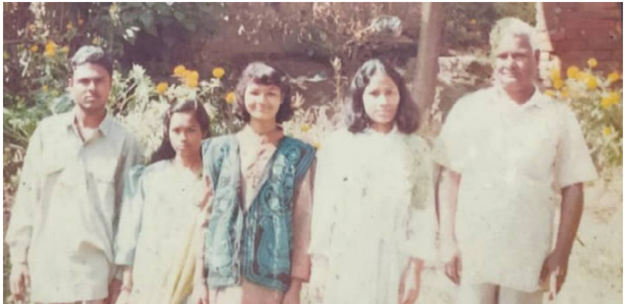
ଭାଇ, ଭଉଣୀ ଓ ବାପାଙ୍କ ସହ ବୀଣାପାଣି...ପୁରଣୀୟ ମୁହୂର୍ତ୍ତର ସ୍ମୃତିଚିତ୍ର...