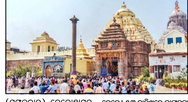
(ମଙ୍ଗଳବାର) ଦେବୋତ୍ସାହ ପର୍ବ ଏକାଦଶୀରେ ତତୁର୍ଣ୍ଣାମୂର୍ତ୍ତି ବେଶ, ୧୪ ତାରିଖରେ ତାଳିଆ ଲକ୍ଷ୍ମୀନାରାୟଣ ବେଶରେ ଦର୍ଶନ

ପୁରୀ, ୧୧/୧୧ (ନି.ପ୍ର): ରାତି ପାହିଲେ ଧାର୍ମିକ ମାସ କାର୍ତ୍ତିକର ମହାପଞ୍ଚୁକ ବ୍ରତ ଆରମ୍ଭ ହେବ । ଚଳିତ ବର୍ଷ ପଞ୍ଚୁକ ପଞ୍ଚମୀ ପରିବର୍ତ୍ତେ ଚାରିଦିନ ପଡ଼ୁଥିବାରୁ ଏହି ସମୟରେ ଶ୍ରୀମନ୍ଦିରରେ ଲକ୍ଷ ଲକ୍ଷ ଭକ୍ତ ଭିଡ଼ ଲାଗିବ । ଏହାକୁ ଦୃଷ୍ଟିରେ ରଖି ପୁରୀ ପୁଲିସ୍ ପକ୍ଷରୁ ଶୁଙ୍ଖାଳିତ ଦର୍ଶନ, ଭକ୍ତଙ୍କ ସୁରକ୍ଷା ଏବଂ ଗ୍ରାମ୍ୟ ପରିଚାଳନା ପାଇଁ ସ୍ୱତନ୍ତ୍ର ପଦକ୍ଷେପ ନିଆଯାଇଛି ବୋଲି କହିଛନ୍ତି ପୁରୀ ଏସପି ଆସକାଳି