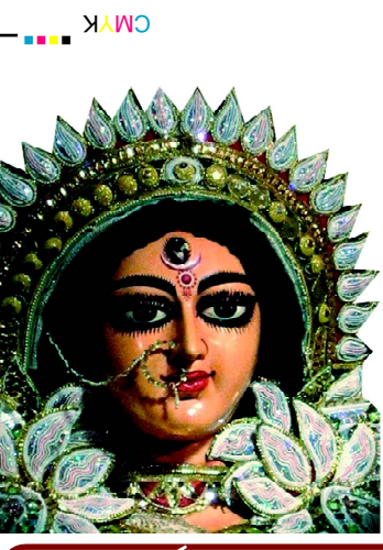
ଯା ଦେବୀ ସର୍ବଭୃତ୍ୟେ.....

website : www.dhwanipratidhwani.net email: pratidhwani.dhwani@gmail.com