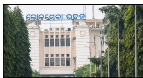
ମହଙ୍ଗା ପଡ଼ିବ । ମୁଖ୍ୟ ସଚିବ ଆଜି ସମସ୍ତ ବିଭାଗୀୟ ସଚିବ ଓ ଜିଲ୍ଲାପାଳମାନଙ୍କୁ ଚିଠି ଲେଖି

ଭୁବନେଶ୍ୱର, ୧୧/୧୧ (ନି.ପ୍ର): ଏଣିକି ଆଉ ଚଳିବନି ବଦଳି ଏବଂ ଯୋଷ୍ଟି ପାଇଁ ଚାପ ପକାଇଥିବା କର୍ମଚାରୀଙ୍କ ହାକିମାତି । ପ୍ରାୟତଃ ପାଇଁ ଚାପ ପକାଇଲେ ହେବ କଡ଼ା ଆକ୍ରମ । ଏନେଇ ସବୁ ବିଭାଗର ସଚିବମାନଙ୍କୁ ଚିଠି ଲେଖି ଜଣାଇଛନ୍ତି ମୁଖ୍ୟ ସଚିବ ମନୋଜ ଆହୁଜା । ନେତା-ମନ୍ତ୍ରୀଙ୍କ ଲିଖିତ ପ୍ରତ୍ୟାଶା ଆଣି ନିଜର ବଦଳି ଓ ପଦୋନ୍ନତି ପାଇଁ ଚାପ ପକାଇବା ଏଣିକି ସରକାରୀ କର୍ମଚାରୀଙ୍କୁ