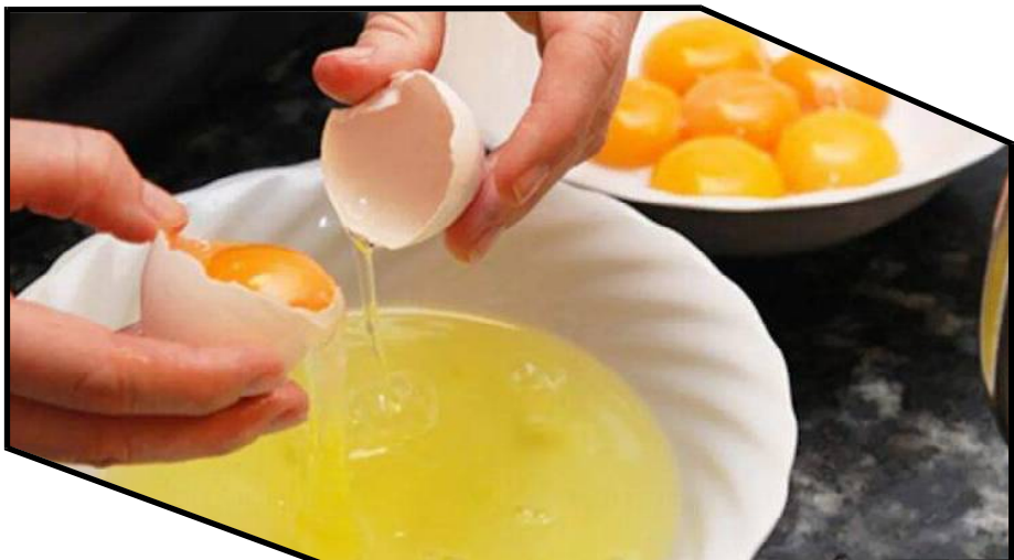
ତେବେ ଏପରି ଅନେକ ଜିନିଷ ଅଛି ଯାହା ସହ ଅଣ୍ଡା ଖାଇବା ଅନୁଚିତ । ସେଥିମଧ୍ୟରେ ରହିଛି ତା' ଏବଂ କ୍ଷୀର । ଏହି ସବୁ ପାନମୟ ସହ ଅଣ୍ଡା ଖାଇବାକୁ ବାରଣ କରାଯାଇଛି । ଏସବୁ ସହ ଅଣ୍ଡା ଖାଇଲେ ଶରୀରରେ ଓଜନ ପ୍ରଭାବ ପଡ଼ିଥାଏ ।

ଅଣ୍ଡା ଆମ ଶରୀର ପାଇଁ ଖୁବ୍ ଉପକାରୀ। ପ୍ରୋଟିନ୍ରେ ଭରପୁର ଅଣ୍ଡାରେ ମିନେରାଲ୍, ଭିଟାମିନ୍ ଓ ପ୍ରୋଟିନ୍ ଭରି କରି ରହିଛି । ଅଣ୍ଡାକୁ ଆପଣ ଓଜନ ହ୍ରାସ ଡାଏଟରେ ମଧ୍ୟ ସାମିଲ କରିପାରିବେ। ତେବେ ଖାଲି ଅଣ୍ଡା ଖାଇଲେ ଆପଣଙ୍କ ଓଜନ ହ୍ରାସ ହେବ ନାହିଁ, ବରଂ ଏପରି କିଛି ଖାଦ୍ୟ ରହିଛି ଯାହା ସହ ଅଣ୍ଡା ଖାଇବା ଦ୍ୱାରା ଅତିରିକ୍ତ ଚର୍ବି ହ୍ରାସ ପାଇଥାଏ । ତେବେ ତାଲୁକା ଜାଣିବା ଅଣ୍ଡା ସହ କେଉଁ ସବୁ ଖାଦ୍ୟ ଖାଇଲେ ଓଜନ ନିୟନ୍ତ୍ରଣରେ ରହେ । ଅଣ୍ଡା ସହ ପାଳଜ ଖାଇଲେ ଖୁବ୍ ଶୀଘ୍ର ଓଜନ ହ୍ରାସ ହେବାରେ ଲାଗିଥାଏ । ୧ କପ୍ ପାଳଜରେ ୭ କ୍ୟାଲୋରି ଓ ଗୁଡ଼ାଏ ନ୍ୟୁଟ୍ରିଏଣ୍ଟ ରହିଛି । ଅଣ୍ଡା ସହ ପାଳଜକୁ ମିଶାଇ ଖାଇଲେ ଯେଉଁ ପରିମାଣର କ୍ୟାଲୋରି ମିଳିଥାଏ, ତାହା ଶରୀର ପାଇଁ ଖୁବ୍ ଭଲ । ଅନ୍ୟ କୌଣସି ପ୍ରକାରର ତେଲ କିମ୍ବା ଲହୁଣୀ ଖାଇଲେ ଆମ ଶରୀରରେ କ୍ୟାଲୋରି ଖୁବ୍ ଶୀଘ୍ର ବଢ଼ିଯାଏ । ଏଥିପାଇଁ ଆପଣ ଅଣ୍ଡାକୁ ନଡ଼ିଆ ତେଲରେ ଓଫ୍ଲେଇବ, କରି କି ଖାଇଲେ ସେ ସମସ୍ୟାକୁ ମୁକ୍ତି ପାଇବେ । କାହିଁକି ନା, ନଡ଼ିଆ ତେଲ ମେଟାବୋଲିଜିମ୍ ସ୍ପାଇଁ ଖୁବ୍ ଉପକାରୀ ବୋଲି କୁହାଯାଏ । ଏହି ସବୁ ପାନମୟ ସହ ଅଣ୍ଡା ଖାଇବାକୁ ବାରଣ କରାଯାଇଛି । ଏସବୁ ସହ ଅଣ୍ଡା ଖାଇଲେ ଶରୀରରେ ଓଜନ ପ୍ରଭାବ ପଡ଼ିଥାଏ ।