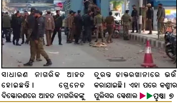
ସାଧାରଣ ନାଗରିକ ଆହତ ହୋଇଛନ୍ତି । ଗ୍ରେନେଡ ବିସ୍ଫୋରଣରେ ଆହତ ନାଗରିକଙ୍କୁ ପୁଲିସ୍ ସେବାଳାଳୀ ►►ପୃଷ୍ଠା ୭

୧୦ରୁ ଅଧିକ ନାଗରିକ ଆହତ ହୋଇଥିବା କୁହାଯାଇଛି । ଶ୍ରୀମନ୍ଦିରର ପର୍ଯ୍ୟଟକ ସ୍ୱାଗତ କେନ୍ଦ୍ର ଦାହାରେ ଥିବା ବଜାରରେ ରବିବାର କାରଣରୁ ବହୁ ସଂଖ୍ୟାରେ ଲୋକଙ୍କ ଗହଳି ରହିଥିଲା । ଏହି ସମୟରେ ଏପରି ଗ୍ରେନେଡ ଆକ୍ରମଣ କାରଣରୁ ଅନେକ ଲୋକ ଆହତ ହୋଇଛନ୍ତି । ପ୍ରାରମ୍ଭିକ ଗଣମାଧ୍ୟମ ରିପୋର୍ଟ ଅନୁଯାୟୀ ଏହି ଆକ୍ରମଣରେ ପ୍ରାୟ ୧୦ ଜଣ