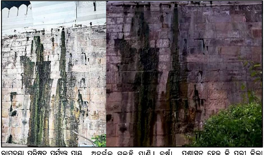
ରାମଦୟା ପରିଷଦ ପର୍ଯ୍ୟନ୍ତ ପ୍ରାୟ ୬୦ ଫୁଟ ଲମ୍ବରେ ମେଘନାଦ ପାଟେରୀର ଏକାଧିକ ସ୍ଥାନରେ ଫାଟ ଜଳ ଜଳ ହୋଇ ବିଶୁଦ୍ଧି । ଅନେକ ସ୍ଥାନରେ କଣା ହୋଇ ଝରଣା ଭଳି ଅନର୍ଗଲ ଗଲୁଛି ପାଣି । ବର୍ଷା ହେଲେ ସ୍ଥିତି ଅଧିକ ସଂଗୀନ ହୋଇପଡ଼ୁଛି । ସବୁଠୁ ଦେଶୀ ପାଣି ଗଲି ଗଲୁଛି ଆନନ୍ଦ ବଜାର କଡ଼ ପାଟେରୀରେ । ହେଲେ ଶ୍ରୀମନ୍ଦିର ପ୍ରଶାସନ ସେଇ କି ପୁରୀ ଜିଲ୍ଲା ପ୍ରଶାସନ ସମସ୍ତେ ଏହାକୁ ଦେଖି ନଦେଖୁ । ପରି ହେଉଛନ୍ତି । ସେପଟେ ଐତିହ୍ୟର ସୁରକ୍ଷା ଦାୟିତ୍ୱରେ ►►ପୃଷ୍ଠା ୭

ପୁରୀ, ୦୩/୧୧ (ନି.ପ୍ର): ପୁରୀ ଶ୍ରୀମନ୍ଦିରର ମେଘନାଦ ପାଟେରୀ ଅପୁରୁଷିତ ହୋଇପଡ଼ିଛି । ଐତିହ୍ୟ ସଂପନ୍ନ ପାଟେରୀର ଏକାଧିକ ସ୍ଥାନକୁ ଅନବରତ ଗଲୁଛି ପାଣି । ଏହାକୁ ଦେଖି ଦୁଃଖିକାବାଳାଙ୍କୁ ସେବାୟତଙ୍କ ଯାଏ ପ୍ରଶାସନ ଓ ଇଞ୍ଜିନିୟରିଂ ପଣିଆ ଉପରେ ପ୍ରଶ୍ନ ଉଠାଇଛନ୍ତି । ଏଥିସହ ପରିକ୍ରମା ପ୍ରକଳ୍ପ ନିର୍ମାଣ ସମୟରେ କେପରୁଆ କାମ ଯୋଗୁ ଏକଲି ସ୍ଥିତି ଉପସ୍ଥିତ ଥିବା ଅଭିଯୋଗ ଆଣିଛନ୍ତି । ଶ୍ରୀମନ୍ଦିର ସୁରକ୍ଷା କର୍ତ୍ତା ହେଉଛି ମେଘନାଦ ପାଟେରୀ । ହେଲେ ଏହି ପାଟେରୀର ଏକାଧିକ ସ୍ଥାନରେ ଫାଟ ଓ କଣା ରହିଛି । ସେଥି ମଧ୍ୟରୁ ଅନବରତ ଝରୁଛି ପାଣି । ପାଟେରୀରେ ଶିଉଳି ମଧ୍ୟ ମାଡ଼ି ଗଲାଣି । ସିଂହଦ୍ୱାର ସମ୍ମୁଖକୁ ଲାଲୁକି ମଠ ଧୂଳିକୁଣ୍ଡ ଠାରୁ