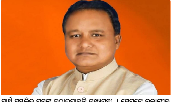
ସ୍ୱାର୍ଥ ସମ୍ପର୍କ ପ୍ରସଙ୍ଗ ଉଠାଇପାରନ୍ତି ମୁଖ୍ୟମନ୍ତ୍ରୀ । ସେପଟେ ବଲାଙ୍ଗୀର ଗଣ୍ଡରେ ମୁଖ୍ୟମନ୍ତ୍ରୀ ମୋହନ ମାଝୀ ଯାଉଛନ୍ତି । ଉତ୍କଳା ବିଭିନ୍ନ ପ୍ରକଳ୍ପର ଶିଳାଧାରା ସହ ଉପଯୋଗୀ କାର୍ଯ୍ୟକ୍ରମ ପରେ ଆଜି ସର୍ବିକ୍ତ ହାରସଠାରେ ସାମ୍ବାଦିକ ସମ୍ମିଳନୀ କରିଥିଲେ । ଏଥିରେ ବଲାଙ୍ଗୀରକୁ ଅବହେଳା କରାଯାଇଥିବା କହି ପୂର୍ବ ସରକାର ଉପରେ ବର୍ଷିତା ସହ ବଲାଙ୍ଗୀର ବିକଶିତ ହେବ ବୋଲି ପ୍ରତିଶ୍ରୁତି ଦେଇଛନ୍ତି । ଏଥିସହ ମହାନଦୀ କଳ ବିବାଦକୁ ନେଇ ସୂଚନା ଦେଇଛନ୍ତି । ମୁଖ୍ୟମନ୍ତ୍ରୀ କହିଛନ୍ତି ମହାନଦୀ କଳ ବିବାଦ ନେଇ ଛତିଶଗଡ଼ ମୁଖ୍ୟମନ୍ତ୍ରୀଙ୍କ ସହ ୨ ଥର ଆଲୋଚନା କରାଯାଇଛି । ନୂଆ ସରକାର ହେବା ପରେ ଏହି ପ୍ରସଙ୍ଗକୁ ଅତି ଗୁରୁତ୍ୱ ଦିଆଯାଇଛି । ବିବାଦ ସମାଧାନ ପାଇଁ ଆଲୋଚନା ଚାଲିଛି । ଖୁବଶୀଘ୍ର ଏନେଇ ସବିଶେଷ ସୂଚନା ଦିଆଯିବ । ପୂର୍ବ ସରକାର ଅମଳରେ ବଲାଙ୍ଗୀରକୁ ଅବହେଳା କରାଯାଇଥିବା କହିଛନ୍ତି ମୁଖ୍ୟମନ୍ତ୍ରୀ । ଦିଲ୍ଲୀକୁ ଯେତେ ଗୁରୁତ୍ୱ ଦିଆଯିବ କଥା ଦିଆଯାଇବ । ►►ପୃଷ୍ଠା ୭

ଭୁବନେଶ୍ୱର, ୦୩/୧୧ (ନି.ପ୍ର): ବିଦେଶ ଗଣ୍ଡରେ ଯିବେ ମୁଖ୍ୟମନ୍ତ୍ରୀ । ୩ ଦିନିଆ ବିଦେଶ ଗଣ୍ଡରେ ଯିବେ ମୁଖ୍ୟମନ୍ତ୍ରୀ ମୋହନ ମାଝୀ । ୧୮ରୁ ୨୦ ତାରିଖ ବିଜ୍ଞାନପୁର ଗଣ୍ଡରେ ଯିବେ । ଉତ୍କର୍ଷ ଓଡ଼ିଶା, ମେକଇନ୍ ଓଡ଼ିଶା କନକ୍ୱେଟ୍ ୨୦୨୫ ପାଇଁ ହେବ ରୋଡ୍ ସୋରେ ସାମିଲ ହେବେ ମୁଖ୍ୟମନ୍ତ୍ରୀ । ରୋଡ୍ ସୋରେ ଯୋଗଦେବା ସହ ବିଦେଶକଙ୍କ ସହ ଆଲୋଚନା କରିବା ନେଇ ସୂଚନା ମିଳିଛି । ମୁଖ୍ୟମନ୍ତ୍ରୀଙ୍କ ସହ ଶିକ୍ଷା ମନ୍ତ୍ରୀ ଓ ବରିଷ୍ଠ ଅଧିକାରୀ ଗଣ୍ଡରେ ଯିବେ । ସେପଟେ ଆସନ୍ତାକାଲି ମୁଖ୍ୟମନ୍ତ୍ରୀଙ୍କୁ ଦିନିଆ ଦିଲ୍ଲୀ ଗଣ୍ଡରେ ଯାଉଛନ୍ତି । ସରକାରୀ କାର୍ଯ୍ୟକ୍ରମରେ ଯୋଗ ଦେବେ । ଦିଲ୍ଲୀ ଗଣ୍ଡ ସମୟରେ ଏକାଧିକ କେନ୍ଦ୍ରମନ୍ତ୍ରାଳୟ ଭେଟିବା କାର୍ଯ୍ୟକ୍ରମ ରହିଛି । ଏତିକି ବେଳେ ଓଡ଼ିଶାର