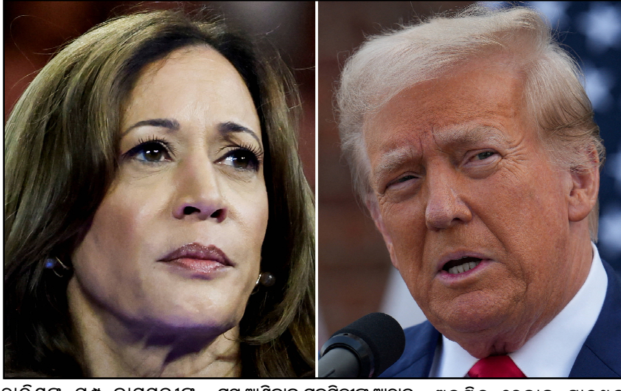
ହାରିସଙ୍କୁ ଟ୍ରମ୍ପ ବାମପଟୁ । ସପକ୍ଷବାଦୀ କହିବା ସହ ଦେଶରେ ଶାନ୍ତି ଏବଂ ସମୃଦ୍ଧିର ଏକ ନୂତନ ଯୁଗ ଆଣିବାକୁ ଯୁବପିଢ଼ାକୁ ଆହ୍ୱାନ ଦେଇଛନ୍ତି । ଏସବୁ ମଧ୍ୟରେ ଆସନ୍ତା ୫ ତାରିଖରେ ମତଦାନ ଅନୁଷ୍ଠିତ ହେବାକୁ ଯାଉଥିବା ବେଳେ ଜାଣନ୍ତୁ କଣ ରହିଛି ଏଂଖ୍ୟା ଗଣିତ ।

ନୂଆଦିଲ୍ଲୀ, ୦୩/୧୧ : ଦିନକ ପରେ ଆମେରିକା ରାଷ୍ଟ୍ରପତି ନିର୍ବାଚନ ପାଇଁ ପଡ଼ିବ ଭୋଟ । ପ୍ରଚାରର ଶେଷ ଦିନରେ ଭୋଟରଙ୍କ ନିକଟତର ହେଲେ ତେମୋକ୍ରାଟିକ୍ ପାର୍ଟିର ରାଷ୍ଟ୍ରପତି ପ୍ରାର୍ଥୀ କମଳା ହାରିସ ଓ ପ୍ରତିଦ୍ୱନ୍ଦ୍ୱୀ ରିପବ୍ଲିକାନ ପାର୍ଟିର ପ୍ରାର୍ଥୀ ତଥା ପୂର୍ବତନ ରାଷ୍ଟ୍ରପତି ଡୋନାଲ୍ଡ୍ ଟ୍ରମ୍ପ । କମଳା ହାରିସ ଶନିବାର ଦିନ ଡିଫେନ୍ସରେ ଦକ୍ଷ କର୍ମୀଙ୍କୁ ସମାଧାନ କରି ବିଜୟୀ ନେଇ ବୃତ୍ତୋକ୍ତି ପ୍ରକାଶ କରିଛନ୍ତି । ସେହିପରି ଭର୍ଟିଆରେ ଶେଷ ଦିନରେ ପ୍ରଚାର କରିଛନ୍ତି ଡୋନାଲ୍ଡ୍ ଟ୍ରମ୍ପ । ଏହି ସମୟରେ ସେ କୋ ବାଇଡେନ ଓ କମଳା ହାରିସଙ୍କ ଉପରେ ପ୍ରବଳ ବର୍ଷାଛନ୍ତି । କମଳା