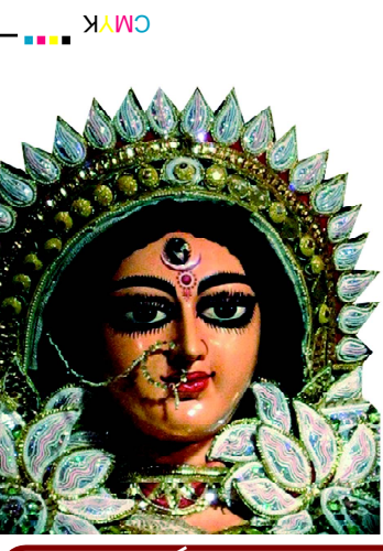
ଯା ଦେବୀ ସର୍ବଭୂତେଷୁ.....

website : www.dhwanipratidhwani.net email: pratidhwani.dhwani@gmail.com