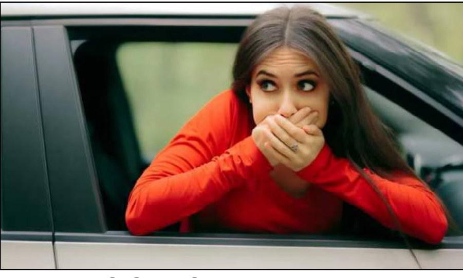
ଏହି ଚିକ୍ଷାଗୁଡ଼ିକ ଅନୁସରଣ କରନ୍ତୁ:

ଭ୍ରମଣ ସମୟରେ ଆପଣ ଯଦି ବାନ୍ତି ପରି ସମସ୍ୟା ଭୋଗୁଛନ୍ତି, ତେବେ ଏଠାରେ କିଛି ଚିକ୍ଷା ଏବଂ ଘରୋଇ ଉପଚାର ଅଛି, ଯାହାକୁ ଆପଣେ ଆପଣ ଏହି ସମସ୍ୟାକୁ ଦୂର କରିପାରିବେ । ଏହି ଚିକ୍ଷା ଆପଣଙ୍କ ବାନ୍ତିକୁ ନିୟନ୍ତ୍ରଣ କରିବ ଏବଂ ଆପଣଙ୍କର ଯାତ୍ରା ଉପଭୋଗ କରିବାରେ ସାହାଯ୍ୟ କରିପାରିବ । ବୁଲିଯିବାକୁ କାହାକୁ ବା ଭଲ ନ ଲାଗେ । ଏହା ଏକ ମଜାଦର ସମୟ । କିନ୍ତୁ ଅନେକ ଅଛନ୍ତି ଯେଉଁମାନଙ୍କ ପାଇଁ ଏହା ସେତେ ଉପଭୋଗ୍ୟ ହୋଇ ନଥାଏ । ଭ୍ରମଣ ସମୟରେ ଅନେକ ଲୋକ ନ ଭଲ ସ ହୋଇଯାଆନ୍ତି, କେହି କେହି ଗାଡ଼ିରେ ବାନ୍ତି ମଧ୍ୟ କରନ୍ତି । ଆଉ କିଛିଙ୍କର ମୁଣ୍ଡ ମଧ୍ୟ ବୁଲାଇବା ଆରମ୍ଭ ହୁଏ । ସେ କିମାନ ହେଉ କି ଡ୍ରୋବ୍, କାର୍ କିମ୍ବା ଡଙ୍ଗା ଗତି ମୋସନ ସିକ୍ନେସ୍(ବାନ୍ତି ସମସ୍ୟା) ଯେକୌଣସି ସମୟରେ ବି ହୋଇପାରେ । ଏହା ଭ୍ରମଣକୁ ପୂରା ବେକାର କରିଦିଏ । ଖାଲି ବାନ୍ତି କରୁଥିବା ବ୍ୟକ୍ତି ନୁହେଁ ସାଙ୍ଗରେ ଥିବା ପରି ବାର ଲୋକଙ୍କ ପାଇଁ ମଧ୍ୟ ଏହା ବିଗାଡ଼ି ଦିଏ । ଯଦି ଭ୍ରମଣ ସମୟରେ ଆପଣ ବି ବାନ୍ତି ପରି ସମସ୍ୟା ଭୋଗୁଛନ୍ତି, ତେବେ ଏଠାରେ କିଛି ଚିକ୍ଷା ଏବଂ ଘରୋଇ ଉପଚାର ଅଛି, ଯାହାକୁ ଆପଣେ ଆପଣ ଏହି ସମସ୍ୟାକୁ ଦୂର କରିପାରିବେ । ଏହି ଚିକ୍ଷା ଆପଣଙ୍କ ବାନ୍ତିକୁ ନିୟନ୍ତ୍ରଣ କରିବ ଏବଂ ଆପଣଙ୍କର ଯାତ୍ରା ଉପଭୋଗ କରିବାରେ ସାହାଯ୍ୟ କରିପାରିବ ।