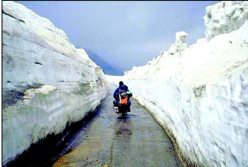
ରୋହତାଳ ପାସ- ମନାଲି-ଲେହରୁ ଲେହ ଯିବା ରାସ୍ତା ବେଶ୍ ମନାଲିଠାରୁ ପ୍ରାୟ ୫୧ କି.ମି. ଉପରକୁ ନେନୋରମ। ଯଦ୍ୱାରା ପର୍ଯ୍ୟଟକ ଏଠାକୁ ଚଳେ ରୋହତାଳକୁ ଯାତ୍ରା ଆରମ୍ଭ ହୁଏ। ବାରଘାର ଆସିବାକୁ ଇଚ୍ଛା କରିଥାନ୍ତି।