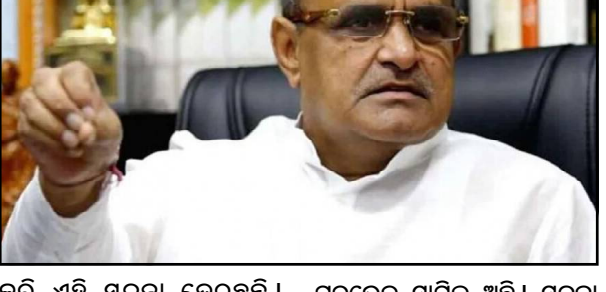
କରି ଏହି ସୂଚନା ଦେଇଛନ୍ତି। ବ୍ୟକ୍ତିଗତ କାରଣ ଯୋଗୁ କେସି ତ୍ୟାଗୀ ଇସ୍ତଫା ଦେଇଥିବା କଥା କୁହାଯାଉଥିଲେ ମଧ୍ୟ ଏହା ପଛରେ ଅନେକ କାରଣ ଲୁଚି ରହିଛି। ତାଙ୍କର ଲଗାତର ବିବାଦୀୟ ବୟାନ ଯୋଗୁ ଦଳ ଭିତରେ ଓ ବାହାରେ ସୃଷ୍ଟି ହୋଇଥିବା

ନୂଆଦିଲ୍ଲୀ, ୧/୯ : ଜନତା ଦଳ ମୁନାଭଟ୍ଟେଟ୍ ତଥା ଜେଡିୟୁ ଦଳରେ କିଛି ଠିକ୍ ଠାଲିନଥିବା ଚର୍ଚ୍ଚା ହେଉଛି। ଇସ୍ତଫା ଦେଇଛନ୍ତି ବିହାର ମୁଖ୍ୟମନ୍ତ୍ରୀ ନୀତୀଶ କୁମାରଙ୍କ ଅତି ଘନିଷ୍ଠ କୁହାଯାଉଥିବା କେସି ତ୍ୟାଗୀ। ସେ ଦଳର ଦଳର କାର୍ତ୍ତବ୍ୟ ମୁଖପାତ୍ର ପଦରୁ ଇସ୍ତଫା ଦେଇଛନ୍ତି। ବ୍ୟକ୍ତିଗତ କାରଣ ଦର୍ଶାଇ ସେ ଇସ୍ତଫା ଦେଇଥିବା କୁହାଯାଇଛି। ତାଙ୍କ ସ୍ଥାନରେ ନୀତୀଶ କୁମାର ରାଜୀବ ରଞ୍ଜନଙ୍କୁ ଦଳର ନୂତନ କାର୍ତ୍ତବ୍ୟ ମୁଖପାତ୍ର ଭାବେ ନିଯୁକ୍ତ କରିଛନ୍ତି। ଏନେଇ ଦଳର ସାଧାରଣ ସମ୍ପାଦକ ଆପାକ ଅହମ୍ମଦ ଖାନ ଏକ ଟିପ୍ପଣୀ