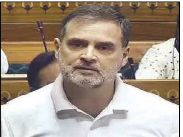
ହେଉଛି ଯେଉଁମାନେ ଘୁଣାକୁ ରାଜନୈତିକ ଅଧିକାରୀଙ୍କୁ କଡ଼ା ସମାଲୋଚନା କରି ସାଂସଦ ରାହୁଲ ଗାନ୍ଧି କହିଛନ୍ତି,

ମୁମ୍ବାଇ , ୧/୯ (ନି.ପ୍ର): ମହାରାଷ୍ଟ୍ରର ଧିଲେ ଏକପ୍ରେସ୍ ଟ୍ରେନରେ ଘଟଣାରେ ଜଣେ ୭୨ ବର୍ଷୀୟ ବ୍ୟକ୍ତିଙ୍କୁ ମାଡ଼ ମରାଯାଇଥିବାର ଏକ ଭିଡିଓ ସୋସିଆଲ ମିଡିଆରେ ଭାଇରାଲ ହେବା ପରେ ଭିଡିଓରେ ଦେଖାଯାଇଥିବା ମାଙ୍କ ଅଭିଯୁକ୍ତଙ୍କୁ ପୁଲିସ ଗିରଫ କରିଛି। ଏବେ ଏହାକୁ ନେଇ ରାଜନୀତି ମଧ୍ୟ ସରଗରମ ହୋଇଛି। ଲୋକସଭାରେ ବିରୋଧୀ ଦଳ ନେତା ରାହୁଲ ଗାନ୍ଧି ଉକ୍ତ ବ୍ୟକ୍ତିଙ୍କ ଫଟୋ ସେୟାର କରି ବିଜେପି ସରକାରଙ୍କୁ କଡ଼ା ସମାଲୋଚନା କରିଛନ୍ତି। ବିଜେପି ଘୁଣା ଓ ଖୋଲା