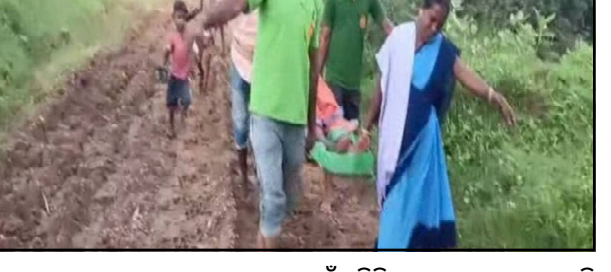
ହେଲେ ରାସ୍ତା ଖରାପ ଥିବାରୁ ଆୟୁଲାନୁ ଗାଁରେ ପହଞ୍ଚିପାରିଲାନି। ଗାଁଠୁ କିଛି ଦୂରରେ ଆୟୁଲାନୁ ଅବକି ରହିଥିଲା। ସେହି ସମୟ ଭିତରେ

ସମ୍ବଲପୁର, ୧/୯ (ନି.ପ୍ର): ଖରାପ ରାସ୍ତା ଯୋଗୁ ଆସିପାରିଲାନି ଆୟୁଲାନୁ। ଠିକ୍ ସମୟରେ ମେଡିକାଲ ନ ଯାଇପାରିବାରୁ ଚାଲିଗଲା କଅଁଳ ଶିଶୁର ଜୀବନ। ଏପରି ଦୁଃଖଦ ଘଟଣା ଘଟିଛି ସମ୍ବଲପୁର ଜିଲ୍ଲା ରେଢ଼ାଖୋଲରେ। ଖରଣାଳି ଗାଁର ରଥ ବିଧାନଳୟ ପୂର୍ଣ୍ଣା ୨୩ସର ଗର୍ଭବତୀ ଥିଲେ। ୫୦୦୦ ଟାଙ୍କର ପ୍ରସବ ଯନ୍ତ୍ରଣା ହୋଇଥିଲା। ପରିବାର ଲୋକେ ଆୟୁଲାନୁକୁ ଫୋନ୍ କରିଥିଲେ।