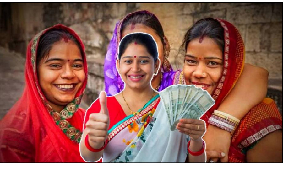
ଭୁବନେଶ୍ୱର, ୧/୯ (ନି.ପ୍ର): ବହୁ ପ୍ରତୀକ୍ଷିତ 'ସୁଭଦ୍ରା' ଯୋଜନା ପାଇଁ ଆଜିଠାରୁ ଆରମ୍ଭ ହେଲା ଆବେଦନ। ସେଥିପାଇଁ ଅଜ୍ଞାନବାଦି କେନ୍ଦ୍ରରେ ଲାଗିଛି ଲମ୍ବା ଲାଇନ। ଅଜ୍ଞାନବାଦି କେନ୍ଦ୍ର ବ୍ୟତୀତ ବୁଲୁ ଅର୍ଥସ, ମୋ ସେବା କେନ୍ଦ୍ର ଓ କନସେବା କେନ୍ଦ୍ରରେ ଦେଖିବାକୁ ମିଳୁଛି ଅସମ୍ଭାଳ ଭିଡ଼। ଏମିତି କି ଗାଁରେ ଘର ଘର ବୁଲି ଫର୍ମ ବାଣ୍ଟୁଛନ୍ତି ଅଜ୍ଞାନବାଦି ବିଦି। ତା'ସହିତ ଫର୍ମ କେମିତି ପୁରଣ କରିବେ, ଆଉ କେଉଁ କେଉଁ ପ୍ରମାଣପତ୍ର ଦେଇ ଆବେଦନ କରିବେ ସେ ନେଇ ମଧ୍ୟ ସଚେତନ କରୁଛନ୍ତି। ଆରମ୍ଭ ହେଲା ସୁଭଦ୍ରା ଯୋଜନା। ତାହା ହେଲେ କେମିତି ପୁରଣ କରିବେ 'ସୁଭଦ୍ରା' ଫର୍ମ ଆଉ କ'ଣ କ'ଣ ପ୍ରମାଣପତ୍ର ଦେବେ? ପ୍ରଥମେ ଆଧାର କାର୍ଡରେ ଥିବା ନାମ ଲେଖି, ଆଧାର ନମ୍ବର ଲେଖିବାକୁ ପଡ଼ିବ। ପରେ ସ୍ୱାମୀ ନିୟମାବଳୀ ନାମ ଲେଖିପାରିବେ। ଜନ୍ମ ତାରିଖ ସ୍ଥାନରେ ଆଧାର କାର୍ଡରେ ଥିବା ତାରିଖ ଦେବାକୁ ହେବ। କୁଳାଳ ୧ ସୁଦ୍ଧା ଆବେଦନକାରୀଙ୍କୁ

ସୁଗିତ ପରାମର୍ଶକୁ ବଦଳାଇବା ପାଇଁ ସବୁ ପ୍ରକାରର ପଦକ୍ଷେପ ନେଇ ଦୂରତ ନ୍ୟାୟ ଉପରେ ଫୋକସ କରାଯିବା ଦରକାର। ଦୁଃଖର କଥା ହେଉଛି ଯେ କିଛି ମାମଲାରେ ଅପରାଧ ଘଟାଇବା ପରେ ଲୋକମାନେ ବେଅଡ଼କ ବାହାରେ ବୁଲୁଛନ୍ତି। ହେଲେ ପାଡ଼ିତା ଭୟରେ ରହୁଛନ୍ତି। ଏ କ୍ଷେତ୍ରରେ ମହିଳାମାନଙ୍କ ସୁରୁତ୍ୱ ଆହୁରି ଖରାପ। ଗୋଟିଏ ସଭ୍ୟ ସମାଜ କେବେ ହେଲେ ଏହାକୁ ସମର୍ଥନ କରେନାହିଁ ବୋଲି ସେ କହିଛନ୍ତି। ଭାରତ ମଣ୍ଡଳରେ ଅନୁଷ୍ଠିତ କାର୍ଯ୍ୟକ୍ରମରେ ରାଷ୍ଟ୍ରପତି ଡ୍ରୌପଦୀ ମୂର୍ମୁଙ୍କ ସହ ପ୍ରଧାନ ବିଚାରପତି ଜଷ୍ଟିସ ଡି.ୟୁ. ଚନ୍ଦ୍ରଚୂଡ଼ ଓ କେନ୍ଦ୍ର ଆଇନ ରାଷ୍ଟ୍ରମନ୍ତ୍ରୀ (ସାଧାରଣ) ଅର୍ଜୁନ ରାମ ମେଘୱାଲ ମଧ୍ୟ ଯୋଗ ଦେଇଥିଲେ। ଏହି କାର୍ଯ୍ୟକ୍ରମରେ ରାଷ୍ଟ୍ରପତି ସୁପ୍ରିମକୋର୍ଟର ଗୋଟିଏ ପତାକା ଭିଲି କରାଯାଇଛି।