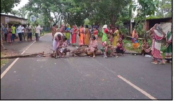
ଯାଇଥିଲେ। ହେଲେ ଘରକୁ ଫେରିନଥିଲେ। ଝିଅ ଘରକୁ ନଫେରିବାକୁ ପରିବାର ଲୋକେ ଚାରିଆଡ଼େ ଖୋଜିଥିଲେ। ହେଲେ ତାଙ୍କ ପରା ପାଇନଥିଲେ। ନିଜର ବଢ଼ିଲା ଝିଅକୁ ନପାରି ପରିବାର