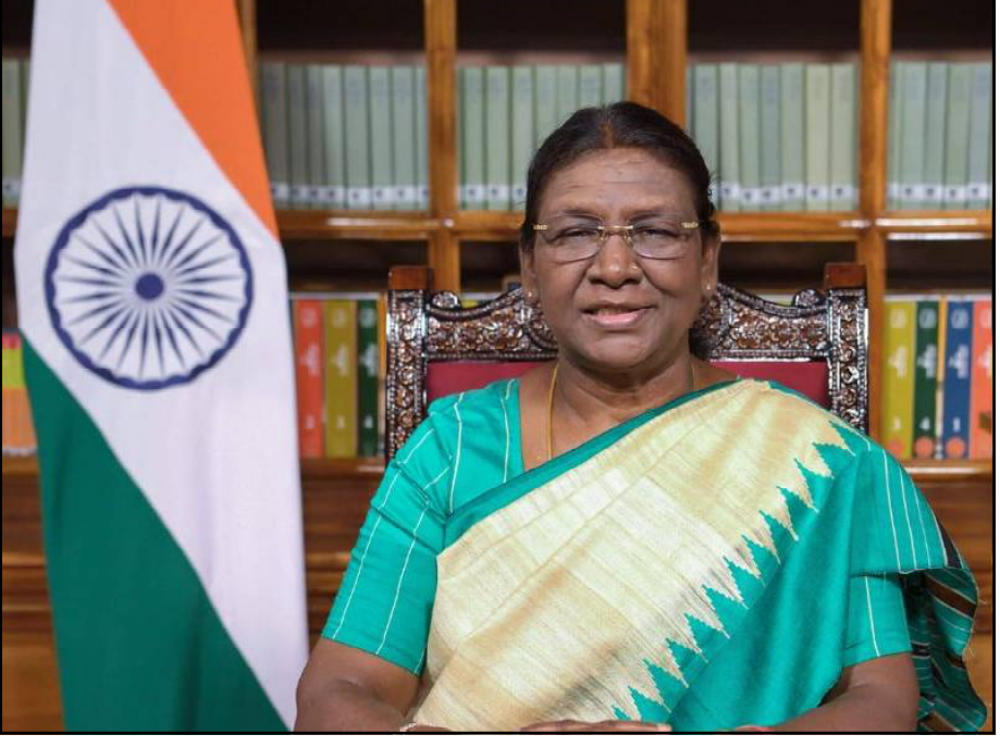
କାରଣ ସେମାନେ ନ୍ୟାୟପାଳିକାକୁ ନ୍ୟାୟ ପାଆନ୍ତି। କଥାରେ ଅଛି ଭଗବାନଙ୍କ ଘର ବିଳମ୍ବ ହୋଇପାରେ, କିନ୍ତୁ ଅନ୍ଧକାର ନୁହେଁ। କିନ୍ତୁ ବିଳମ୍ବ କେତେ ହୋଇପାରେ? ଏହା କେତେ ଲମ୍ବା? ଏହା ଉପରେ ଆମକୁ ଚିନ୍ତା କରିବାକୁ ପଡ଼ିଛି। ଜଣେ ନ୍ୟାୟ ପାଉଁଶ ବେଳକୁ ତାଙ୍କର ହସ ସମ୍ବନ୍ଧରେ ଲିଭି ଯାଇଥିବ। ତାଙ୍କ କାବନ ସରି ଯାଇଥିବ। ଆମକୁ ଅତ୍ୟନ୍ତ ବ୍ୟାପକ ଓ ଗଭୀର ଭାବେ ଏହାକୁ ଦେଖିବାକୁ ପଡ଼ିବ ବୋଲି ରାଷ୍ଟ୍ରପତି ମୂର୍ମୁ କହିଛନ୍ତି। ସେ ଆହୁରି କହିଛନ୍ତି ଯେ ମାମଲାର ଶୁଣାଣି ବେଳେ ହେଉଥିବ।

ନୂଆଦିଲ୍ଲୀ, ୧/୯ : ବିଚାର ପାଇଁ ପଡ଼ି ରହିଥିବା ମାମଲା ଓ ଶୁଣାଣିରେ ବିଳମ୍ବ ହେବା ନ୍ୟାୟପାଳିକା ପାଇଁ ଗୋଟିଏ ବଡ଼ ଚ୍ୟାଲେଞ୍ଜ ବୋଲି ରାଷ୍ଟ୍ରପତି ଡ୍ରୌପଦୀ ମୂର୍ମୁ କହିଛନ୍ତି। ଏଥିସହ ସେ ଉଚିତ ନ୍ୟାୟ ଉପରେ ଗୁରୁତ୍ୱ ଦେଇଛନ୍ତି। ବିଶେଷ କରି ସେ ଦୁଷ୍ଟମାନଙ୍କୁ ଗୁଡ଼ିକ ଉପରେ ଫୋକସ କରିଛନ୍ତି। ଏଥିସହ କୋର୍ଟରେ ପଡ଼ି ରହିଥିବା ଦୁଷ୍ଟମାନଙ୍କୁ ନେଇ ମଧ୍ୟ ସେ ଚିନ୍ତା ପ୍ରକଟ କରିଛନ୍ତି। ଦୂର ଦୈନିକା କିଲ୍ଲୁଝରାୟ ନ୍ୟାୟପାଳିକାର କାର୍ଯ୍ୟ ସମ୍ପର୍କରେ ସମ୍ବନ୍ଧିତ କରି ରାଷ୍ଟ୍ରପତି ମୂର୍ମୁ କହିଛନ୍ତି, "ଦୁଷ୍ଟମାନଙ୍କୁ ନେଇ କୋର୍ଟରେ ଯେତେବେଳେ କୋର୍ଟଙ୍କ ରାୟ ଗୋଟିଏ ପଡ଼ି ପରେ ପାରିତ ହେଉଛି ସେତେବେଳେ ସାଧାରଣ ଲୋକ ଭାବୁଛନ୍ତି ଯେ ନ୍ୟାୟ ପ୍ରଦାନ ପ୍ରକ୍ରିୟା ଅତ୍ୟନ୍ତ ଅସମ୍ଭବନୀୟ।" ରାଷ୍ଟ୍ରପତି ମୂର୍ମୁଙ୍କ କହିବା କଥା ଗାଁରେ ଲୋକମାନେ ନ୍ୟାୟପାଳିକାକୁ ଭଗବାନ ବୋଲି ବିବେଚନା କରନ୍ତି।