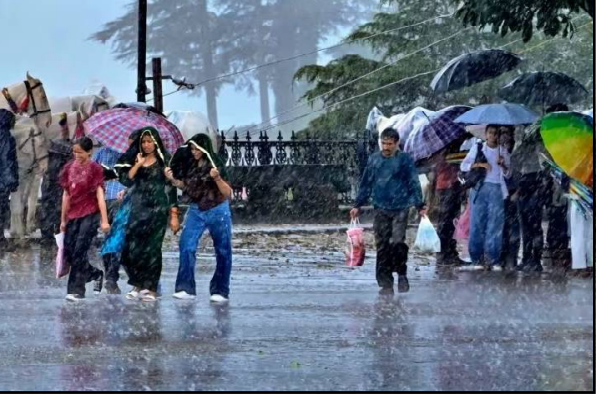
ଓ ଉତ୍ତର ଓଡ଼ିଶାରେ ପ୍ରବଳ ବର୍ଷା ଆଶଙ୍କା ରହିଛି। ଆଂଚଳିକ ପାଣିପାଗ ବିଭାଗ ବିଶେଷକରି କୋରାପୁଟ ଓ ମାଲକାନାଗିରିର

ଭୁବନେଶ୍ୱର, ୧/୯ (ନି.ପ୍ର): ଗତକାଲିର ଅବପାତ ଆଜି ଉତ୍ତର ଆନ୍ଧ୍ରପ୍ରଦେଶ ଏବଂ ଦକ୍ଷିଣ ଓଡ଼ିଶା ଉପକୂଳରେ ରହିଛି। ଗତ ୬ ଘଣ୍ଟା ହେବ ଘଣ୍ଟାପୂର୍ତ୍ତି ୨୦ କିଲୋମିଟର ବେଗରେ ଗତି କରୁଛି ଅବପାତ। ଏହା ବିଶାଖାପାଟଣା ଠାରୁ ୧୫୦ କିମି ଏବଂ ମାଲକାନଗିରି ଠାରୁ ୭୦ କିମି ଦୂରରେ ରହିଛି। ଆସନ୍ତା ୨୪ ଘଣ୍ଟାରେ ପର୍ଯ୍ୟନ୍ତ ଉତ୍ତର ପର୍ଯ୍ୟନ୍ତ ଦିଗରେ ଗତିକରି ଦକ୍ଷିଣ ଓଡ଼ିଶା ଉପକୂଳ ଅତିକ୍ରମ କରିବ। ପରେ ଦୁର୍ବଳ ହୋଇ ଖୋଲିମାଳି ଲୋପପ୍ରସରରେ ପରିଣତ ହେବ। ପ୍ରଭାବରେ ଆଜି ଦକ୍ଷିଣ ଓଡ଼ିଶା