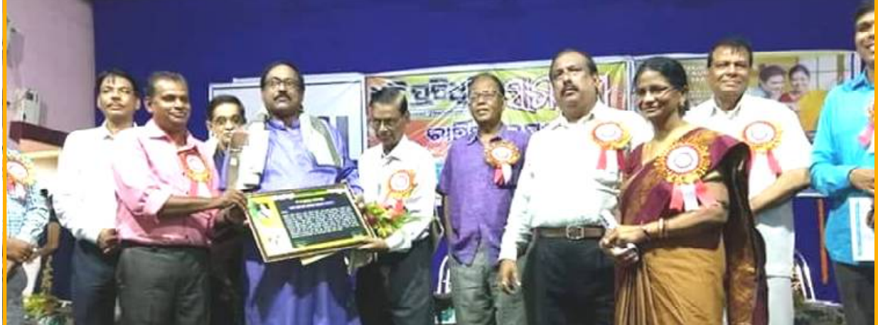
ସମ୍ବର୍ଦ୍ଧିତ ହେବା ମଧୁର ମୁହୂର୍ତ୍ତ...