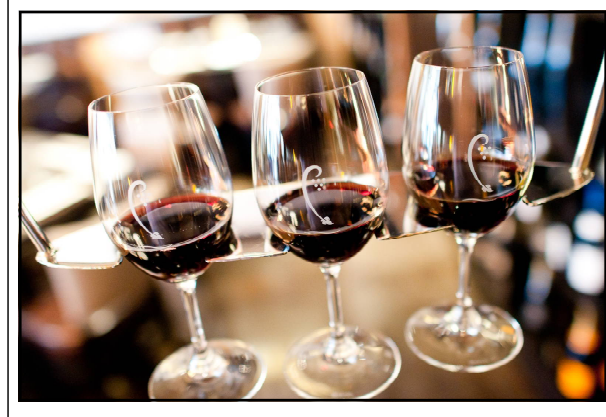
ଭୁବନେଶ୍ୱର, ୩୧/୮ (ନି.ପ୍ର): ଆସିଲା ନୂଆ ଅବକାରୀ ନୀତି । ବନ୍ଦ ହେଲା ବାର, ଖୋଲିବନି ନୂଆ ମଦ ଦୋକାନ । ଗ୍ରାମାଞ୍ଚଳରେ

ବାରକୁ ମିଳିବନି ଅନୁମତି । କେବଳ ୧୫-୨୦ରୁ ଅଧିକ ହୋଟେଲକୁ ବାର ଅନୁମତି ମିଳିବ । ବାରରେ ନାଚ ଉପରେ ରୋକ୍ ଲାଗିଥିବା ବେଳେ ମହିଳାମାନେ କିନ୍ତୁ ଗୀତ ପରି ବେଷଣ କରିପାରିବେ । ସବୁଠୁ ବଡ଼ କଥା ହେଲା ପ୍ରଥମ ଥର ପାଇଁ ନିଶା ବିରୋଧୀ ସଚେତନତା ପାଇଁ ୧୦୦ କୋଟି ଟଙ୍କାର ପାଣି ଗଠନ କରାଯାଇଛି । ଗାଁରୁ ଆରମ୍ଭ କରି ସହରାଞ୍ଚଳ ଯାଏ ସବୁଠି ନିଶା ବିରୋଧୀ ।