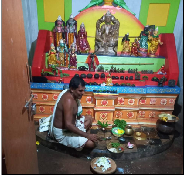
ପୂଜାର୍ଚ୍ଚନା ପ୍ରସାଦ ସେବନର ବ୍ୟବସ୍ଥା ହୋଇଅଛି ।

ବସ୍ତ୍ର, ୨୭/୮ (ନି.ପ୍ର): ବସ୍ତ୍ର ଅଞ୍ଚଳର ବିଭିନ୍ନ ସ୍ଥାନରେ ଜନ୍ମାଷ୍ଟମୀ ଆନନ୍ଦ ଭଙ୍ଗୁଥିବା ପାଳିତ ହେଉଥିବାବେଳେ ଉତ୍ତରାଖଣ୍ଡ ପ୍ରଦେଶର ପରିବାରରେ ଥିବା ବିଭିନ୍ନ ପ୍ରକାରର କରାଧାରା ପାଳିତ ହୋଇ ଯାଇଅଛି । ଦୁଇଶହରୁ ଅଧିକ ଭକ୍ତ ସମାଗମ ହୋଇଥିଲା । ଯଜ୍ଞ ପୂଜାର୍ଚ୍ଚନା ନାମ ସଂକଳନରେ ଉଚ୍ଚ ପରିବେଶ ଭକ୍ତି ଭାବନାରେ ଭକ୍ତ ମାନେ ଭାବ ବିଭୋର ହୋଇଥିଲେ । ସେହିପରି ମଥାନୀ ପଞ୍ଚାୟତ ସାମ୍ବନ୍ଧୀ ଶ୍ରୀମୁଖ୍ୟ ପାତ୍ର ଓ ଶିବଗିରିଆ ଗ୍ରାମର ସମ୍ପ୍ରଦାୟ ବେହେରାଙ୍କ ବାସଭବନରେ ଜନ୍ମାଷ୍ଟମୀ