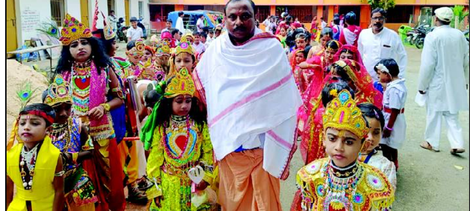
ସମୟରେ ବିଭିନ୍ନ ଛକ ରେ ପିଲା ମାନଙ୍କୁ ସ୍ୱାଗତ କରାଯିବା ସହିତ ପୂଜାର୍ଚ୍ଚନା ମଧ୍ୟ କରାଯାଇଥିଲା । ଯେମିତି ପ୍ରତ୍ୟକ୍ଷ ଭାବେ ପ୍ରଭୁ କୃଷ୍ଣ ବଳରାମ କୁ ସମସ୍ତେ ଦେଖିପାରୁଛନ୍ତି । ଏଭଳି କାର୍ଯ୍ୟକ୍ରମରେ ଏକ ଆଧ୍ୟାତ୍ମିକ ପରିବେଶ ସୃଷ୍ଟି ହୋଇଥିଲା । ଅନ୍ୟମାନଙ୍କ ମଧ୍ୟରେ ବିଦ୍ୟାଳୟର ପ୍ରଧାନ ଗୁରୁଜୀ

ନାଳଗିରି, ୨୪/୮ (ନି.ପ୍ର): ପବିତ୍ର ଶ୍ରୀକୃଷ୍ଣ ଜନ୍ମାଷ୍ଟମୀ କୁ ସାରା ଭାରତବର୍ଷରେ ସନାତନ ହିନ୍ଦୁ ସଂସ୍କୃତିର ମହାନ ପର୍ବ ଭାବରେ ପାଳିତ ହେଉଥିବାବେଳେ ବାଲେଶ୍ୱର ଜିଲ୍ଲା ନାଳଗିରି ସରସ୍ୱତୀ ଶିଶୁ ବିଦ୍ୟାଳୟର କୁନି କୁନି ଛାତ୍ର ଛାତ୍ରୀ ମାନଙ୍କୁ ନେଇ ଏକ ନିଆରା ତରଙ୍ଗରେ ଜନ୍ମାଷ୍ଟମୀ କୁ ପାଳନ କରାଯାଇଛି । ସକାଳ ୮ ଘଟିକା ସମୟରେ ବିଦ୍ୟାର୍ଥୀ ମାନେ କୃଷି, ବଳରାମ, ରାଧା, ସୁଦାମା, ବାସୁଦେବ, ଦେବକୀ, ଯଶୋଦା, ଗୋପ ବାସି ରୂପରେ ସଜଳହୋଇ ଜଗନ୍ନାଥ ମନ୍ଦିର ପରିକ୍ରମା କରିବାପରେ ନାଳଗିରି ବଜାର ପରିକ୍ରମା କରିଥିଲେ । ପରିକ୍ରମା