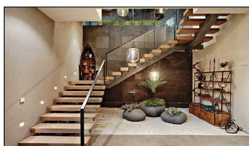
ଘରେ ଶିଡ଼ି ସବୁବେଳେ ଦକ୍ଷିଣ କିମ୍ବା ପଶ୍ଚିମ ଦିଗରେ ହେବା ଉଚିତ। ଉତ୍ତର କିମ୍ବା ପୂର୍ବ ଦିଗରେ ଶିଡ଼ି ଥିଲେ, ଏଥିପାଇଁ ଆର୍ଥିକ ଅନଟନ ଦେଖାଯାଏ ବୋଲି କୁହାଯାଏ।

ବାହୁ ଶାସ୍ତ୍ର ଅନୁସାରେ, ଘରେ ରଖାଯାଇଥିବା ପ୍ରତିଟି ଜିନିଷ ବ୍ୟକ୍ତିର ଆର୍ଥିକ, ଶାରୀରିକ ଓ ମାନସିକ ସ୍ଥିତି ଉପରେ ଶୁଭାଶୁଭ ପ୍ରଭାବ ପକାଏ।