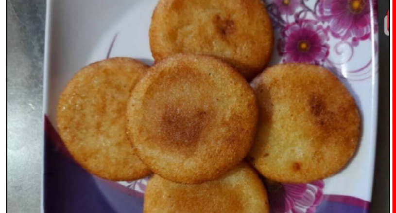
ଗଡ଼ିବା ଆରମ୍ଭ କରି ଦିଅନ୍ତୁ। ପରେ ଅଧ୍ୟାଏକ କଡ଼େଇ ତେଲ ଗରମ କରି ପୁର୍ବରୁ ପ୍ରସ୍ତୁତ କାକରାକୁ ଛାଣି ଦିଅନ୍ତୁ।

ଆବଶ୍ୟକ ସାମଗ୍ରୀ: ଆୟୁ, ସୁଜି, ପାନମଧୁରୀ, ଲୁଣ, ଗୁଡ଼, ଗୁଆ ଘିଅ, ନଡ଼ିଆ ଓ ରିଫାଇନ ଚୋକ।