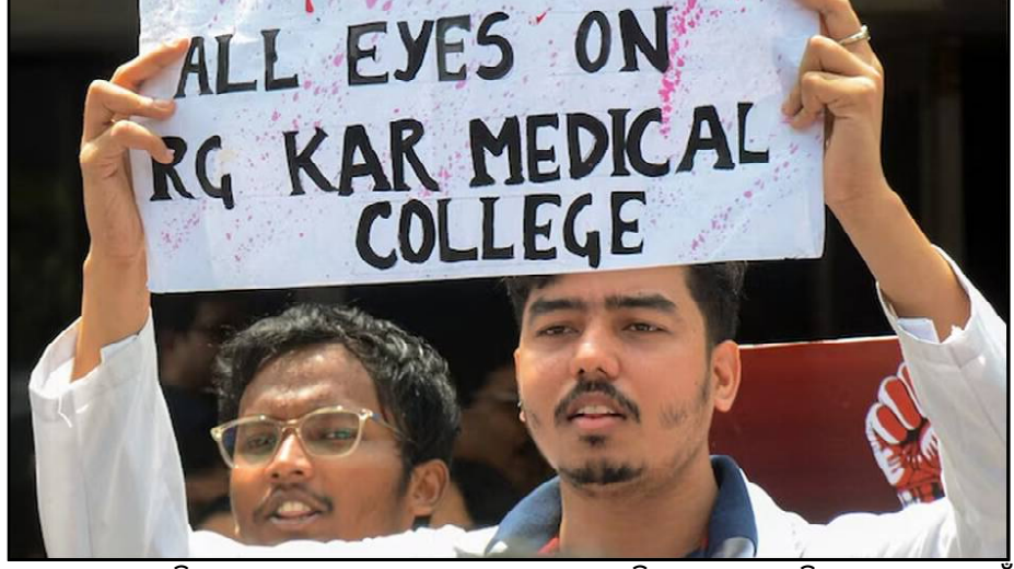
ଆମ ମହାନ ସହିଧ୍ୟାନର ନ୍ୟାୟ ଏବଂ ମାନବିକତାର ଆଦର୍ଶ ପ୍ରତି ଘୋର ଅପମାନ । ଯେଉଁଭଳି ଭାବେ ଏକ ଜୀବନକୁ ନିର୍ମୂଳ ଉପାସରେ ନଷ୍ଟ କରିଦିଆଗଲା, ତାହା ଆମ ଜାତିର ସାମୂହିକ ଦେହତାକୁ ବୋହାଇଦେଉଛି । ଯେଉଁ ପରିସରରେ ସେ ମାନବିକତାର ସେବା କରିଥିଲେ, ସେହି ପରିସରରେ ତାଙ୍କୁ ଅତି ନିର୍ମୂଳ ଭାବେ ଦୂର୍ବ୍ୟବହାର କରାଯାଇ ତାହା ଆମ ଜାତିର ସାମୂହିକ ଦେହତାକୁ ବୋହାଇଦେଉଛି ।