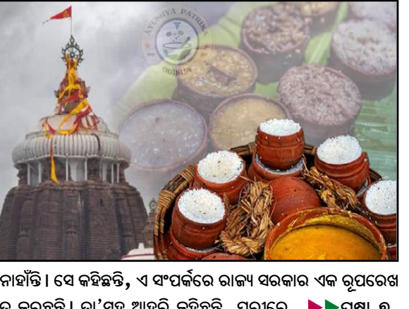
କରିନାହାଁନ୍ତି । ସେ କହିଛନ୍ତି, ଏ ସଂପର୍କରେ ରାଜ୍ୟ ସରକାର ଏକ ରୂପରେଖ ପ୍ରସ୍ତୁତ କରୁଛନ୍ତି । ତା'ସହ ଆହୁରି କହିଛନ୍ତି, ପୁରୀରେ

ପୁରୀ, ୧୮/୮ (ନି.ପ୍ର): ମହାପ୍ରସାଦ ଦର୍ଶନ ପାଇଁ ଆସୁଥିବା ସମସ୍ତ ଭକ୍ତଙ୍କୁ ମାଗଣାରେ ବନ୍ଧନ କରାଯିବ ମହାପ୍ରସାଦ । ଏନେଇ ଯୋଜନା ରଖିଛନ୍ତି ରାଜ୍ୟ ସରକାର । ପୁରୀରେ ରଥ ସେବା ସମ୍ମାନ-୨୦୨୪ କାର୍ଯ୍ୟକ୍ରମରେ ଯୋଗଦେବା ଅବସରରେ ଏହା କହିଛନ୍ତି ଆଇନ ମନ୍ତ୍ରୀ ପୃଥ୍ୱୀରାଜ ହରିଚନ୍ଦନ । ତେବେ କେବଳ ଓ କେମିଟି ଦିଆଯିବ ମହାପ୍ରସାଦ, ସେନେଇ ଆଇନ ମନ୍ତ୍ରୀ ସ୍ୱ