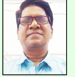
ଦେବା ପାଇଁ ହସ ଖୁସି ।

ଶ୍ରୀବତ୍ସ ମାସରେ ପୁନେଇଁ ଚିତ୍ତରେ କହୁ ହସେ କିଛି କିଛି, ଭାଇର ହାତରେ ଭଉଣୀ ବାନ୍ଧିବ ରେଖାମା ସୂତା ଡୋର ।