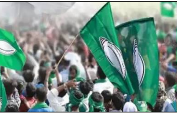
ଥିକା ଯାକପୁର ଏବେ ଗେରୁମାମୟ ହେବାରେ ଲାଗିଛି । ଯେଉଁଥିପାଇଁ ଛନ୍ଦକା ପଶିଛି ଦଳରେ । କାଳ ବିକଳ ନ କରି ପୁଣ୍ୟ ନିଜ ଯାକପୁର ବାସସଭ୍ୟମାନଙ୍କୁ ସମିତି ସଭ୍ୟଙ୍କୁ

ନେତାଙ୍କୁ ନେଇ ବୈଠକ କରୁଛନ୍ତି ନେତା । ଏପରିକି ନବୀନ ବି ପଞ୍ଚାୟତ ପ୍ରତିନିଧିଙ୍କ ସହ ଆଲୋଚନା କରୁଛନ୍ତି । ଆଉ ରାଜନୈତିକ ସମୀକ୍ଷକ ମତ ହେଲା ବିଜେଡି ପାଇଁ ଆଗକୁ ଅଧିକ ସଙ୍କଟ ଦେଖାଦେଉପାରେ । ବିଜେଡିକୁ ଗାଁ ଚିତା । ଭୁଶୁଭୁଛି ପଞ୍ଚାୟତ ସଂଗଠନ । ଦଳ ଛାଡ଼ୁଛନ୍ତି ବିଜେଡି ସମର୍ଥକ ପ୍ରତିନିଧି । ସରପଞ୍ଚ ଓ ସମିତି ସଭ୍ୟଙ୍କୁ ଏକାଠି ରଖିବାକୁ ଦଳପତି ଆରମ୍ଭ କଲେ ରଣନୀତି । ବିନେ ବିଜେଡିର ଗଡ଼