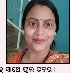
ନୂଆ ଫୁଲ ସାଥେ ଫୁଲ ରବର ।

ସୁନା ଭଉଣୀ ମୋ ସୁନା ଭଉଣୀ ଗହ୍ମା ପୁନେଇଁ ଅଧ୍ୟକ୍ଷ ହେଲାଣି । ଫରତା ହେଲାଣି ମେଘ ଆକାଶ ସୁରୁକ୍ଷ ଦିଶିଲେ ହୋଇ ହରଷ ।