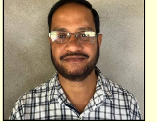
ତାରା ପୋତିଦେବା ହସିବ ଧରା ।

ଶ୍ରୀବତ୍ସ ପୁନେଇଁ ହସ୍ତୁଛି କହୁ କହୁ ଦେଖୁ ନାତେ କରଣ ମନ ମନରେ ଭଉଣୀ ବାନ୍ଧିଛି ଆଶା ଆଶା ତାର ଭାଇ ହେବ ଭରସା ଭରସା ପ୍ରତୀକ ରେଖାମା ପୂଜା ପୂଜାରେ ସାଜତା ସ୍ଵେଦ ମମତା ମମତା ଡୋରାର ନାଆଁଟି ରାକ୍ଷା ରାକ୍ଷା ସୁତ ସୁତ ପାଇଁଟି ସାକ୍ଷୀ ସାକ୍ଷୀ ରହୁ ଆମ ଏ କୁନିତାରା