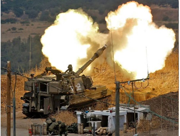
ଆଶଙ୍କା ବହୁଥିବା ସତର୍କମୂଳକ ଘଟଣାପଟୁ ନେଇଛନ୍ତି ଆମେରିକା ଓ ତ୍ରିଟେନ । ନିଜ ନିଜ ନାଗରିକକୁ ଲେବାନନ ଛାଡ଼ିବାକୁ ତ୍ରିଟେନ ଓ ଆମେରିକା ନିର୍ଦ୍ଦେଶ ଦେଇଛନ୍ତି । ପୂର୍ବରୁ ଭାରତ ମଧ୍ୟ ଲେବାନନରେ

ନୂଆଦିଲ୍ଲୀ, ୪/୮ : ଇରାନରେ ହମାସ୍ ନେତା ଉପମାଲ ହିନିଆଙ୍କ ହତ୍ୟା ପରେ ମଧ୍ୟପ୍ରାନ୍ତରେ ଉତ୍ତେଜନା ବଢ଼ିଯାଇଛି । ଇରାନର ଲେବାନନ ପକ୍ଷରୁ ଉପମାଲ ଉପରେ ନିକାଲ ମାଡ଼ କରାଯାଇଛି । ଏହି ସମୟରେ ଯୁଦ୍ଧ ସମୟରେ ବାହୁଥିବା ସାଉନ ଶୁଣିବାକୁ ମିଳିଛି । ଲେବାନନର ଆକ୍ରମଣ ପରେ ଉପମାଲ ପୁରା ଦେଶରେ ରେଡ ଅଲର୍ଟ ଜାରି କରିଛି । ତେବେ ଉପମାଲର ଦାବି ଲେବାନନର କ୍ଷେପଣାସୁକ୍ତ ଆଘାତର ଗୋଟିଏ ସମ୍ଭାଷଣରେ ମଝି ଆକାଶରେ ନଷ୍ଟ କରି ଦେଇଛି । ସେପଟେ ମଧ୍ୟପ୍ରାନ୍ତରେ ଯୁଦ୍ଧ