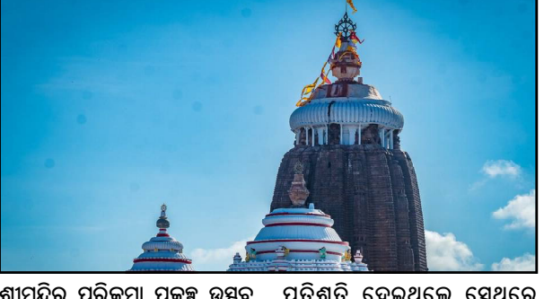
ଶ୍ରୀମନ୍ଦିର ପରିକ୍ରମା ପ୍ରକଳ୍ପ ଉତ୍ସବ ପାଇଁ ସେତେବେଳର ବିକେଡି ସରକାର, ସେଇ ମାସ ୬ରୁ ୧୬ ତାରିଖ ଯାଏଁ ସାରା ରାଜ୍ୟରେ ଲକ୍ଷ ଲକ୍ଷ ଟଙ୍କା ଖର୍ଚ୍ଚରେ ଜଗନ୍ନାଥ ପରିକ୍ରମା ଉତ୍ସବକୁ ଲୋକଙ୍କୁ ସଂଗ୍ରହ କରିଥିଲେ ଅର୍ପଣ ଚାଉଳ

ପୁରୀ, ୩/୮ (ନି.ପ୍ର): ୬ ମାସ ତଳେ ପ୍ରତି ଗାଁରୁ ସଂଗୃହୀତ ହୋଇଥିବା ହଜାର ହଜାର କୃଷାଳ ଅର୍ପଣ ଚାଉଳର ସ୍ଥିତି କ'ଣ ଅଛି ? ଜଗନ୍ନାଥଙ୍କୁ ସେଥିରେ ଭୋଗ ଲାଗୁଛି ତ ? ଏବେ ପୁଣି ଥରେ ଉଠିଲାଣି ଏମିତି ପ୍ରଶ୍ନ । କାରଣ ଶ୍ରୀମନ୍ଦିର ସୁଆର ମହାସୁଆର ନିୟୋଗ ସଫା ସଫା ଶୁଣାଇଛି, ପୋକ ଖୁଆ ଚାଉଳରେ ଠାକୁରଙ୍କୁ ଭୋଗ ଲାଗିବନି । ଆଉ ତଥ୍ୟ ନେବାରେ ଜଣାପଡ଼ିଛି ପ୍ରାୟ ୧୦ ହଜାର କୃଷାଳ ଅର୍ପଣ ଚାଉଳର ଅବସ୍ଥା ଏମିତି । ଯାହାକୁ ନେଇ ଭକ୍ତ ଏବେବକାଳ ସେମାନେ ଶ୍ରୀ ଜୀବନକୁ ବାକି