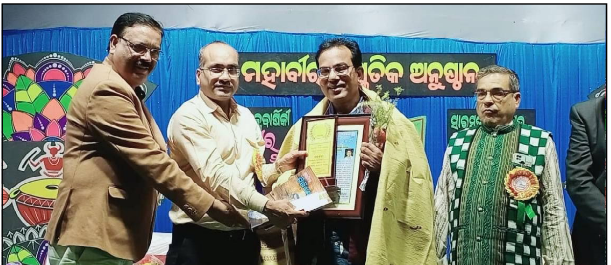
ସମ୍ବର୍ଦ୍ଧିତ ହେବାର ବିରଳ ମୁହୂର୍ତ୍ତ...