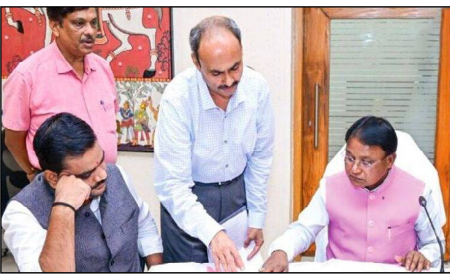
ଶିଳ୍ପ ସ୍ୱାପନ ପାଇଁ ଉତ୍ସାହିତ କରିବାକୁ ମଧ୍ୟ ସେ ପରାମର୍ଶ ଦେଇଥିଲେ । ସମୀକ୍ଷା ସମୟରେ ମୁଖ୍ୟମନ୍ତ୍ରୀ କହିଥିଲେ କେନ୍ଦୁଝର ପରି ଖଣିକ ସମ୍ପଦ ସମୃଦ୍ଧ ଜିଲ୍ଲାରେ ଏ ପର୍ଯ୍ୟନ୍ତ ମେଗା ଷ୍ଟିଲ ପ୍ଲାନ୍ଟ ହୋଇପାରି ନାହିଁ । ଜିଲ୍ଲାରେ ଖଣିକ ସମ୍ପଦ ସହ ଜମି, ଜଳ, ବିଦ୍ୟୁତ୍, ଯୋଗାଯୋଗର ସୁବିଧା ଆଦି ସବୁ ଆନୁଷ୍ଠାନିକ ଭିତ୍ତିଭୂମିର ସୁବିଧା ମଧ୍ୟ ରହିଛି । ଟେକ୍ସ ସେଠାରେ ମେଗା ଷ୍ଟିଲ ପ୍ଲାନ୍ଟ ସ୍ଥାପନା କରିବାକୁ ମୁଖ୍ୟମନ୍ତ୍ରୀ କହିଥିଲେ ।

ଭୁବନେଶ୍ୱର, ୩/୮ (ନି.ପ୍ର): ମୁଖ୍ୟମନ୍ତ୍ରୀ ମୋହନ ଚରଣ ମାଝୀ ଶନିବାର ଲୋକସେବା ଭବନରେ ରାଜ୍ୟର ଶିଳ୍ପ କ୍ଷେତ୍ରରେ ଅଗ୍ରଗତି ସମୀକ୍ଷା କରି ଅଧିକ ନିଯୁକ୍ତି ପ୍ରଦାନକାରୀ କ୍ଷେତ୍ର ଗୁଡ଼ିକ ଉପରେ ଗୁରୁତ୍ୱପ୍ରଦାନ କରିବାକୁ ପରାମର୍ଶ ଦେଇଛନ୍ତି । ମୁଖ୍ୟମନ୍ତ୍ରୀ କହିଥିଲେ ଯେ ଆଗାମୀ ୫ ବର୍ଷରେ ରାଜ୍ୟରେ ୩.୫ ଲକ୍ଷ ନିଯୁକ୍ତି ସମାବଦନା ସୃଷ୍ଟି କରିବାକୁ ରାଜ୍ୟ ସରକାର ଲକ୍ଷ୍ୟ ରଖୁଛନ୍ତି । ଟେକ୍ସଟାଇଲ, ଖାଦ୍ୟ ପ୍ରକ୍ରିୟାକରଣ ପରି କ୍ଷେତ୍ରଗୁଡ଼ିକରେ ଅଧିକ ନିଯୁକ୍ତି ସମାବଦନା ରହିଛି । ଟେକ୍ସ ଏ ସବୁ କ୍ଷେତ୍ରରେ କିପରି ଅଧିକ ଶିଳ୍ପ ପ୍ରତିଷ୍ଠା ହୋଇପାରିବ ସେଥି ପ୍ରତି ଧ୍ୟାନ ଦେବାକୁ ସେ ପରାମର୍ଶ ଦେଇଥିଲେ । ଏ ସବୁ କ୍ଷେତ୍ରରେ ଓଡ଼ିଆ ଉଦ୍ୟୋଗୀମାନଙ୍କୁ