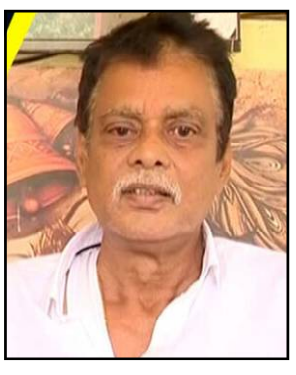
ଯେତେବେଳେ ବିଜେଡି ନେତା ଅନୁଭବ କରୁଛନ୍ତି ଯେ ବିଜେଡି ଦଳରେ ତାଙ୍କର ଆଉ ଭବିଷ୍ୟତ ନାହିଁ ସେମାନେ