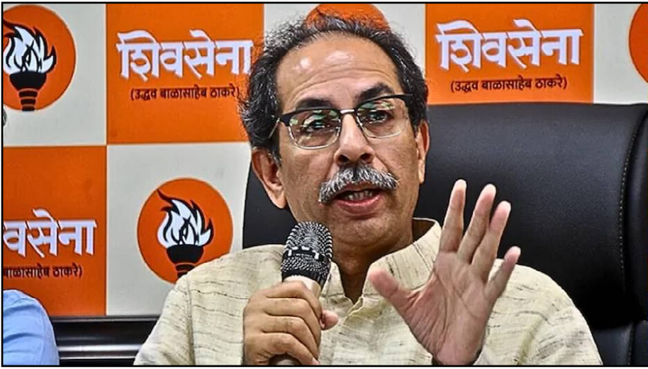
କଶେ ଶାହ । ଯେଉଁମାନେ ନୃପ୍ତାକ ସେମାନେ ଆମକୁ ହିନ୍ଦୁର ଶିକ୍ଷା ବିଭାଜନ କରିବାର ମାହିର । ଶରିଫଙ୍କ ସହ କେକ ଖାଉଥିଲେ, ଦେଉଛନ୍ତି । ବିଜେପି ଦଳଗୁଡ଼ିକୁ ଆମେ ଆମର ହିନ୍ଦୁ କଥା କହି

ନୂଆଦିଲ୍ଲୀ, ୩/୮ : ସ୍ୱରାଷ୍ଟ୍ର ମନ୍ତ୍ରୀ ଅମିତ ଶାହାଙ୍କ ଉପରେ ଆଜି କୋରଦାର ହମଲା କରିଛନ୍ତି ଶିବସେନା(ୟୁପିଏ) ମୁଖ୍ୟ ଉଦ୍ଧବ ଠାକର। ସେ ଶ୍ରୀ ଶାହାଙ୍କୁ ଆପତ୍ତାନ ଶାସକ ଅହମଦ ଶାହ ଅବଦାଲିକ ରାଜନୀତିକ ବଂଶଜ ବୋଲି କହି ସମାଲୋଚନା କରିଛନ୍ତି । ପାନିପତ ମୁହରର ଅବଦାଲି ମରାଠା ଶାସକଙ୍କୁ ପରାସ୍ତ କରିଥିଲେ । ପୁନେରେ ଦଳୀୟ କର୍ମକର୍ତ୍ତାଙ୍କୁ ସମୋାଧନ କରି ବିଜେପି କ୍ଷମତା ଜିତାଦରେ ଲିପୁ ରହିଥିବା ଉଦ୍ଧବ ଅଭିଯୋଗ କରିଛନ୍ତି । ସେ କହୁଛନ୍ତି, “ଅହମଦ ଶାହ ଅବଦାଲି ମଧ୍ୟ