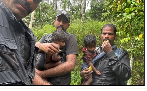
ଆଶାର କିଛି ଛବି । କଳପେଟା ରେଞ୍ଜର ବନାଧିକାରୀଙ୍କ ନେତୃତ୍ୱରେ ୪ ଜଣିଆ ନେତୃତ୍ୱ ଗୁଡ଼ିଏ ବାହାରିଥିଲେ ଖୁସନାତ ଅଭିମୁଖେ, ଉଦ୍ଧାର କାର୍ଯ୍ୟ ପାଇଁ । ରାଷ୍ଟ୍ରୀୟ ଶାନ୍ତି ବିପଜ୍ଜନକ । ଘଟଣା ଜଳାଭିତରେ ଖସିବା ପଥର । ହେଲେ କିଛି ଆଦିବାସୀ ପରିବାରକୁ ବଞ୍ଚାଇବାକୁ ଥିଲା । ଏଥିପାଇଁ ନିଜ ଜୀବନକୁ ବାକି

ନୂଆଦିଲ୍ଲୀ, ୩/୮ : କେରଳ ଖୁସନାତ ଭୟଙ୍କର ଭୂକମ୍ପନର ୫ ଦିନ ପରେ ସେଠାରୁ ଆସିଛି ହୃଦୟବିଚାରକ ଦୃଶ୍ୟ, ଯାହା ଦେଖିଲେ କାହାରିବି ଆଶୁ ଓଦା ହୋଇଯିବ । ଯେଉଁଠି ପ୍ରକୃତିର କରାଳ ଗତି ଶହଶହ ଜୀବନ ନେଲା, ଆଉ କେତେ କାର୍ଯ୍ୟ ନିଷ୍ପାଦକ ହୋଇଗଲେ, ସେଠାରୁ ଆସିଛି ମୃତ୍ୟୁ ଭିତରେ ଜୀବନର