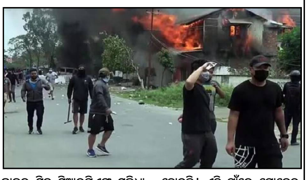
କାତର ସ୍ଥିତି ସୁଧାରପିଏସ ସୁବିଧା କେନ୍ଦ୍ରରେ ଆୟୋଜିତ ଏକ ବୈଠକରେ ମୁହାଁମୁହିଁ ଠିଆ ହୋଇଥିବା ଉଦ୍ଧବ ପକ୍ଷ ମଧ୍ୟରେ ଏକ ଚୁକ୍ତି ହୋଇଥିଲା । ତେବେ ଏହି ଚୁକ୍ତିନାମାର ୨୪ ଘଣ୍ଟା ମଧ୍ୟରେ ଜିରିବାମର ଲାଲପାନି ଗାଁରେ ହିଂସା ଘଟିଛି । ଶୁକ୍ରବାର ରାତିରେ ସଶସ୍ତ୍ର ଲୋକମାନେ ଗାଁର ଏକ ଘରେ ନିଆଁ ଲଗାଇ ଦେଇଛନ୍ତି । ଗାଁକୁ ଚାରେଟ କରି ଅନେକ ରାଜଶୁ ଚୁକ୍ତି ମାଡ ମଧ୍ୟ ହୋଇଛି । ଏହି ଗାଁରେ ମୋଡେର ସମ୍ପ୍ରଦାୟର କେତେକ ଖାଲି ଘର ରହିଛି । ଏହି ଘଟଣା ପରେ ସେଠାକୁ ସୁରକ୍ଷା ବାହିନୀକୁ ପଠାଯାଇଥିଲା । ଅଧିକାରୀମାନେ କହିଛନ୍ତି ଯେ ଦୁର୍ଗମାନେ ଅସ୍ତ୍ରାଘାତ ଘଟାଇ ଏହି ଅଞ୍ଚଳରେ ସୁରକ୍ଷା ଅଭାବର ସୁଯୋଗ ନେଇଥିଲେ । ତେବେ ଏହି ହିଂସାକାଣ୍ଡ ଘଟାଇଥିବା ଲୋକଙ୍କୁ ଏପର୍ଯ୍ୟନ୍ତ ଚିହ୍ନଟ କରାଯାଇ ନାହିଁ ।

ନୂଆଦିଲ୍ଲୀ, ୩/୮ : ମଣିପୁରରେ ଅମୁନି ହିଂସା । ଶାନ୍ତି ଚୁକ୍ତିର ୨୪ ଘଣ୍ଟା ଭିତରେ ଏଠାରେ ପୁଣି ଥରେ ହିଂସା ଘଟିଛି । ଗୋଟିଏ ପଟେ ମଣିପୁରର ଜିରିବାମରେ ଶାନ୍ତି ବଜାୟ ରଖିବା ପାଇଁ ମୋଡେର ଏବଂ ହମାର ସମ୍ପ୍ରଦାୟ ମଧ୍ୟରେ ଏକ ଚୁକ୍ତି ହୋଇଥିବା ବେଳେ ଆଉ ଗୋଟିଏ ପଟେ ମୋଡେର କଲୋନୀରେ ଗୁଲିମାଡ ହୋଇଛି । ସେହିପରି ଦୁର୍ଗମାନେ ଲାଲପାନି ଗାଁରେ ଥିବା ଏକ ଘରେ ନିଆଁ ଲଗାଇ ଦେଇଛନ୍ତି । ମଣିପୁର ହିଂସା ପ୍ରକାରିକା ଜିରିବାମ ଜିଲ୍ଲାରେ ସ୍ଥିତି ସୁଧାରିବା ଏବଂ ଶାନ୍ତି ଫେରାର ଆଣିବା ପାଇଁ ମୋଡେର ଏବଂ ହମାର ସମ୍ପ୍ରଦାୟର ମଧ୍ୟରେ ଶାନ୍ତି ଚୁକ୍ତି ହୋଇଛି । ପ୍ରତିନିଧିମାନେ ମିଳିତ ଭାବେ କାର୍ଯ୍ୟ କରିବାକୁ ରାଜି ହୋଇଥିଲେ । ଗୁରୁବାର ଆସାମର