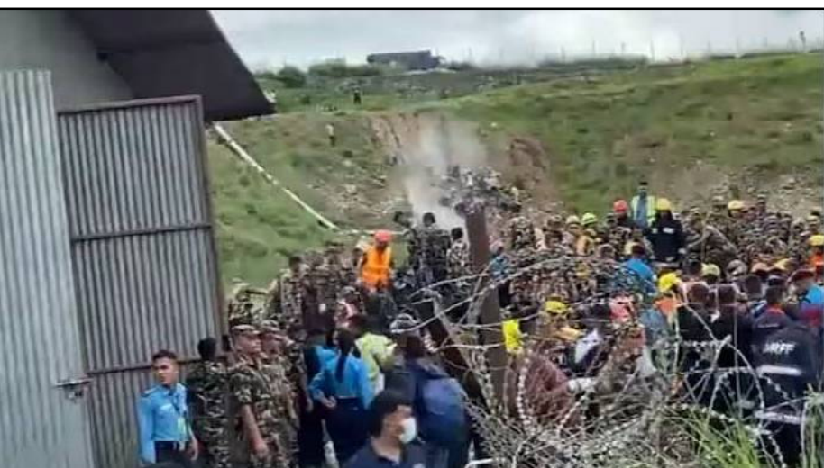
ରିପୋର୍ଟ ମୁତାବକ, ଉଚ୍ଚ ବିମାନଟି ଯୌର୍ଯ୍ୟ ଏୟାରଲାଇନର ଥିଲା। ଏହା ଆଜି ସକାଳ ୧୧ଟାରେ ୧୯ ଜଣ ଯାତ୍ରୀଙ୍କୁ ନେଇ ବିମାନଟି ପୋଖରୀ ଯାଉଥିବାବେଳେ ବିମାନଟି ଦୁର୍ଘଟଣାଗ୍ରସ୍ତ ହୋଇଛି।

ଅନୁଗୋଳ, ୨୪/୭ : ଦୁର୍ଘଟଣାଗ୍ରସ୍ତ ହେଲା ଯାତ୍ରୀବାହୀ ବିମାନ। ଟେକ୍ ଅଫ୍ ବେଳେ ବିମାନରେ ଲାଗିଲା ନିଆଁ। ଏଥିରେ ୧୮ ଜଣ ଯାତ୍ରୀଙ୍କ ମୃତ୍ୟୁ ହୋଇଛି। ନେପାଳରେ ଏହି ଦୁର୍ଘଟଣା ଘଟିଛି। ଆଜି କାଠମାଣ୍ଡୁର ଟ୍ରିଭୁନ ଅନ୍ତର୍ଜାତୀୟ ବିମାନ ବନ୍ଦରରେ ୧୯ଜଣ ଯାତ୍ରୀଙ୍କୁ ନେଇ ଉଡ଼ାଣ ଆରମ୍ଭ କରିଥିଲା ବିମାନ। ଉଡ଼ାଣ ବେଳେ ବିମାନଟି କ୍ରାନ୍ତ ହୋଇଯାଇଥିଲା। ଟେକ୍ ଅଫ୍ କରିବା ବେଳେ ରତ୍ନପୁରୁ ଖସିଯାଇଥିଲା ବିମାନ। ଏହାପରେ ବିମାନରେ ନିଆଁ ଲାଗିଥିଲା। ଏହି ଦୁର୍ଘଟଣା ପରେ ୧୮ ଜଣ ଯାତ୍ରୀଙ୍କ ମୃତ୍ୟୁବେଦ ଉଦ୍ଧାର ହୋଇଛି। ସ୍ଥାନୀୟ ମିଡିଆ