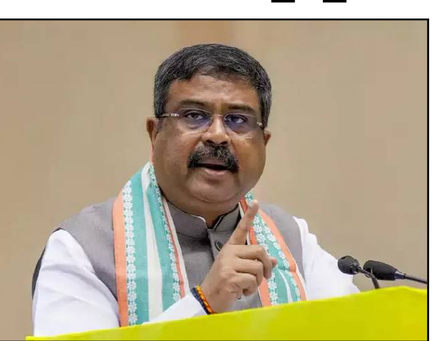
ଧର୍ମେନ୍ଦ୍ର ପ୍ରଧାନ ଏବଂ କେନ୍ଦ୍ର ସହକର୍ମୀ ପରିବହନ ଓ ରାଜପଥ ମନ୍ତ୍ରୀ ନୀତିଶ କୁମାରଙ୍କୁ ଧନ୍ୟବାଦ ଜଣାଇଛନ୍ତି କେନ୍ଦ୍ର ଶିକ୍ଷା ମନ୍ତ୍ରୀ ଧର୍ମେନ୍ଦ୍ର ପ୍ରଧାନ। ଶ୍ରୀ ପ୍ରଧାନ ଏ ସମ୍ପର୍କରେ ଏହିଭାବେ ଉଲ୍ଲେଖ

କରିଛନ୍ତି ଯେ ଓଡ଼ିଶାରେ ୨୩, ୮୮୨ କୋଟି ଟଙ୍କା ବ୍ୟୟରେ ୪୧୩ କିମି ଲମ୍ବ ଦାରି ଲେନ୍ ବିଶିଷ୍ଟ 'କୋଷ୍ଠାଳ ହାଇଡ୍ରୋ' ନିର୍ମାଣ କରିବା ପ୍ରକ୍ରିୟାକୁ ଚାଲିଥିବା ସମ୍ବନ୍ଧରେ ଧର୍ମେନ୍ଦ୍ର ପ୍ରଧାନ ଏବଂ କେନ୍ଦ୍ର ସହକର୍ମୀ ପରିବହନ ଓ ରାଜପଥ ମନ୍ତ୍ରୀ ନୀତିଶ କୁମାରଙ୍କୁ ଧନ୍ୟବାଦ ଜଣାଇଛନ୍ତି କେନ୍ଦ୍ର ଶିକ୍ଷା ମନ୍ତ୍ରୀ ଧର୍ମେନ୍ଦ୍ର ପ୍ରଧାନ। ଶ୍ରୀ ପ୍ରଧାନ ଏ ସମ୍ପର୍କରେ ଏହିଭାବେ ଉଲ୍ଲେଖ