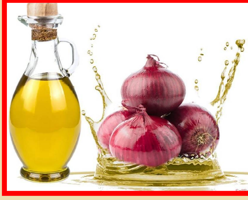
ବର୍ତ୍ତମାନ ଏଥିରେ ଅତ୍ୟାବଶ୍ୟକ ତେଲ ମିଶାନ୍ତୁ । ଉତ୍ତମ ସୁଗନ୍ଧ ପାଇଁ ଆପଣ ଏଥିରେ ଅଳ୍ପ କିଛି ଏସେନ୍ସିଆଲ୍ ତେଲ ମିଶାଇ ପାରିବେ । ବର୍ତ୍ତମାନ ପିଆଜ ତେଲ ଏବଂ ଏହି ଏସେନ୍ସିଆଲ୍ ତେଲକୁ ଭଲ ଭାବରେ ମିଶାନ୍ତୁ । ଏହା ପରେ ଏହି ତେଲକୁ ଏକ ସଫା ପାତ୍ର କିମ୍ବା ବୋତଲରେ ରଖନ୍ତୁ ।

ପ୍ରସ୍ତୁତ ପ୍ରଣାଳୀ: ପିଆଜର ଉପର ତୋପାକୁ ଭଲଭାବେ ଛତେଇ ଦିଅନ୍ତୁ । ଏହା ପରେ ପିଆଜକୁ ଛୋଟ ଛୋଟ ଖଣ୍ଡ କରି କାଟି ଦିଅନ୍ତୁ ଏହା ପରେ ଏହାକୁ ଭଲ ଭାବେ ଗ୍ରାଉଣ୍ଡ କରି ଏକ ଟିକ୍ସା ପେଷ୍ଟ ପ୍ରସ୍ତୁତ କରନ୍ତୁ । ଏହା ପରେ, ଏକ ପତଳା କପଡାରେ ଏହି ପିଆଜ ପେଷ୍ଟକୁ ଛାଣନ୍ତୁ । ଏହି ରସକୁ ସଂପୂର୍ଣ୍ଣ ରୂପେ ବାହାରକୁ ଯିବାକୁ ଦେଖା କରନ୍ତୁ । ଏହା ପରେ ଗମ୍ଭୀରରେ କଡେଇ ବସାନ୍ତୁ ଏବଂ ନଡିଆ, ଅଳ୍ପ କିମ୍ବା ଅନ୍ୟ କୌଣସି ତେଲ ପକାଇ ହଲୁକା ଗରମ କରନ୍ତୁ । ତେଲ ଗରମ ହେବା ପରେ ଏଥିରେ ପିଆଜ ରସକୁ ପକାନ୍ତୁ । ଏହାକୁ ୧୫ ରୁ ୨୦ ମିନିଟ୍ ପର୍ଯ୍ୟନ୍ତ କମ୍ ନିଆଁରେ ଗରମ କରନ୍ତୁ । ଏହାକୁ ଧିରେ ଧିରେ ଘାଣ୍ଟନ୍ତୁ, ଯେପରି ଏହା ଯୋଡି ନ ଯାଏ । ବର୍ତ୍ତମାନ ଏହାକୁ ଅଳ୍ପ ହେବାକୁ କିଛି ସମୟ ଛାଡିଦିଅନ୍ତୁ । ବର୍ତ୍ତମାନ ଏହାକୁ ଭଲ ଭାବେ ଛାଣିଦିଅନ୍ତୁ ଯେପରି କୌଣସି ବୁଲୁଡା ଅଂଶ ନ ରୁହେ । ବାସ୍ତା ପାଇଁ: