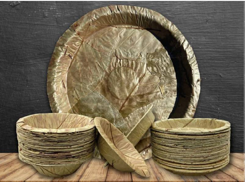
ଆମ ଓଡ଼ିଶାର ଆଦିବାସୀ ଲୋକମାନେ ମେଝାଉଥାନ୍ତି । ମାତ୍ର ଏବେ ଓଡ଼ିଶା ବିଦେଶରେ ଏବଂ ଶାଳପତ୍ରରେ ପ୍ଲେଟ୍ ତିଆରି କରି ବକାରରେ ବିକି ନିଜର ଗୁରୁତ୍ୱାଗ ପାଇବାରେ ଲାଗିଛି । ଅନ୍ୟପକ୍ଷରେ

ବିଦେଶରେ ହୋଟେଲମାନଙ୍କରେ ଏହାର ଚାହିଦା ବୃଦ୍ଧି ପାଇବାରେ ଲାଗିଛି । ବିଶେଷ କରି ୟୁରୋପରେ ଏହି ଶାଳପତ୍ର ଓ କେନ୍ଦୁପତ୍ର ପ୍ଲେଟ୍ରେ ଚାହିଦା ଅଧିକ ରହିଥିବା ଜଣାପଡ଼ିଛି । ୟୁରୋପର ବହୁ ବଡ଼ ହୋଟେଲମାନଙ୍କରେ ଗ୍ରାହକମାନଙ୍କୁ ଏହି ପ୍ଲେଟ୍, ସାହାଯ୍ୟରେ ଖାଦ୍ୟ ପରଷି ଦିଆଯାଉଥିବା ଜଣାଯାଇଛି । ଶାଳପତ୍ର ଓ କେନ୍ଦୁପତ୍ରରେ ପ୍ରସ୍ତୁତ ପ୍ଲେଟ୍ କୌଣସି ପ୍ରକାର ଖରାପ ବାସ୍ତୁ ଆଦି ନଥାଏ । ଆଦିବାସୀମାନେ ଏସବୁ ଜଙ୍ଗଲରୁ ସଂଗ୍ରହ କରି ଆଣିଥାନ୍ତି ଓ ଅଳ୍ପ ଖର୍ଚ୍ଚରେ ପ୍ରସ୍ତୁତ କରିଥାନ୍ତି ଏହି ପ୍ଲେଟ୍ । ଏହି ପ୍ଲେଟ୍ରେ ଖାଇବା ଦ୍ୱାରା ଭିନ୍ନ ଏକ ଆନନ୍ଦ ମିଳିଥାଏ । ତେଣୁ ଏହାର ଚାହିଦା ୟୁରୋପରେ ହୋଟେଲମାନଙ୍କରେ ବୃଦ୍ଧି ପାଇବାରେ ଲାଗିଛି । ବିଦେଶରେ ଏହାର ଚାହିଦା ବୃଦ୍ଧି ପାଇବା ଦ୍ୱାରା ଆଦିବାସୀମାନଙ୍କୁ ଏବେ