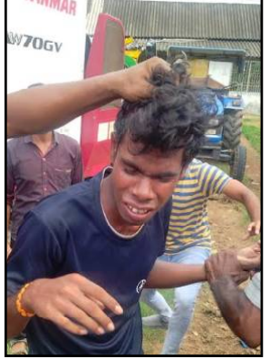
ଚେଶ୍ୱ ପେଟ୍ରୋଲିଂ ବ୍ୟବସ୍ଥା କଡ଼ାକଡ଼ି କରିବାକୁ ସାଧାରଣରେ ଦାବି ହେଉଛି ।

ଆସି ଉକ୍ତ ଯୁବକ ଓ ବାଇକ୍‌କୁ ଆନାକୁ ନେଇଯାଇଥିଲେ । ପରେ ରାତି ୧୦ଟାରେ ବାଇକ୍ ମାଲିକଙ୍କୁ ହସ୍ତାନ୍ତର କରାଯାଇଥିବା ଜଣାଯାଇଛି । ଯୁବକର ପରିଚୟ ମିଳିପାରିନଥିବା ପୁଲିସ୍ କହିଛି । ପ୍ରକାଶଯୋଗ୍ୟ ଗତ ୧୦ ଦିନ ମଧ୍ୟରେ ୫ଟି ବାଇକ୍ ହେଡ଼ରା ହୋଇଥିବା ବଣିକ ସଂଘ ପକ୍ଷରୁ ପ୍ରକାଶ ପର୍ଯ୍ୟବେଶ ସାମାଜ ୬୦ ଜାତୀୟ ରାଜପଥ ଓ ୫୭ ରାଜ୍ୟ ରାଜପଥ ନିକଟରେ ଜଳେଶ୍ୱର ଅବସ୍ଥିତ ହୋଇଥିବାରୁ ଚୋରୀ, ଲୁଚେରାଜ ବଢିବାରେ ଲାଗିଛି ।