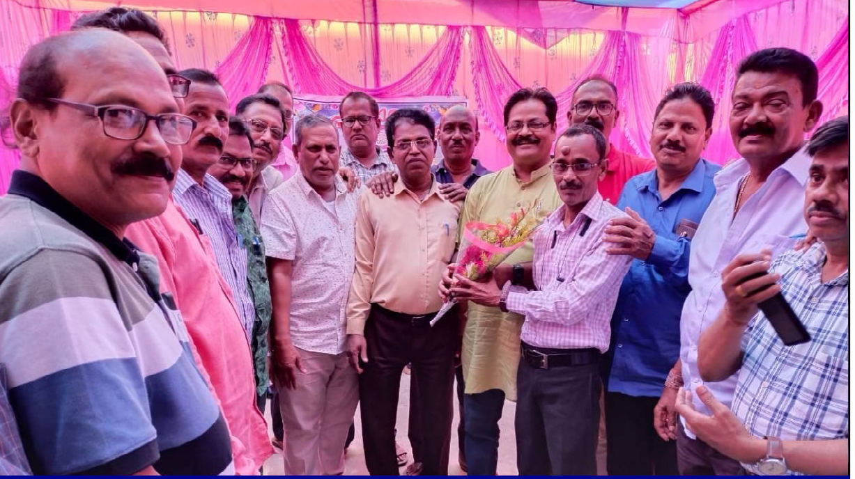
ସହପାଠୀ ବନ୍ଧୁମାନଙ୍କ ଦ୍ଵାରା ସମ୍ବର୍ଦ୍ଧିତ ହେବାର ବିରଳ ମୁହୂର୍ତ୍ତ...

■ ମୋ ପିଲାଦିନେ ମୁଁ ଦେଖୁଛି, ଆମ ଗାଁକୁ ଯୋଗାମାନେ କେନ୍ଦେରା ବଜାର ଭିକ ମାଗିବାକୁ ଆସୁଥିଲେ । ସେମାନେ ସାଙ୍ଗରେ କିଛି ଚିଠି ବହି ବିକିବାକୁ ଆଣୁଥିଲେ । ଶୁଆଖାରୀ କଥା, ଖୁଲଣା ସୁନ୍ଦରୀ କଥା, ରାଜାପୁଅ- କବୁଆଳ ଝିଅ କଥା ଇତ୍ୟାଦି ଇତ୍ୟାଦି । ଗାଁର ସା