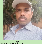
ପୁସ୍ତ ଦରଶନେ ସାଇଁ। ଭକ୍ତ ମାତୃକା ପୂର୍ଣ୍ଣ କର ବିଲୁ ଏତିକି ମିନତି ମୋର ଦୁଃଖ ସଦାପଳୁ ହରି ନେଇ ପ୍ରଭୁ ଜଗତ କଳ୍ୟାଣ କର। +ମାଧବପୁର, ଜଳେଶ୍ୱର, ବାଲେଶ୍ୱର

କମ୍ପାଏ ମେଦିନୀ ପୁରୀ ସୁସଜ୍ଜିତ ରଥେ ଜନ ଗହଳିରେ ଡାହୁଳ ପକାଏ ହୁରି। ଜଗର ଉତ୍ସୁକ ବଡ଼ି ବଡ଼ି ଚାଲେ ଆଗକୁ ଗଡ଼ିଲେ ରଥ ମାଉସୀ ଆଖିରେ ପଲକ ପଡ଼ୁନି ବାହିଁ କାଳିଆର ପଥ। ବଡ଼ ଦାଣ୍ଡେ ଆଜି ଶ୍ରୀଜଗନ୍ନାଥଙ୍କ ମୁକ୍ତ ଦରଶନ ପାଇଁ ଦେଶ ଦେଶାନ୍ତରୁ ଭକ୍ତ ଧାଇଁଛି