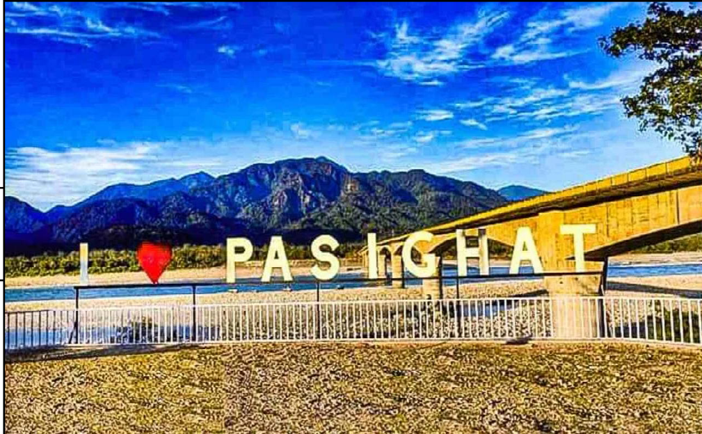
ଦେଖି ଏହି ଅଭୟାରଣ୍ୟ : ପାସିଫିକର ଅନ୍ୟତମ ପର୍ଯ୍ୟଟନ କେନ୍ଦ୍ର ହେଉଛି ଏହି ଅଭୟାରଣ୍ୟ। ସାଇବେରିଆ, ମଙ୍ଗୋଲିଆ ଆଦି ଦେଶରୁ ଆସିଥିବା ଅତିଥି ନଦୀର ମିଳନସ୍ଥଳ ପାନଟିରେ ଦେଖିବାକୁ ମିଳେ ସବୁଜ ଜଳରାଶିର ଅପରୂପ